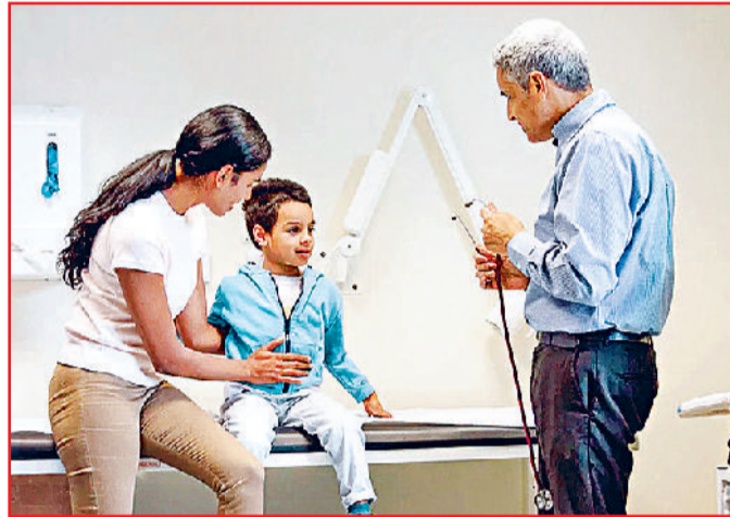
किसी भी खिलौने से खेलते वक्त पूरे खिलौने के साथ खेलते हैं। जबकि ऑटिस्टिक बच्चे पूरे खिलौने के साथ न खेलकर उसके किसी हिस्से के साथ खेलते रहते हैं जैसे खिलौने में बनी आंख या कान के साथ। या फिर खिलौने के साथ एक पैटर्न में ही खेलता रहता है।

किसी भी खिलौने से खेलते वक्त पूरे खिलौने के साथ खेलते हैं। जबकि ऑटिस्टिक बच्चे पूरे खिलौने के साथ न खेलकर उसके किसी हिस्से के साथ खेलते रहते हैं जैसे खिलौने में बनी आंख या कान के साथ। या फिर खिलौने के साथ एक पैटर्न में ही खेलता रहता है। कुछ बच्चे अपनी अंगुलियों के साथ ही खेलते रहते हैं। सबसे बड़ी बात कि वो इतना ध्यानमग्न होकर खेलता है कि उसे आस-पास होने वाली एक्टिविटीज या हमारे बुलाने का भी पता नहीं चलता।