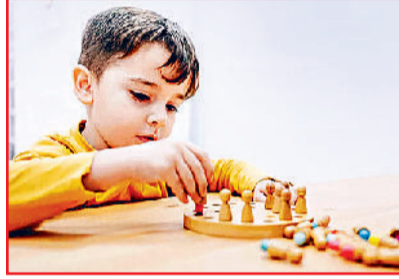
बहला-फुसला कर दूसरे पैरेंट के पास जाने के लिए कहते हैं, तो वह उसका प्रतिरोध करता है। किसी भी तरह के बदलाव को स्वीकार नहीं

सोशल कम्प्यूनिकेशन रेस्पॉन्स: सोशल कम्प्यूनिकेशन में अगर 3-5 महीने का बच्चा आई कॉन्टैक्ट नहीं करता या उन्हें देख नहीं रहा या पैरेंट्स के पुचकारने के बावजूद स्माइल नहीं देता। या फिर जब बच्चा पैरेंट्स के साथ ठीक तरह से ट्रीक नहीं करता यानी, बच्चे के साथ खेलने पर वह मूवमेंट पर ध्यान नहीं देता, दूसरी तरफ देखता रहता है। इसी तरह 12-16 महीने का होने पर जब बच्चा कोई नई चीज या खिलौना देने पर कोई रेस्पॉन्स नहीं देता, खुशी जाहिर नहीं करता या स्माइल तक नहीं करता।