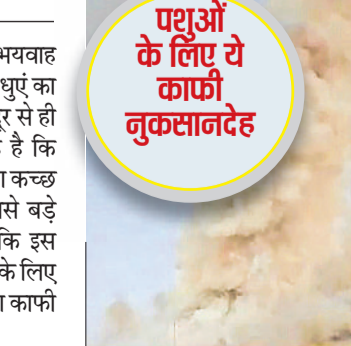
एशिया के सबसे बड़े घास के मैदान में भयवाह आग लगी हुई है। आग लगने की वजह से धुएँ का गुबार काफी ऊपर तक उठ रहा है, जिसे दूर से ही देखा जा सकता है। आग इतनी भयवाह है कि लफटें दूर से ही दिख रही हैं। ये भयवाह आग कच्छ के बन्नी इलाके में स्थित एशिया के सबसे बड़े घास के मैदान में लगी हुई है। बता दें कि इस इलाके में गर्मी के मौसम में पशु घास चरने के लिए आते रहते हैं। ऐसे में पशुओं के लिए ये आग काफी नुकसानदायक साबित होगी।

दलापुर गांव से बोरीगुम्मा ब्लॉक के ग्राम नुआगांव की ओर जा रहे थे। पुलिस ने बताया कि चालक ने खचाखच थरी पिकअप वैन पर से नियंत्रण खो दिया, जिसकी वजह से वाहन पलट गया। पुलिस और दमकल कर्मी मौके पर पहुंचे और कुंद्रा थाना क्षेत्र में खटलापदर पुल के नजदीक हुई। विवाह समारोह में शामिल होने के लिए लोग वाहन में सवार होकर बोइरगुम्मा ब्लॉक के