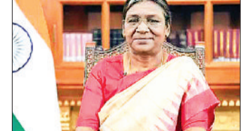
एजेसी। नई दिल्ली

केंद्र सरकार ने लोकसभा चुनाव की तारीखों का नोटिफिकेशन जारी कराने के लिए प्रक्रिया शुरू कर दी है। केंद्रीय कैबिनेट ने चुनाव आयोग (ईसी) के सात चरण वाले चुनाव की तारीखों के प्रस्ताव को राष्ट्रपति को भेजा है। इसके बाद राष्ट्रपति मुर्मू चुनाव की तारीखों की अधिसूचना जारी करेंगी। पहली अधिसूचना 20 मार्च को जारी की जाएगी। इसके तहत 19 अप्रैल को 102 सीटों पर चुनाव कराए जाने हैं। अधिसूचना जारी होने के बाद प्रत्याशियों के नामांकन की प्रक्रिया शुरू हो जाती है। देश में 18वीं लोकसभा के लिए 19 अप्रैल से चुनाव शुरू होंगे। इसके बाद 26 अप्रैल, 7 मई, 13 मई, 20 मई, 25 मई, 1 जून को सात चरण में चुनाव होंगे।