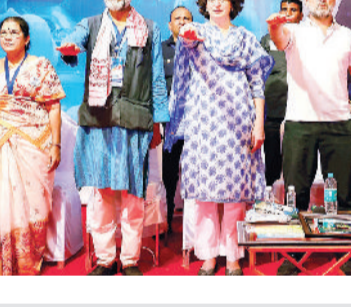
राहुल ने कहा, जब हमारी सरकार ने किसान कर्ज माफ़ी की बात की तो भाजपा ने कहा कि किसान आलसी हो जाएंगे। मनरेगा लागू तो कहा कि मजदूरों की आदत बिगड़ जाएगी। वे चंद उद्योगपतियों का लाखों-करोड़ों का कर्ज माफ़ करते हैं तो क्या उनकी आदत नहीं बिगड़ती? आज एक तरफ़ कुछ लोगों के पास देश का पूरा धन है। लोग परेशान हैं।

राहुल गांधी ने कार्यकर्ताओं को संबोधित करते हुए कहा कि इलेक्टोरल बॉन्ड के जरिए हिंदुस्तान में वसूली चल रही है। कोई भी कुछ बोलता है तो ईडी, सीबीआई, आईटी उन्हें डराने पहुंच जाती है। राहुल ने कहा कि अडानी को रेलवे, सड़क, सुरक्षा और खिलौने, इन सभी सेक्टर से पैसा मिलता है। अडानी का मतलब नरेंद्र मोदी ही हैं। दोनों एक ही हैं। आप इन्हें 'मोडानी' भी कह सकते हैं। इससे केंद्र सरकार के लिए नफरत फैलाने में मदद मिलेगी। राहुल ने कहा कि पीएम मोदी बोलते थे कि उन्हें देश से भ्रष्टाचार मिटाना है। लेकिन वे क्या हो रहा है?