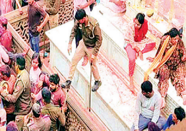
बरसाना। तीर्थनगरी मथुरा के बरसाना में रविवार को लड्डू होली का आयोजन किया गया। इसका देश-विदेश से आए श्रद्धालुओं ने आनंद लिया। इसी बीच भीड़ अनियंत्रित हो गई। दबाव बढ़ने से मंदिर की रेलिंग टूट गई। एक के ऊपर एक कई श्रद्धालु गिर गए। हादसे में करीब 10 श्रद्धालु घायल हो गए। आनन फानन उन्हें स्वास्थ्य सुविधा कराई गई। बरसाना में लड्डू होली खेलने के लिए लाखों श्रद्धालु पहुंचे। इस दौरान पुलिस-प्रशासन की व्यवस्था ध्वस्त नजर आई। भीड़ का दबाव बढ़ने से मंदिर परिसर में रेलिंग टूट गई। हादसे में करीब 10 श्रद्धालु घायल हो गए। बताया वरें कि लड्डू होली में प्रसादी स्वयं लड्डू लुटाए जाते हैं। जिन्हें लुटने के लिए श्रद्धालु टूट पड़ते हैं। इसी दौरान हादसा हो गया।