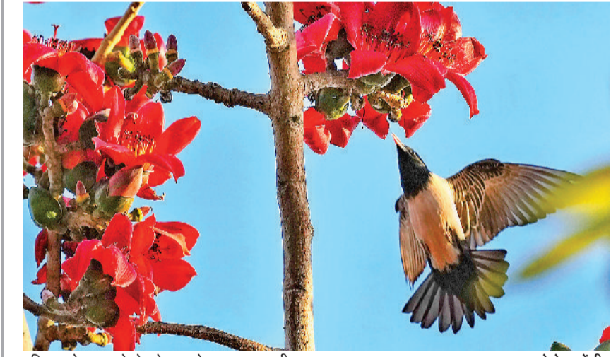
रविवार को कपास के पेड़ के फूल के पास उड़ता पक्षी।