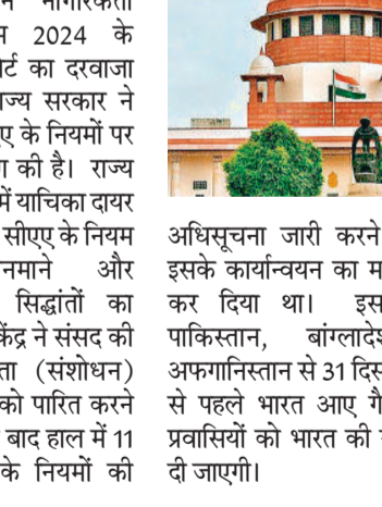
अधिसूचना जारी करने के साथ इसके कार्यान्वयन का मार्ग प्रशस्त कर दिया था। इसके तहत पाकिस्तान, बांग्लादेश और अफगानिस्तान से 31 दिसंबर 2014 से पहले भारत आए गैर-मुस्लिम प्रवासियों को भारत की नागरिकता दी जाएगी।

केरल सरकार ने नागरिकता (संशोधन) नियम 2024 के खिलाफ सुप्रीम कोर्ट का दरवाजा खटखटाया है। राज्य सरकार ने सुप्रीम कोर्ट से सीएए के नियमों पर रोक लगाने की मांग की है। राज्य सरकार ने अदालत में याचिका दायर कर दलील दी है कि सीएए के नियम भेदभावपूर्ण, मनमाने और धर्मनिरपेक्षता के सिद्धांतों का उल्लंघन करते हैं। केंद्र ने संसद की ओर से नागरिकता (संशोधन) अधिनियम, 2019 को पारित करने के करीब चार साल बाद हाल में 11 मार्च को कानून के नियमों की