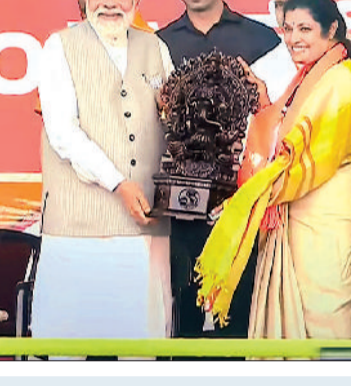
कांग्रेस ने हनेशा आंध्र प्रदेश के गौरव का अपमान किया

पीएम ने एक मध्य रैली को संबोधित किए। पीएम ने कहा कि आपको विकसित भारत के लिए वोट करना है। इसके साथ पीएम ने राज्य की जगन सरकार और कांग्रेस को एक ही थाली के चूट्टे-बट्टे बताया। पीएम ने कहा कि यह आपका ध्यान भटकाने की कोशिश कर रहे हैं। लोकतंत्र का उत्सव आज से प्रारंभ हुआ है। आप से निवेदन है कि लोकतंत्र की हम स्वागत करें। अपने मोबाइल का प्लैश चालू करें और उत्सव का स्वागत करें। ये विशाल जनसागर दिल्ली को भी संदेश देगा और आंध्र के घर-घर को संदेश देगा। एनडीए में हम सबको साथ लेकर चलते हैं, लेकिन कांग्रेस यूज एंड थ्रो कर देती है।