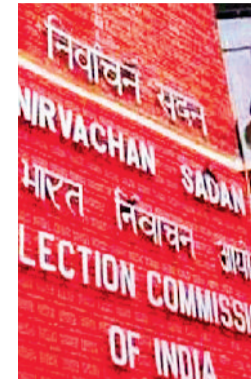
राजिव कुमार CHIEF ELECTION COMMISSIONER

जिनको एक जिले में 3 साल पूरे, वे नए गे न्याय आयोग ने सभी राज्य सरकारों को उन सभी अधिकारियों का ट्रान्सफर करने के आदेश दिए हैं, जो इलेक्शन के काम से जुड़े हुए हैं और एक जिले में तीन साल पूरे कर चुके हैं या अपने गृह जिले में तैनात हैं।