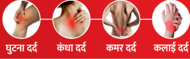
घुटना दर्द कंधा दर्द कमर दर्द कलाई दर्द

जब घुटना, कंधा या कमर दर्द सताए तो आयुर्वेदिक ट्रीटमेंट ही अपनाएं 'डा. ऑर्थो स्ट्रांग तेल' आज ही ले आएं