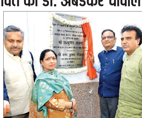
परिया शामिल है। यह बुनियादी ढांचा, समुदाय संगठन और कल्याण को बढ़ावा देने का उद्देश्य रखता है और सरकार के समावेशी विकास और समर्पण का प्रतिबिम्ब है। कार्यक्रम में उपस्थित लोगों ने केजरीवाल सरकार के विकास कार्यों को तर्जिह देने के अपने वादों के लिए आभार व्यक्त किया। उन्होंने डॉ. बी आर अंबेडकर चौपाल जैसी पहल के ट्रॉफ़ों में टिप्पणी