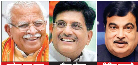
मनोहर लाल खट्टर, पीयूष गोयल, नितिन गडकरी

हिसार, रोहतक, सोनीपत और अंबाला में फंसा है पेंच हरियाणा की चार लोकसभा सीटों पर उम्मीदवारों को लेकर तगड़ा पेंच फंसा हुआ है। भाजपा को हिसार, रोहतक, सोनीपत और अंबाला में उम्मीदवार तय करने के लिए काफी माथापट्टी करनी पड़ रही है। दरअसल इन चारों सीटों पर पिछला चुनाव भाजपा के उम्मीदवार जीते थे लेकिन इस बार मुकाबला आसान नहीं माना जा रहा है। यही वजह है कि पार्टी नेत्रुत्व को टिकट का फैसला लेने में देरी हो रही है। हिसार से भाजपा के सांसद रहे बृजेन्द्र सिंह ने चार दिन पहले ही कांवेस का हाथ धाम लिया है। यहां से पूर्व वित्तमंत्री ▶ शेष पेज 8 पर