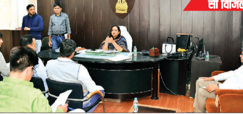
सी विजिल ऐप की दी जानकारी

बूथों पर बिजली, पानी, बाथरूम, रैम्प की सुविधाएं सुनिश्चित करें