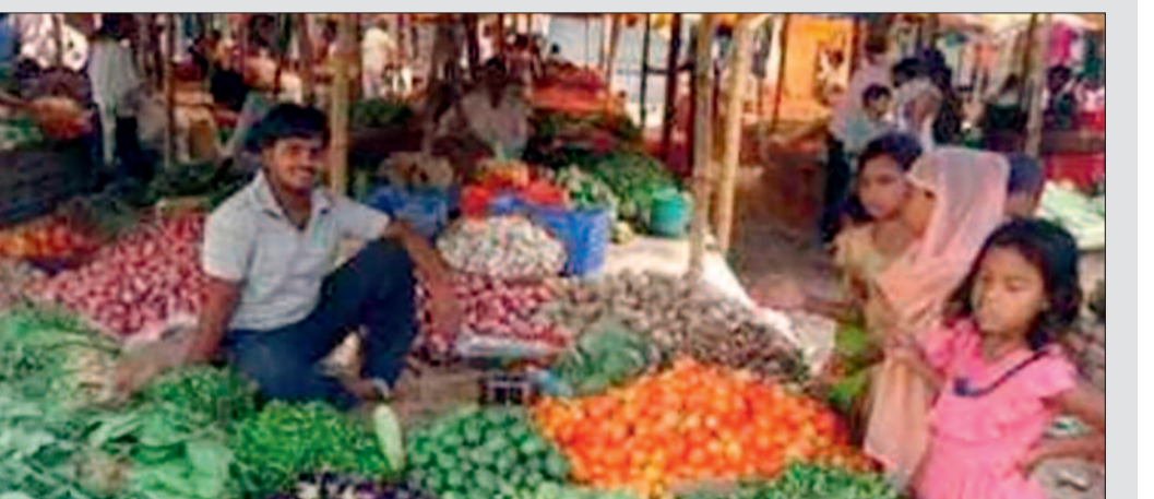
दिल्लीराजहरा सब्जी बाजार में यह है सब्जियों की कीमत नगर के सब्जी बाजार में परवल 70 रुपये प्रति किलोग्राम, शिमला मिर्च 25 रुपये, भिंडी 40 रुपये, गाजर 40 रुपये, पता गोभी 40 रुपये, धनिया पत्ती 100 रुपये, टमाटर 40 रुपये, पालक 40 रुपये प्रति किलोग्राम की दर से बिकने लगा है।

नगर के सब्जी बाजार में हरी सब्जियों के दर काफी बढ़ गए हैं। बीषण गर्मी, तेज तापमान की वजह से हरी सब्जियों की आवक कम हो गई है और दर बढ़ गई है। बढ़ते तापमान से सब्जी की उपज पर असर पड़ता दिख रहा है। इस वजह से हरी सब्जियां महंगी हो गई हैं। तेज धूप में सब्जी की फसलें झुलसकर बर्बाद हो रही हैं। किसान इसे बचाने का प्रयास कर रहे हैं, लेकिन बात नहीं बन रही है। ऐसे में कीमत बढ़ाने के अलावा उनके पास और कोई चारा भी नहीं है।