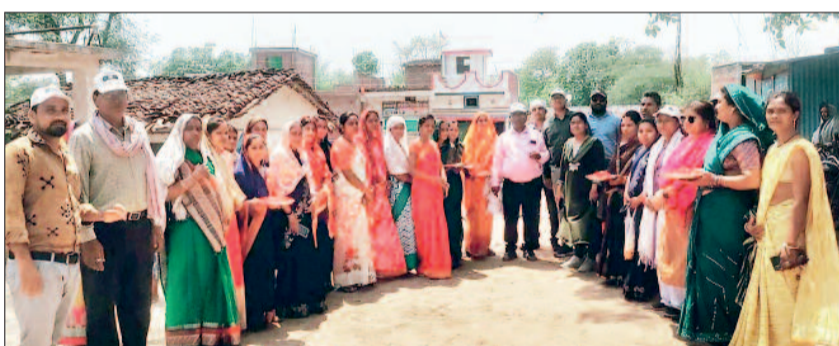
हरिभूमि न्यूज &gt;&gt;&gt; बेमेतरा