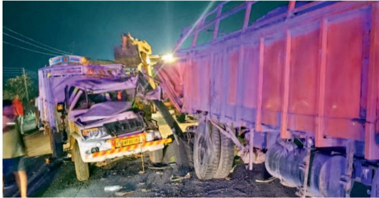
हरिभूमि न्यूज &gt;&gt;&gt; बेमेतरा

बेमेतरा से करीब 20 किमी दूर स्थित ग्राम कठिया-तिरैया के मध्य स्थित पेट्रोल पंप के पास देर रात सड़क किनारे खड़ी एक वाहन से पिकअप की जोरदार भिड़ंत हो गई। हादसे में तीन बच्चों सहित 9 लोगों की मौत हो गई और 23 घायल हो गए, जिन्हें सिमगा एवं बेमेतरा के अस्पताल में भर्ती कराया गया है।