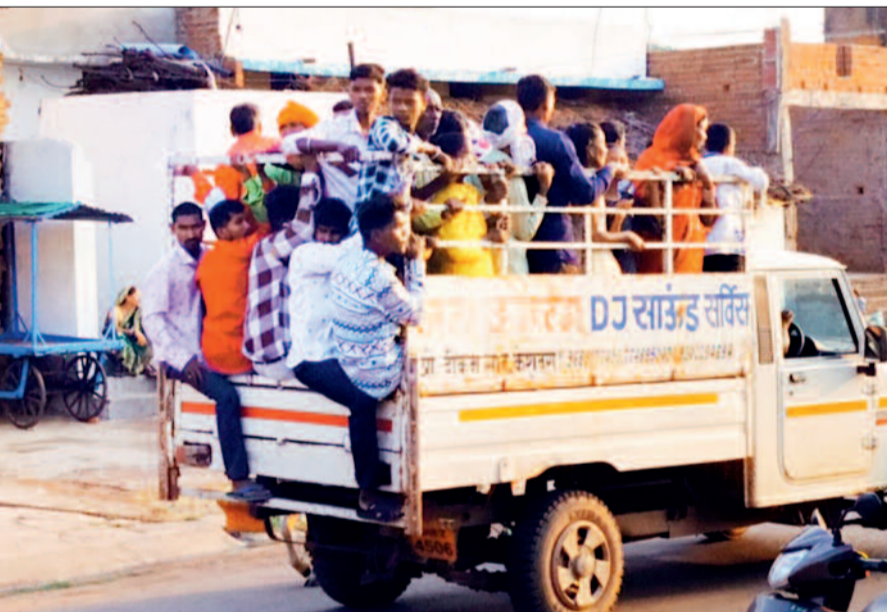
हरिभूमि न्यूज &gt;&gt;&gt; साजा

शहर में मालवाहकों में सवारियों भरकर ढोई जा रही हैं। वहीं, आज ही जिले में हुई बड़ी दुर्घटना में कई लोगों की मौत और दर्जनों