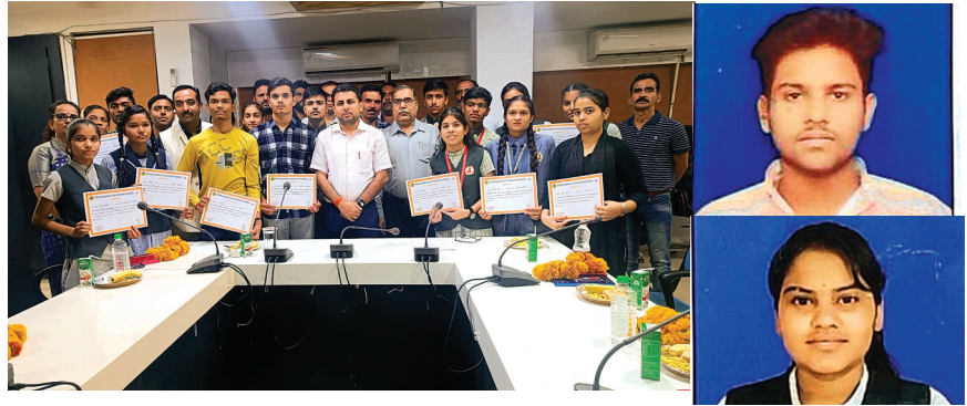
हरिभूमि न्यूज | ब्यावरा-राजगढ़

माध्यमिक शिक्षा मंडल द्वारा गुरुवार को कक्षा दसवीं एवं 12वीं के नतीजे घोषित किए गए हैं। इन नतीजों में कुछ बच्चों ने जहाँ प्रादेशिक मेरिट सूची में स्थान पाया है, वहीं कुछ जिले की