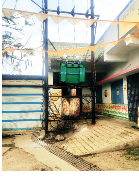
चलने की बात करता है, लेकिन जमीन से सिर्फ एक फुट ऊंचे खुले

शहर में दो दर्जन से अधिक बिजली के ट्रांसफार्मर सड़क किनारे खुले में रखे हैं, जिसे हरदम हादसे की आशंका बनी रहती है। कई बार थाने के सामने रखे ट्रांसफार्मर में आग लगने से वहां हड़कंप मच जाता है। लेकिन इसके बाद भी विभाग के जिम्मेदार अधिकारियों ने ट्रांसफार्मरों को सुरक्षित स्थान पर रखने की सुझ नहीं ली है।