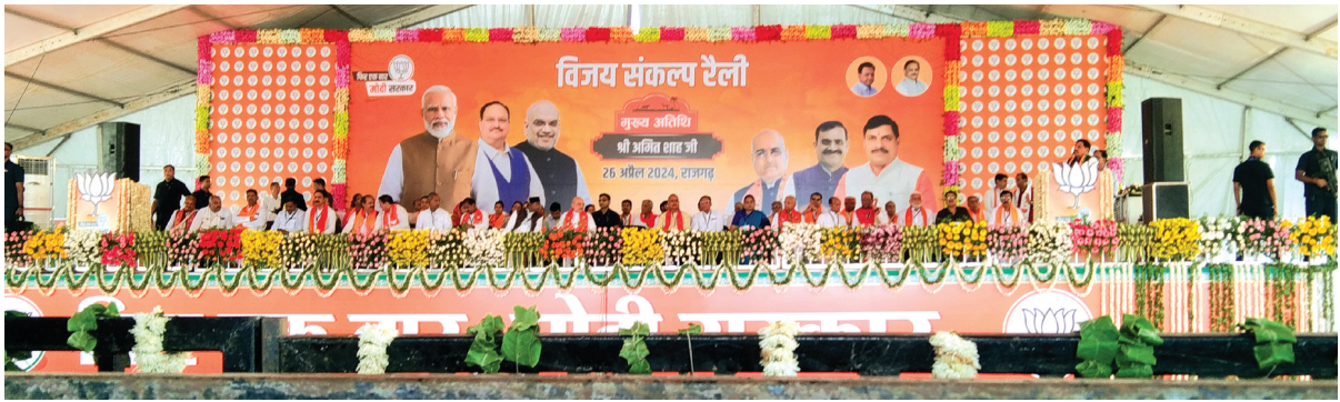
खिलवादीपुर

केंद्रीय गृह एवं सहकारिता मंत्री अमित शाह ने शुक्रवार दोपहर बजे के लगभग हेलीकॉप्टर द्वारा खिलवादीपुर पहुंचकर भाजपा प्रत्याशी के नेतृत्व में स्टेडियम प्रांगण में सभा को संबोधित किया। केंद्रीय मंत्री अमित शाह ने अपने भाषण में पूर्व मुख्यमंत्री तथा वर्तमान कांग्रेस सांसद प्रत्याशी व राहुल गांधी पर निशाना साधा। उन्होंने दिग्विजय सिंह को लेकर कहा कि दिग्विजय सिंह बड़े आदमी हैं, इन्हें इनकी शान के अनुसार बहुत बड़ी लीड से हराइये। आगे बोले की याद रखिएगा