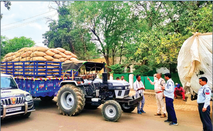
ही ट्रैक्टर ट्रॉली से एक महिला की मृत्यु हो गई थी, किंतु इसके बाद भी ट्रैक्टर चालक वही कार्य कर रहे हैं। ट्रॉलियों के अलावा एक ट्रॉलीय वाहन, जो काफी संख्या में सवारियों को भरकर ले जाते मिला। उक्त पाँचों ट्रैक्टर-ट्रॉलियों और एक लॉडिंग गाड़ी सहित कुल 06 वाहनों पर रजिस्ट्रेशन शॉर्ट ऑफर लोड परिवहन करने पर और भी सख्त कार्यवाही की जावेगी।