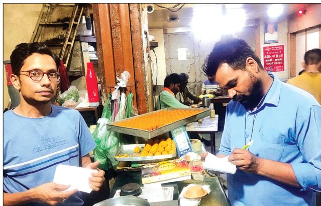
शॉप जयस्तंभ चौराहा से रिफाईंड सोयाबीन तेल, नमकीन, फर्म महाराज डेयरी आसमानी माता मन्दिर के पास, मिष्ठान भण्डार से बूंदी, बेसन के लड्डू, रिफाईंड सोयाबीन तेल एवं बेसन, जैन स्वीट से बूंदी के लड्डू, बेसन, रिफाईंड