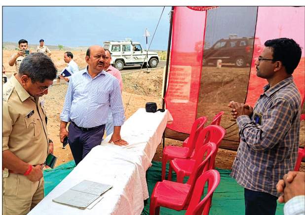
बाउन्डीबॉल की मरम्मत और पुताई के निर्देश दिए गए, इसी प्रकार मतदान केन्द्र के रेंज को सुधारने तथा किचिन सेट एवं पूर्व पंचायत भवन के दरवाजों को तोड़कर फिर से बनवाने तथा पंचायत भवन पर भवन का नाम बड़े अक्षरों नाम पेंट कराने के निर्देश दिये। ग्राम पंचायत

व्यवस्थाओं का जायजा लिया तथा संबंधित अधिकारियों को आवश्यक दिशा निर्देश दिए। इस दौरान उन्होंने 121-शास.मा.वि. उमरथाना, 168 शा.प्रा.वि. पीपल्यामोती, 171-शा.प्रा.वि. जूनापानी मतदान केन्द्रों का निरीक्षण किया, साथ ही राजस्थान सीमा के चैक पोस्ट उमरथाना एवं सेमलीभोज का भी निरीक्षण किया। कलेक्टर द्वारा राजस्थान के चैक पोस्ट महाराजपुर एवं मतदान केन्द्र राजकीय विद्यालय महाराजपुरा का भी निरीक्षण किया एवं मतदान दिवस के दिन की व्यवस्थाएं देखीं। कलेक्टर डॉ. सिंह द्वारा निरीक्षण के दौरान उमरथाना स्कूल, आंगनबाड़ी एवं पंचायत भवन परिसर की