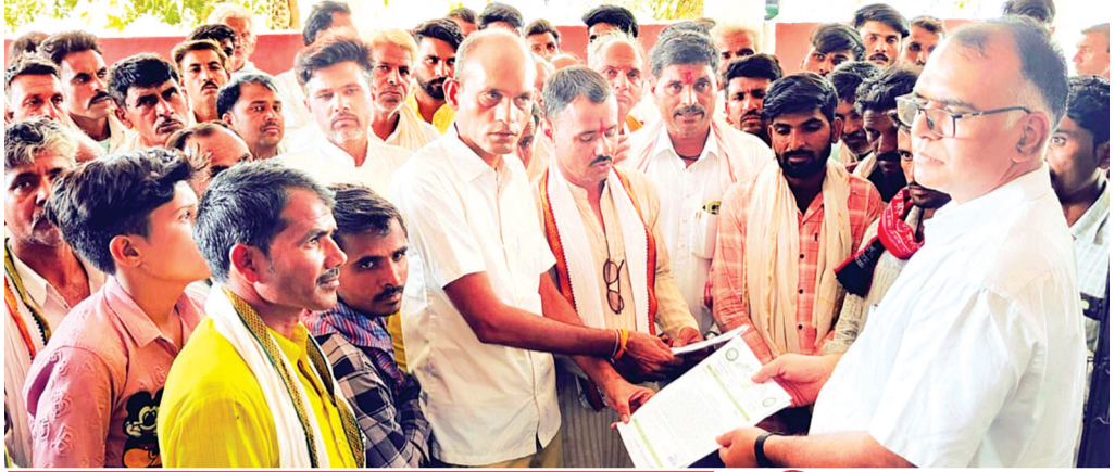
पेयजल के साथ ही नहरों का पानी भी गांवों तक नहीं पहुंच पा रहा

क्षेत्र में भीषण गर्मी का दौर जारी है। इस तेज गर्मी के बीच खिलचीपुर क्षेत्र की चार पंचायतों के 15 विभिन्न ग्रामों के ग्रामीणों को पेयजल के लिए खासी परेशानी का सामना करना पड़ रहा है। जल निगम की हर घर नल से जल पहुंचाने वाली जल जीवन मिशन योजना की पाइप लाइनें तो गांवों में डल चुकी हैं, लेकिन उन्हें चालू नहीं करवाया जा रहा है। इसके साथ ही सिंचाई के पानी के लिए भी ग्रामीण परेशान हैं। उक्त दोनों समस्याओं को लेकर किसान युनियन के बैनरतले सभी चारों ग्राम पंचायतों के ग्रामीण सोमवार को कलेक्टर पहुंचे। सभी ने प्रशासन के नाम एक ज्ञापन सौंपा। ज्ञापन में उल्लेख है कि यदि पेयजल की समस्या का निराकरण जल्द नहीं करवाया गया तो ग्रामीणजन लोकसभा चुनावों का बहिष्कार करने को मजबूर होंगे।