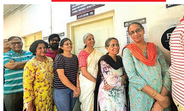
केंद्रीय वित्त मंत्री निर्मला सीतारमण ने बेंगलुरु के जयनगर मतदान केंद्र पर मतदान किया। सीतारमण के साथ उनके पिता ने भी वोट डाला।