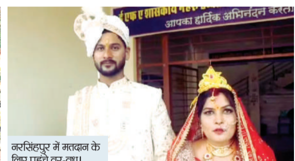
नरसिंहपुर में मतदान के लिए पहुंचे वर-वधू।

सबसे कम मतदान रीवा संसदीय क्षेत्र में महज 48.67 फीसदी ही हुआ