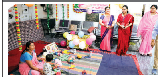
रीवा। जिले के पुलिस महानिरीक्षक कार्यालय स्थित मतदान केंद्र पर महिला मतदाताओं के साथ आने वाले बच्चों के लिए विशेष व्यवस्थाएं की गई थीं।

ऐसा भी मतदान केंद्र... बच्चों के लिए विशेष इंतजाम