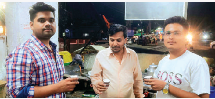
अभियान ने जोर पकड़ लिया है, लेकिन इस बार आम लोगों को चाहिए कि मतदाता