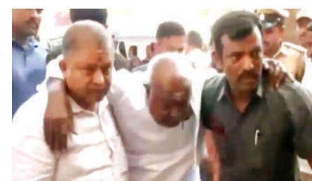
पूर्व पीएम और जनता दल (एस) के प्रमुख एचडी देवेगौडा ने कर्नाटक की हसन लोकसभा सीट से मतदान किया।