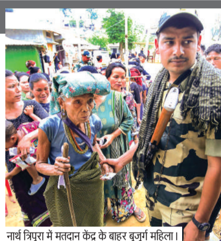
नार्थ त्रिपुरा में मतदान केंद्र के बाहर बुजुर्ग महिला।

सभी लोकसभा क्षेत्रों में मतदान पूरी तरह से शांतिपूर्ण रहा। कहीं से कोई विवाद आदि की खबर नहीं मिली। कुछ इलाकों में जरूर ईवीएम संबंधी शिकायत आई थी, किंतु उन्हें फौरन ही सुधार करा लिया गया। जहां पर ईवीएम व वीवीपेट संबंधी दिक्कत आई, वहां पर तत्काल बदलाव मतदान शुरू कराया गया। मतदान के दौरान काफी सर्खा रही। शेष पेज 06 भी