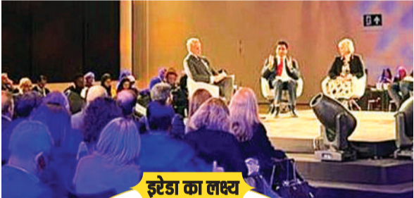
इरेडा का लक्ष्य

सीएमडी ने हरित अर्थव्यवस्था के प्रति इरेडा की निरंतर प्रतिबद्धता को पुष्टि की। कंपनी निवेश करना, तकनीकी प्रगति को बढ़ावा देना और सुधारों की वकालत करना जारी रखे हुए है। जैसे-जैसे भारत 2070 तक नेट जीरो उत्सर्जन हासिल करने आगे बढ़ रहा है। इरेडा स्थायी और सुरक्षित ऊर्जा मतिष्य की दिशा में मार्गदर्शन करते हुए आगे बरकरार है।