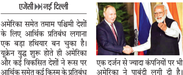
एजेसी ► नई दिल्ली

अमेरिका समेत तमाम पश्चिमी देशों के लिए आर्थिक प्रतिबंध लगाना एक बड़ा हथियार बन चुका है। यूक्रेन युद्ध शुरू होते ही अमेरिका और कई विकसित देशों ने रूस पर आर्थिक समेत कई किसिम के प्रतिबंध लगाए थे। ईरान-इजराइल के बीच तनाव की वजह से भी अमेरिका ने ईरान पर बैन लगाए। ईरान से दोस्ती करने और व्यापार समझौते करने पर पाक को इसी तरह की पाबंदी की धमकी दी गई। ईरान से डील करने पर भारत की तीन कंपनियों समेत