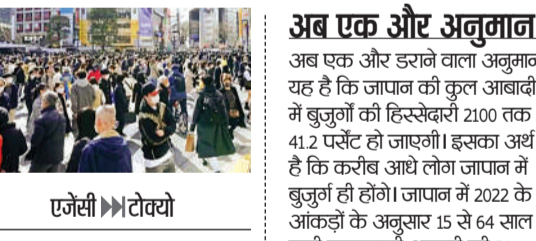
एजेसी ► टोक्यो

जापान की आबादी 2008 में 128 मिलियन यानी 12.8 करोड़ थी। जो 2022 में घटकर 125 मिलियन यानी 12.5 करोड़ ही रह गई। अनुमान है यदि आबादी घटने की यही रफ्तार रही तो 2100 तक जनसंख्या 63 मिलियन ही रह जाएगी।