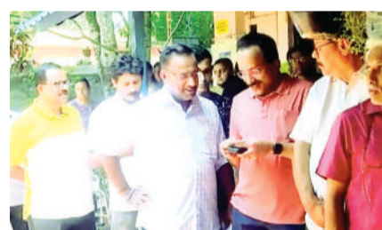
इसरो प्रमुख एस. सोमनाथ ने केरल के तिरुवनंतपुरम में मतदान किया। वह लोगों से बातचीत करते नजर आए।

दूसरे चरण में कुल 1.67 लाख पोलिंग स्टेशन पर 15.88 करोड़ मतदाता, इनमें से 8.08 करोड़ पुरुष 7.8 करोड़ महिलाएं और 5929 थर्ड जेंडर वोटर