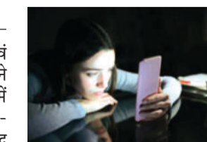
बचाव के उपायों पर जोर

संयुक्त राष्ट्र शैक्षिक, वैज्ञानिक एवं सांस्कृतिक संगठन (यूनेस्को) ने रिपोर्ट जारी की गई है। इसमें डिजिटल टेक्नोलॉजी से पढ़ाई-लिखाई और सीखने-सिखाने में मदद तो मिली है, मगर सोशल मीडिया से लैंगिक रूढ़ियों व दकियानूसी सोच को भी बढ़ावा मिल रहा है और लड़कियों के मानसिक स्वास्थ्य व कल्याण पर नकारात्मक असर हो रहा है। 'प्रायोगिकी अपनी शर्तों पर' नाम की यह रिपोर्ट यूनेस्को ने 25 अप्रैल को प्रकाशित की।