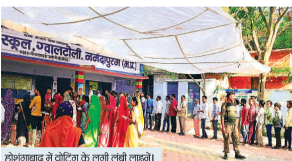
होशंगाबाद में वोटिंग के लगी लंबी लाइनें।

सबसे अधिक होशंगाबाद संसदीय क्षेत्र में करीब 67 प्रतिशत वोटिंग हुई