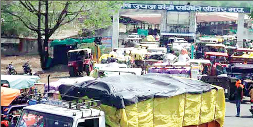
क्विंटल से अधिक आवक हो रही है। इसका प्रमुख कारण यह है कि समर्थन केन्द्र से मंडी में गेहूं के भाव अधिक हैं तो भुगतान भी

जानकारी के अनुसार जिले में 20 मार्च से 231 उपार्जन केन्द्रों पर गेहूं की खरीदी लगातार जारी है। यहाँ 4 लाख 54 हजार टन गेहूं की खरीदी हुई है। सीहोर व आधा कृषि उपज मंडी में 4 लाख 62 हजार टन गेहूं खरीदा जा चुका है। जहाँ उपार्जन केन्द्रों पर सन्नाटा पसरा हुआ है तो वहीं मंडियों में अब भी 10 हजार