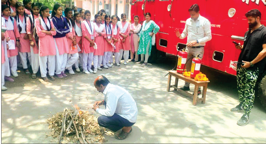
लकड़ी, कागज, कचरे आदि से उत्पन्न आग को कहते हैं इसे बुझाने के लिये पानी, मिट्टी और रेत आदि का उपयोग करते हैं। बी क्लास फायर पेट्रोल, डीजल,

आदि मानव ने अपने विकास के प्रारंभ में जब जंगल की आग को देखा होगा तो निश्चित ही अन्य प्राणियों की तरह वे भी भयभीत हुए होंगे। लेकिन कल्पना कीजिए कि जब मनुष्य ने आग पर नियंत्रण प्राप्त किया होगा तो उसकी खुशी का ठिकाना नहीं रहा होगा। अपने प्रकृति नियंत्रण अभियान में आग पर नियंत्रण मानव इतिहास की सर्वकालिक महान घटना है। तब से लेकर आज तक अग्नि पर नियंत्रण के लिए लगातार नई टेक्नॉलाजी का उपयोग हो रहा है। वर्तमान में अग्नि शमन दस्ते को फायर ब्रिगेड कहा जाता है। फायर ब्रिगेड का अर्थ केवल लाल रंग की गाड़ी नहीं बल्कि पूरे दल को फायर ब्रिगेड कहा जाता है। गाड़ी को फायर टेंडर कहा जाता है। ये कई प्रकार के होते हैं। इसमें बड़ी गाड़ी से लेकर मोटर साइकिल तक होती है। अत्यंत संकरी गलियों में जहां फोर व्हीलर या अन्य बड़ी गाड़ियां नहीं जा सकती वहां बाइक का उपयोग किया जाता है। आग लगभग पांच प्रकार की होती है। ए क्लास फायर