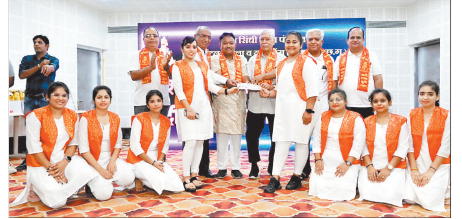
हरिभूमि न्यूज || बिलासपुर

सिंधी सेंट्रल पंचायत युवा विंग, महिला विंग तथा 15 सिंधी वार्ड पंचायतों द्वारा रविवार को झुल्लाल मंगलम तिरफा में चेटीचंडू पुरस्कार वितरण कार्यक्रम का आयोजन किया गया। सिंधी समाज के इष्ट देव झुल्लाल के रूप में प्रतिवर्ष मनाया जाता है। इस वर्ष भी महोत्सव में झांकी निकली, फैसी ड्रेस व अन्य कार्यक्रम पर पुरस्कार वितरण किया गया। इसमें समाज को अच्छा संदेश देती हुई झांकियां प्रस्तुत, की गई जिसमें इस वर्ष भी शांतिवादा में सभी