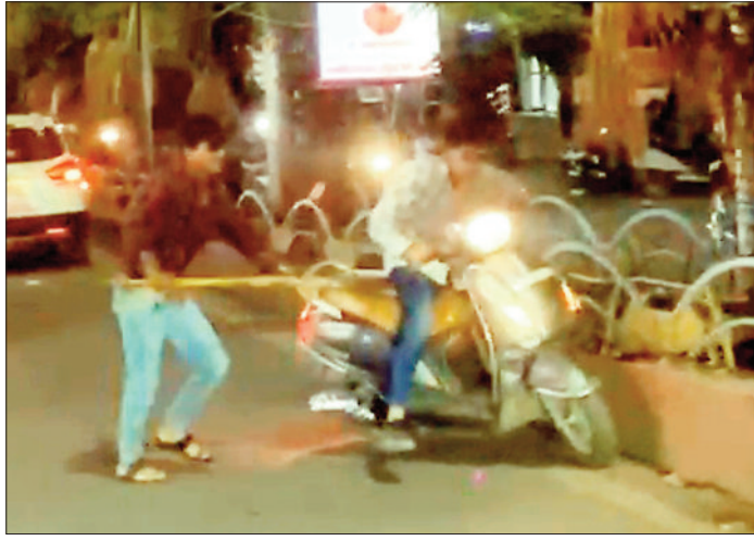
श्रीकांत वर्मा मार्ग पर पटवारी के बेटे को पीटा युवक।