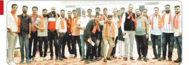
प्रतियोगिता के समस्त पुरस्कारों को मिलाकर लगभग 90-100 लोगों को पुरस्कृत किया गया। कार्यक्रम को शुरुआत झुल्लाल साई की मूर्ति पर दीप प्रज्वलन करके की गई, उसके पश्चात सांस्कृतिक कार्यक्रम भी समाज के सदस्यों द्वारा प्रस्तुत किए गए।

चेटीचंडू इस वर्ष 10 अप्रैल को था। इस दिन सिंधी भाषा दिवस भी मनाया जाता है। इसी थीम को लेकर बच्चों, महिलाओं तथा बच्चुओं ने सिंधी भाषा दिवस तथा चेटीचंडू को बधाइयां देते हुए समाज को प्रेरित करने हेतु अच्छे-अच्छे विषयों पर सामाजिक संदेशों से भरपूर वीडियो बनाए थे। सिंधी डांडिया प्रतियोगिता, बच्चों फैसी ड्रेस तथा इंटर्ग्राम वीडियो