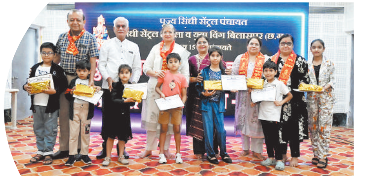
15 सिंधी पंचायतों द्वारा चेटीचंडू पुरस्कार वितरण कार्यक्रम का आयोजन

Email id- haribhoomibsp@gmail.com Whats App - 6263190692, 8305922255