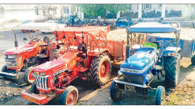
अवैध परिवहन में लगे जब्त वाहन।