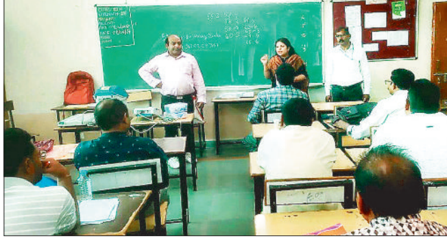
मतदान दलों को जानकारी देते अधिकारी।

लोकसभा निर्वाचन के तहत सोमवार को विधानसभा क्षेत्र 33 अकलतरा के लिए जय भारत स्कूल जांजगीर एवं केन्द्रीय विद्यालय जांजगीर में आयोजित मतदान दलों के तृतीय चरण प्रशिक्षण कार्यक्रम में जिला स्तरीय अधिकारियों ने मतदान दलों के अधिकारियों-कर्मचारियों को अच्छे ढंग से सुचारु मतदान करवाने के लिए प्रोत्साहित किया। अधिकारियों ने कहा कि सभी ने मतदान की पूरी ट्रेनिंग ली है सब आत्मविश्वास से भरपूर हैं। अब सभी मिलकर शांतिपूर्ण ढंग से निर्विघ्न और निष्पक्ष मतदान सम्पन्न करवाएंगे। मतदान दलों में शामिल अधिकारी-कर्मचारियों से रूबरू होकर कहा कि पोलिंग ड्यूटी के अनुरूप स्ट्रांग रूम में निर्धारित दिवस एवं समय पर उपस्थित