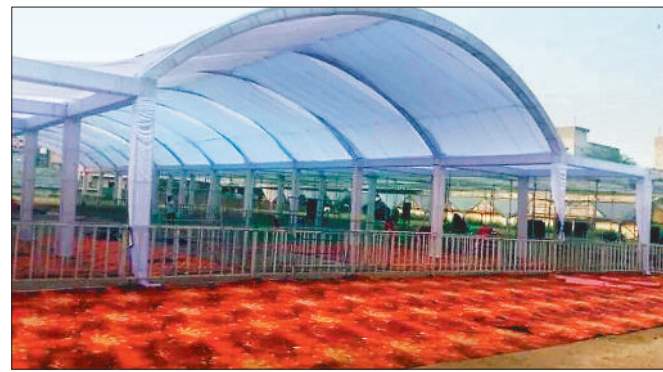
चांपा में कांग्रेस के राष्ट्रीय अध्यक्ष मल्लिकार्जुन खड़गे की सभा के लिए तैयार पंडाल।

लोकसभा चुनाव के तीसरे चरण में 7 मई को मतदान होना है। ऐसे में प्रचार प्रसार के लिए बमुश्किल सप्ताह भर का समय शेष रह गया है। इसको लेकर भाजपा और कांग्रेस प्रमुख दलों ने अपनी पूरी ताकत झोंक दी है। बड़े नेताओं के कार्यक्रम को लेकर आसमान पर रोज उड़नखटोले की गड़गड़ाहट सुनाई पड़ती है तो वहीं प्रत्याशी और स्थानीय नेता गांव गलियों की खाक छानते फिर रहे हैं।