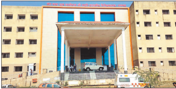
वित्तीय मामलों की प्रक्रिया अटकी

सूत्र बता रहे हैं कि लैब के इक्व्यूमेंट की खरीदों के लिए नियमों में बदलाव हुआ है। जिसकी वजह से कुछ वित्तीय मामलों की वजह से खरीदी अब तक नहीं हो पाई है। हालांकि मेडिकल कॉलेज की ओर से इक्व्यूमेंट की कमी होने और आवश्यक इक्व्यूमेंट की सूची भेज दी गई है।