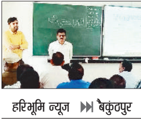
हरिभूमि न्यूज | बकुटपुर