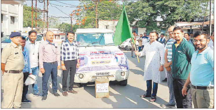
मतदान दलों को रवाना करते कलेक्टर।