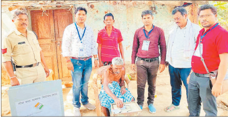
मतदान करता बुजुर्ग।