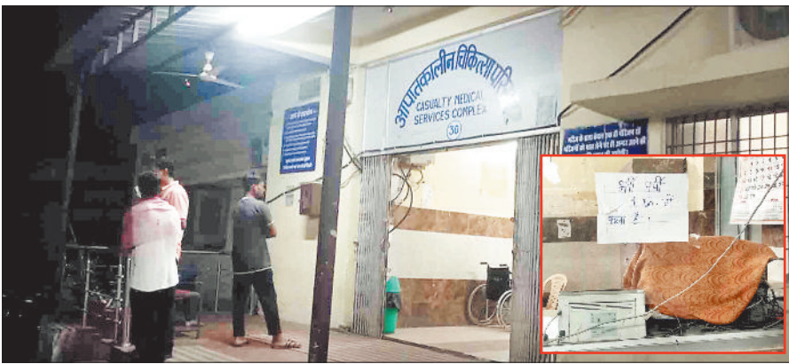
मेडिकल कॉलेज अस्पताल का आपातकालीन केंद्र का बंद पची काउंटर।

मेडिकल कॉलेज अस्पताल में किसी प्रकार की परेशानी न हो इसे ध्यान में रखकर अस्पताल के सभी विभाग में आवश्यक जांच उपकरण सहित अन्य संसाधन उपलब्ध कराई गई है