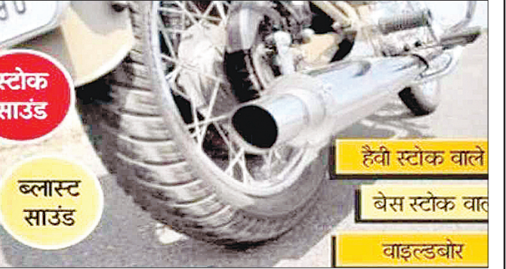
हैवी स्टोक वाले वेस स्टोक वाले वाइल्डबोर

आवाज कानों तक पहुंचे तो व्यक्ति बहरा भी हो सकता है, मगर पता नहीं शासन प्रशासन द्वारा इस ओर क्यों ध्यान नहीं दिया जा रहा है जिसके चलते आम लोगों की जिन्दगी पूर्ण रूप से खतरे में नजर आ रही है। नये फैसन की बुलेट गाड़ी के आवाज से लोगों का सोना हो रहा दुभर- पूर्व में सड़को पर दौड़ने वाली बुलट बाइक में अचानक कमी आने के बाद फिर युवाओं में बुलट चलाने का जो शौक पैदा हुआ है वह आम लोगों के लिये परेशानी का कारण बनने से नहीं चूक पा रहा है। युवाओं में बुलट बाइक के प्रति बढ़ रहे शौक के चलते नगर सहित ग्रामीण क्षेत्रों में भी बुलट गाड़ियों की संख्या में लगातार बढ़ोत्तरी होते हुये देखी जा रही है जिसके सायलेंसर से निकलने वाली आवाज ही इतनी तेज होती है कि उसको सुन पाना मुश्किल हो जाता था, मगर अब नये फैसल की बुलेट में जिस प्रकार से युवाओं द्वारा अलग प्रकार की आवाज सट कराई जा रही है वह चलते चलते अचानक बम की तरह निकलने से नहीं चूकती है इस आवाज के चलते जब देर रात नगर की गलियों में बुलट बाइक दौड़ते हुये इस प्रकार से आवाज निकालती है तो लोग अपने घरों में नींद तक नहीं ले पा रहे है क्योंकि बम के समान यह आवाज इतनी तेज होती है कि सो रहे किसी भी व्यक्ति को नींद गायब हो सकती है? इस प्रकार से नगर व शहरों में लगातार बुलेट बाइकों की बढ़ोत्तरी आम लोगों के लिये सिर दर्द बनने से नहीं चूक पा रही है? जिसके चलते आमजन द्वारा प्रशासन से युवाओं द्वारा अपनी बुलेट बाइकों में बमनुमा आवाज निकालने वाले यंत्र लगाए जाने पर रोक लगाना चाहिये।