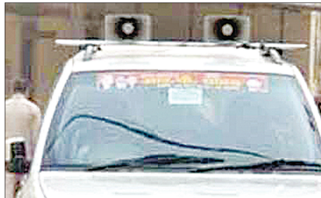
स्टोक साउंड ब्लास्ट साउंड

गाड़िया आये दिन पुलिस थाने के सामने से गुजरती रहती है जिन्हें पुलिस प्रशासन खुलेआम नजर में रखा करता रहता है? दुर्घटना की आशंका- इस प्रकार से नियम विरुद्ध वाहनों में लगे हुए सायरन हट्टर तथा प्रेशर हार्नों से सबसे ज्यादा परेशानी तब होती है जब आगे चल रहे वाहन चालक को पीछे से या सामने से सायरन हट्टर प्रेशर हार्न सुनाई देता है, खासतौर से जब उसके बगल से प्रेशर हार्न बजाता वाहन सट कर निकलता है, इस स्थिति में तो अक्सर वाहन दुर्घटनाग्रस्त हो जाता है, कई बार ऐसी दुर्घटना से जान तक चली जाती है। शौक बन गया प्रेशर हार्न बजाना-इन दिनों गौर किया जावे तो सायरन हट्टर का उपयोग जहां नियम विरुद्ध नेताओं द्वारा अपने वाहनों में किया जा रहा है वही प्रेशर हार्न का सर्वाधिक उपयोग युवा बाईक चालकों द्वारा किया जाता है, जो नगर में ऐसे हार्न की आवाज हमेशा सुनी जा सकती है। ऐसे बाईक चालक प्रेशर हार्न की कर्कश आवाज बजाते हुए चालक इस तरह निकलते है, मानों किसी दौड़ प्रतियोगिता में भाग ले रहे है। इस बात को इस तरह भी कहा जा सकता है कि बाईक या अन्य वाहनों में प्रेशर हार्न का उपयोग करना शौक भी बन गया है और इन शौकीनों को सड़क दुर्घटना का कोई खौफ नहीं है। इतना ही नहीं यदि इन हार्नों की सच्चाई पर गौर किया जावे तो इस तरह के हार्न के चलने के संबंध में चिकित्सकों का कहना है कि इनकी कर्कश ध्वनि से हृदय गति बढ़ने का खतरा भी है, इनके उपयोग पर सख्ती से प्रतिबंध लगाया जाना जरूरी है। बताया कि कान में आवाज सुनने की एक क्षमता होती है, यदि उक्त क्षमता से तेज गति की