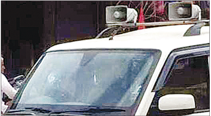
हरिभूमि न्यूज़/ गाड़वारा।

गाड़िया आये दिन पुलिस थाने के सामने से गुजरती रहती है जिन्हें पुलिस प्रशासन खुलेआम नजर में रखा करता रहता है? दुर्घटना की आशंका- इस प्रकार से नियम विरुद्ध वाहनों में लगे हुए सायरन हट्टर तथा प्रेशर हार्नों से सबसे ज्यादा परेशानी तब होती है जब आगे चल रहे वाहन चालक को पीछे से या सामने से सायरन हट्टर प्रेशर हार्न सुनाई देता है, खासतौर से जब उसके बगल से प्रेशर हार्न बजाता वाहन सट कर निकलता है, इस स्थिति में तो अक्सर वाहन दुर्घटनाग्रस्त हो जाता है, कई बार ऐसी दुर्घटना से जान तक चली जाती है। शौक बन गया प्रेशर हार्न बजाना-इन दिनों गौर किया जावे तो सायरन हट्टर का उपयोग जहां नियम विरुद्ध नेताओं द्वारा अपने वाहनों में किया जा रहा है वही प्रेशर हार्न का सर्वाधिक उपयोग युवा बाईक चालकों द्वारा किया जाता है, जो नगर में ऐसे हार्न की आवाज हमेशा सुनी जा सकती है। ऐसे बाईक चालक प्रेशर हार्न की कर्कश आवाज बजाते हुए चालक इस तरह निकलते है, मानों किसी दौड़ प्रतियोगिता में भाग ले रहे है। इस बात को इस तरह भी कहा जा सकता है कि बाईक या अन्य वाहनों में प्रेशर हार्न का उपयोग करना शौक भी बन गया है और इन शौकीनों को सड़क दुर्घटना का कोई खौफ नहीं है। इतना ही नहीं यदि इन हार्नों की सच्चाई पर गौर किया जावे तो इस तरह के हार्न के चलने के संबंध में चिकित्सकों का कहना है कि इनकी कर्कश ध्वनि से हृदय गति बढ़ने का खतरा भी है, इनके उपयोग पर सख्ती से प्रतिबंध लगाया जाना जरूरी है। बताया कि कान में आवाज सुनने की एक क्षमता होती है, यदि उक्त क्षमता से तेज गति की