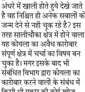
चलते घरों की गृहणियाँ खाना तैयार करने के लिए जलाऊ लकड़ी पर निर्भर रहती है या फिर उन्हें स्टोव का सहारा लेना पड़ता है। किंतु अजीब बात है कि इन दिनों शहर में जलाऊ लकड़ी काफी महंगा बिक रही है, टालो में जलाऊ लकड़ी खरीदने पर उसकी कीमत सुन गरीबों के होश उड़ रहे है। इन गरीबों का कहना है कि

शहर में जलाऊ लकड़ी का गहराया संकट, कैरोसिन का वितरण बंद होने से दो वक्त का भोजन बनाना हो रहा मुश्किल हरिभूमि न्यूज़/ गाड़वारा। म.प्र.शासन की जनकल्याणकारी योजनाओं से जहां शहर के गरीबों में जो आशा की किरण झलकी थी मगर उसका झिलमिल रोशनी को लगता है कि चिर रहे गर्मी के मौसम ग्रहण लगने से नहीं चूक पा रहा है? हालत यह है कि गरीबों को जरूरत के हिसाब से सहकारी दुकानों से सस्ती दर पर गेहूँ, चाँवल, नमक तो ठीक समय पर आर्विटित किये जा रहे है। मगर शक्कर की मिठास शासन की योजना के तहत कभी काल ही दर्शन देती है...? वही दूसरी ओर देखा जा रहा है कि इस समय जलाऊ लकड़ी, कैरोसिन का संकट गहराने से गरीबों को घरों में दो वक्त चूल्हा जलाना मुश्किल हो रहा है। नगर के अनेक वार्डों के गरीबों ने बताया कि उनके घरों में रसोई गैस की व्यवस्था तो सरकार की उजबला योजना के तहत हो गई है। मगर इस महगाई के दौर में जहां गैस भरवाना आसान नहीं रहे गया है इस स्थिति में लकड़ी ही उनका सहारा बनती थी जिसके