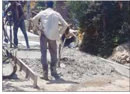
हरिभूमि न्यूज/सिंहपुर छोटा।

सरकार द्वारा ग्रामीणजनों को सुविधा पहुंचाने तथा शहरों से जोड़ने की सोच रखते हुये सड़कों के निर्माण को लेकर हर वर्ष करोड़ों रूपया खर्च किये जाते है। मगर जब उन सड़कों का निर्माण कार्य होता है तो अधिकारियों की मिली भगत के चलते उन सड़कों निर्माण कार्यों की गुणवत्ता को इस तह नजर अंदाज कर दिया जाता है कि करोड़ों रूपया की लागत से बनी हुई यह सड़के अपना पहला जन्म दिन भी सही रूप से नही मना पाती है। कुछ इसी प्रकार की सच्चाई इस समय ग्राम बगलई से सिंहपुर छोटा होते हुये इकलोनी तक एक साल पहले बनाई जा रही सीमेन्ट सड़क में दिखाई दे रहा है? बताया जाता है कि ग्राम सिंहपुर छोटा के लोगों को सीधे ग्राम बगलई से जोड़ने व इकलोनी के लिये आने जाने के लिये सरकार द्वारा लाखों रूपया की राशि स्वीकृत की गई थी। इस तरह सरकारी राशि