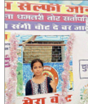
लोकसभा चुनाव में वोट डालने युवाओं में रहा जोश।