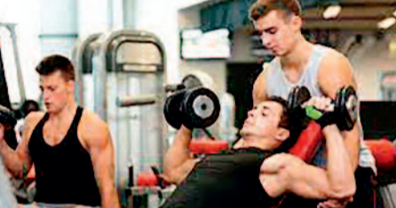
एक मिथक हो सकता है।