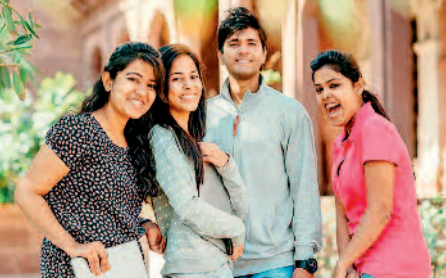
एक मिथक हो सकता है।