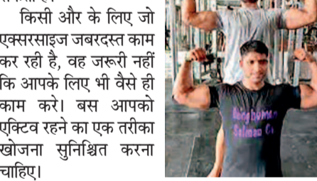
एक मिथक हो सकता है।

एक्सरसाइज का मामला बहुत ही पर्सनल है और एक्सरसाइज की एक तय मात्रा सभी के लिए एकसमान रूप से कार्य नहीं करती है। इसी तरह एक एक्सरसाइज भी सभी के लिए उपयुक्त नहीं है और इसीलिए आपको एक्सरसाइज के प्रकारों के बारे में सावधान रहना चाहिए, और साथ ही एक्सरसाइज की ड्यूरेशन के बारे में भी, जिसे आप अपने लिए चुनते हैं। एक हफ्ते में एक निश्चित मात्रा में एक्सरसाइज अच्छी है (जैसा कि दूसरे पाइंट में बताया गया है), पर इसकी इंटींसिटी और फ्रीक्वेंसी प्रत्येक व्यक्ति के हिसाब से अलग अलग हो सकती है। किसी और के लिए जो एक्सरसाइज जबरदस्त काम कर रही है, वह जरूरी नहीं कि आपके लिए भी वैसे ही काम करे। बस आपको एक्टिव रहने का एक तरीका खोजना सुनिश्चित करना चाहिए।