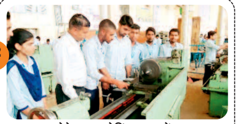
वोकेशनल ट्रेनिंग युवाओं...