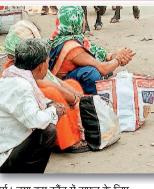
दुर्ग। नया बस स्टैंड में सफर के लिए जद्दीजहद करते यात्री।