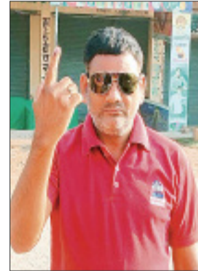
हरिभूमि न्यूज | कोलेगांव

विकासखंड पंडरिया अंतर्गत ग्राम कोलेगांव में सुबह से ही