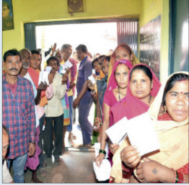
महिलाओं व युवाओं में उत्साह

जिले कि कवर्धा तथा पंडरिया विधानसभा में शुक्रवार को लोक सभा के द्वितीय चरण के तहत हुआ मतदान शांतिपूर्ण ढंग से निपट गया। निर्वाचन आयोग द्वारा मतदान के लिए निर्धारित प्रातः 7 बजे से शाम 6 बजे तक तगड़ी सुरक्षा व्यवस्था के बीच बिना किसी व्यवधान के मतदान प्रक्रिया जारी रही। कहीं से कोई अप्रिय घटना की खबर नहीं मिली है। देरशाम निकलकर आए आंकड़ों के मुताबिक जिले की कवर्धा तथा पंडरिया विधानसभा में 73 प्रतिशत से अधिक मतदान होने की संभावना जताई जा रही है। मतदान को लेकर समूचे अंचल में सुबह से ही खासा माहौल देखा गया। लोगों की उत्सुकता का अंदाजा इसी से लगाया जा सकता है कि सुबह से ही दोनों ही विधानसभाओं के ग्रामीण तथा शहरी क्षेत्र के मतदान केन्द्रों में मतदाताओं की भीड़ जुटना शुरू हो गई थी। मतदान प्रक्रिया प्रारंभ होते ही जहाँ धीमी गति से कामकाजी लोगों ने मतदान केन्द्रों में पहुंचकर अपने मताधिकार का प्रयोग किया वहीं 11.00 बजे के बाद चौका चूल्हा से निवृत्त होकर महिलाओं, युवाओं सहित अन्य वर्गों के मतदाताओं की भीड़ भी मतदान केन्द्रों में उमड़ने लगी। दोपहर होते-होते प्रायः सभी मतदान केन्द्रों में मतदाताओं की लम्बी कतारे देखी गई। लोकतंत्र के इस महायज्ञ में मतों की आहूति