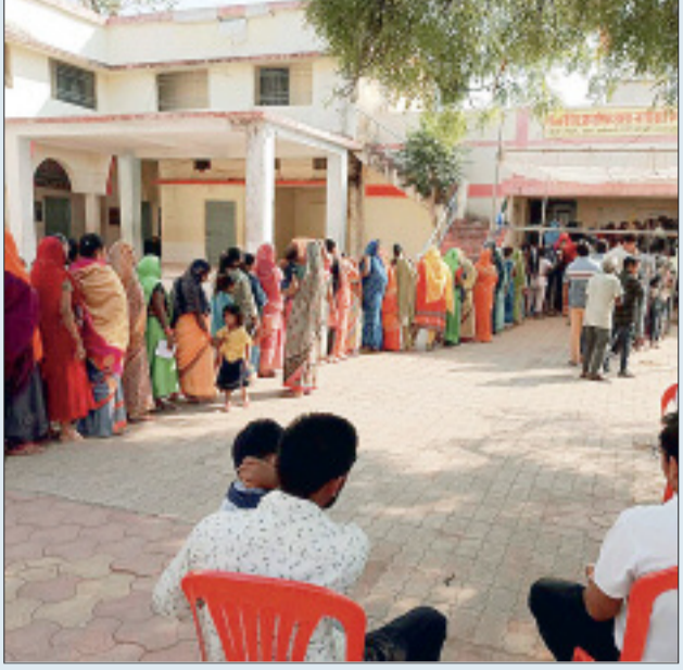
शांतिपूर्ण ढंग से निपटा मतदान

मतदान को लेकर महिलाओं और युवाओं में खासा उत्साह देखा गया। पुष्पा दौर पर तो नही पर छनकर आ रही खबर के मुताबिक जिले की दोनों ही विधानसभाओं में पुरुषों की अपेक्षा महिला मतदाताओं ने मतदान में बढ़चढ़कर हिस्सा लिया। यहां बताया जा रहा है कि कवर्धा विधानसभा में पुरुषों की अपेक्षा महिला मतदाताओं की संख्या अधिक है, एक वजह यह भी कि मतदान केन्द्रों में महिला मतदाताओं की संख्या अधिक दिखाई दी।