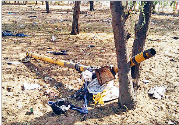
महेंद्रगढ़। राव तुलाराम चौक पर ट्रैफिक लाइट टूटकर पड़ा पोल।

शहर के राव तुलाराम चौक व माजरा चुंगी पर ट्रैफिक लाइट काफी वर्षों से खराब पड़ी है, जिससे चौक पर यातायात अव्यवस्थित रहता है और वाहन चालकों को परेशानियों का सामना करना पड़ता है। यहाँ से रोजाना हजारों वाहनों का आवागमन होता है। वाहन चालकों में एक-दूसरे से पहले चौक पार करने की होड़ लगी रहती है। इसलिए जल्दबाजी में कई बार वाहन चालक सामने के वाहनों से टकरा जाते हैं और हादसे का शिकार हो जाते हैं। इसके अलावा कई बार चौक पार जाम की स्थिति बन जाती है। शहर के लोगों ने प्रशासन से लाइटों को ठीक कराने की मांग की है। बता दें कि शहर में ट्रैफिक व्यवस्था को नियंत्रित करने के लिए नगर पालिका ने शहर में दो जगह ट्रैफिक लाइट लगवाई गई थी।