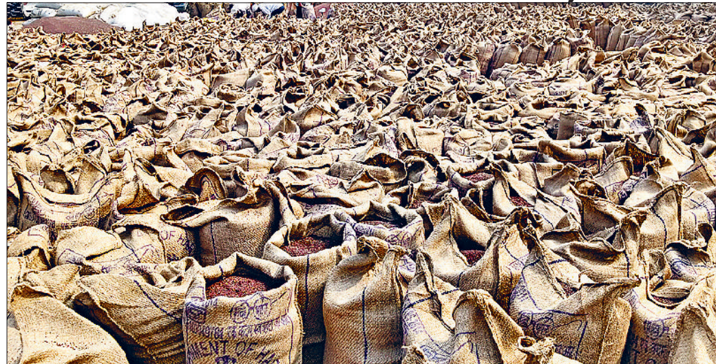
नंगल चौधरी। सरसों की फसल से अटी अनाज मंडी।

जिस कारण देरी लगाने के लिए किसानों को कड़ी मशकत का सामना करना पड़ा है। लिफ्टिंग व्यवस्था नहीं होने के कारण आदतियों ने मंडी की सड़क पर देरी करवाकर खरीद प्रक्रिया शुरू कराई है। शाम पांच बजे तक 890 किसानों की देरी खरीदी गई है लेकिन बारदाना खत्म होने के कारण शाम पांच बजे तक तुलाई शुरू नहीं हो पाई। शाम 5.30 बजे बारदाने का टुक मंडी में पहुंचा, इसके बाद आदतियों को विवर्तित किया है लेकिन 800 से अधिक किसानों को सरसों का तोल करना संभव नहीं