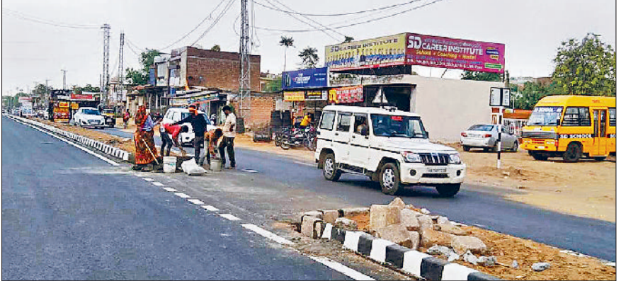
महेन्द्रगढ़। एसडी कोविंग सेक्टर के पास छोड़ा गया कट।

वाहनों की तेज रफतार के कारण आर दिन हो रहे हादसे