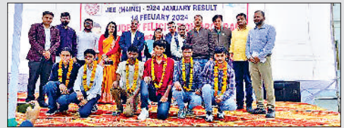
सुपर-100 के अध्यापक करेंगे ताकि वे मेधावी विद्यार्थियों का चयन कर सकें। इस परीक्षा को उत्तीर्ण करने वाले विद्यार्थी सुपर 100 बैच 2024-26 का हिस्सा बनेंगे। इस परीक्षा के लिए एडमिट कार्ड वेबसाइट का लिंक जारी किया जा चुका है। लिंक पर जाकर अपने एडमिट कार्ड डाउनलोड कर सकते हैं। 10वीं की बोर्ड परीक्षा का एडमिट कार्ड एवं अपना जस्टरी सामान साथ लेकर आए तथा कोई महंगा सामान साथ न लें।

दूसरे चरण में प्रत्येक विद्यार्थी को केंद्र पर तीन दिन लगानी होगी क्लास जिले के विद्यार्थियों का तीन दिवसीय आवासीय प्रशिक्षण एक मई से तीन मई 2024 तक विकल्प फाउंडेशन गांव बारना, दांड कुरुक्षेत्र रोड कुरुक्षेत्र में प्रदान किया जाएगा। सुपर 100 लेवल-2 की परीक्षा के लिए सभी चयनित विद्यार्थी तीन दिनों के लिए विकल्प फाउंडेशन के परिसर में उपस्थित रहेंगे, जहां उन्हें गणित और विज्ञान के विषयों का अध्ययन कराया जाएगा। आखिरी दिन एक परीक्षा आयोजित की जाएगी। इस प्रक्रिया के दौरान कक्षाओं के साथ-साथ विद्यार्थियों के व्यवहार पर भी शिक्षकों की नजर रहेगी। लेवल-2 परीक्षा का उद्देश्य केवल विद्यार्थियों की परीक्षा लेना ही नहीं, बल्कि उनके व्यवहार और शिक्षा के प्रति समर्पण को परखना भी है। विद्यार्थी कक्षा में कितना ध्यान केंद्रित करते हैं और पढ़ाई को लेकर उनकी रुचि कितनी है, इसका भी निरीक्षण