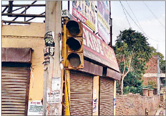
महेंद्रगढ़। राव तुलाराम चौक पर खराब पड़ी ट्रैफिक लाइट।

करीब डेढ़ दशक से भी अधिक समय पहले लगाई गई ट्रैफिक लाइट शो पीस बनी हुई है। इसके अलावा कई जगह पर ट्रैफिक लाइट के पोल टूटकर पड़े हुए हैं। दूसरी तरफ रेड लाइट खराब होने के कारण शहर की ट्रैफिक व्यवस्था चरमरा रही है। हो रही परेशानी इससे शहर में आए दिन जाम की स्थिति बनी रहती है। इससे लोगों को परेशानियों का सामना करना पड़ रहा है। रेड लाइट चालू नहीं होने के कारण चौराहों पर ट्रैफिक पुलिस के दो से तीन कर्मचारी तैनात होते हैं। अगर इन दोनों