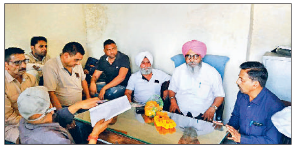
यमुनानगर के बस स्टैंड स्थित यूनियन कार्यालय में आयोजित बैठक में समस्याओं को चर्चा करते हुए रोडवेज कर्मचारी।

सेंट्रल वर्कशॉप हिसार व करनाल को बंद करने की निंदा की गई। इसके अलावा बैठक में वही व जूते के पैसे दिए जाने, लोकल रूट पर कर्मचारियों को ओवरटाइम रेस्ट ना देना, कर्मचारियों के रात्रि ठहराव में कटौती करना व बकाया ओवरटाइम