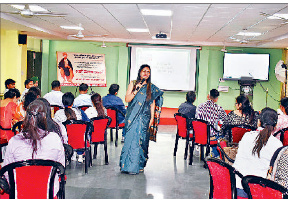
अंबाला। सेमिनार के दौरान मौजूद शिक्षकों को संबोधित करती मुख्य वक्ता।

पुलिस डीएवी पब्लिक स्कूल में केंद्रीय माध्यमिक शिक्षा बोर्ड द्वारा आयोजित साइंस विषय से संबंधित अध्यापकों के लिए दो दिवसीय कैपेसिटी बिल्डिंग सेमिनार का शुभारंभ किया गया। इसमें शिक्षा के स्तर को अधिक प्रभावशाली बनाने के लिए चर्चा की गई। विभिन्न स्कूलों के 40 अध्यापकों ने इस सेमिनार में हिस्सा लिया। इस कार्यक्रम का मुख्य उद्देश्य शिक्षा में गुणात्मक सुधार करना है जो