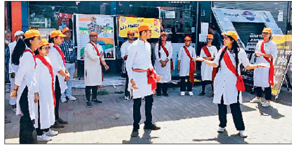
नारायणगढ़। नुककड़ नाटक प्रस्तुत करते हुए छात्र।

इसे दबाया नहीं जा रहा था। जिससे बजरी ऊपरी सतह पर पड़ी रहने से वाहनों के साथ बजरी छिंटकर आसपास के दुकानदारों तक लग रही है। जिससे चोट लगने का भी भय बना रहता है।