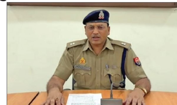
तत्परा से कार्यवाही करते हुए बैंकों के सम्पर्क कर उन बैंक खातों को फ्रीज कराया गया। ये घटनाएं जैसे टेलीग्राम टास्क फ्राड, शेयर ट्रेडिंग

थाना साइबर क्राइम पुलिस ने ऑनलाइन साइबर टगों के पीड़ितों को बड़ी राहत दिलाई है। पुलिस ने टगों का शिकार हुए लोगों को 55 व्यक्तियों के छह करोड़, 73 लाख 45 हजार 787 रुपये वापस कराये। यह धनराशि कोर्ट के आदेश के बाद रिफंड कराए गये। एडीसीपी सचिवालय में बताया कि थाना साइबर क्राइम, पुलिस कमिश्नरट ने विभिन्न साइबर फ्राड की घटनाओं में तत्काल अभियोग पंजीकृत कर