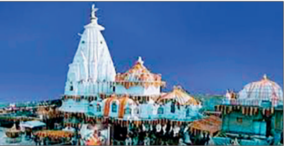
हिमाचल प्रदेश के कांगड़ा में इजेश्वरी मंदिर नगरकोट में स्थित है, भारत के 51 शक्ति पीठों में से एक है। ऐसी माना जाता है कि जलती हुई देवी सती का बायां स्तन उस भूमि पर गिरा जहां आज खूबसूरत बुजेश्वरी मंदिर है, जिसे भारत में सबसे अधिक देखे जाने वाले तीर्थ स्थलों में से माना जाता है।