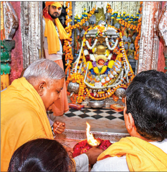
अयोध्या (उप्र)