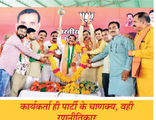
कार्यकर्ता ही पार्टी के चाणक्य, वही रणनीतिकार