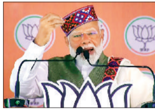
पीएम ने पूछा-क्या ब्राह्मण व बनिनों में भी गरीब नहीं होते?

उनके बच्चों को भी आरक्षण नहीं मिलना चाहिए? प्रधानमंत्री ने कहा कि कांग्रेस ने इस तरफ कभी ध्यान नहीं दिया। उन्होंने कहा कि हमारी सरकार ने गरीब सवर्ण परिवार के बच्चों को भी 10 फीसदी आरक्षण देने का फैसला किया। पीएम मोदी ने इसी के साथ ओबीसी कोटे से मुस्लिमों को आरक्षण देने पर भी कांग्रेस पर हमला बोला।