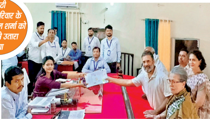
अमेठी से गांधी परिवार के करीबी केएल शर्मा को कांग्रेस से उतारा गया

प्रियंका ने कहा कि हम अमेठी में एक बार फिर सच्चाई और सेवा की राजनीति वापस लाना चाहते हैं