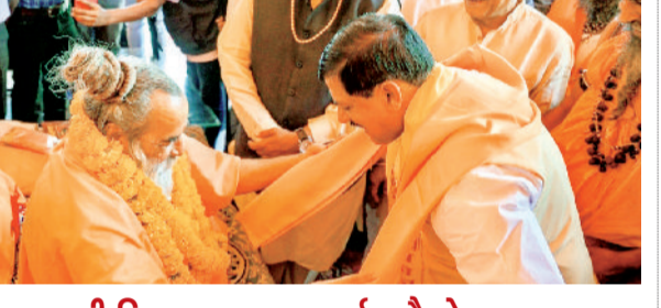
मुख्यमंत्री डॉ. मोहन यादव ने गुरुवार को उज्जैन उत्तर विधानसभा में आयोजित कार्यकर्ता सम्मेलन एवं संत समागम में शिरकत करने के साथ ही देवास, राजगढ़, सागर, लोकसभा क्षेत्रों में जनसभाओं को संबोधित किया।

उज्जैन में कार्यकर्ता सम्मेलन व संत समागम में हुए शामिल