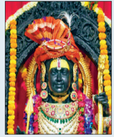
बीएस लारी अयोध्या

अयोध्या पहुंचे पाकिस्तान से 250 राम भक्त, किया श्री रामलला का दर्शन-पूजन, कहा-आंखें भीग गईं