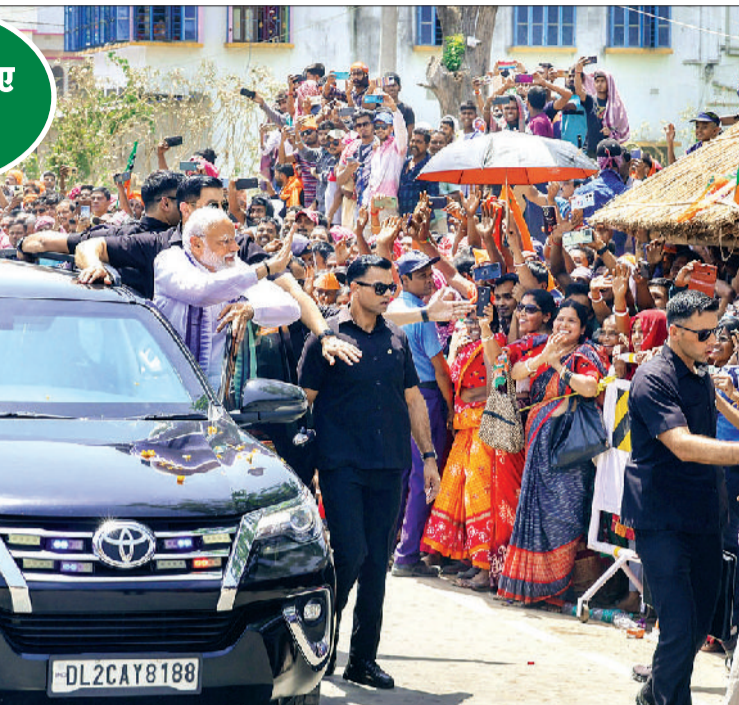
भाड़यो में खुद के लिए जीना नहीं चाहता हूँ मोदी ने विपक्ष पर निशाना साधा और कहा कि इन वोट के मूखे लोगों की पहले 2 चरणों में लूट्टिया डूब चुकी है। अब वे खुलेआम एक नया खेल लेकर आए हैं। अब ये कहते हैं कि मोदी के खिलाफ वोट जिहाद करो। सारे चट्टे-बट्टे (एक ही स्वभाव के लोग) वोट जिहाद से सहमत हैं।

आप ही मेरे लिए परिवारजन मोदी ने कहा कि मेरे लिए तो आप ही मेरे परिवारजन हैं। मेरा भारत मेरा ही परिवार है तो देश के हर परिवार के बच्चे मेरे परिवार हैं। मैं उनके लिए कुछ छोड़ कर जाना चाहूँगा। वामपंथी, टीएमसी और कांग्रेस के लोगों के पास विकास के लिए कोई दृष्टिकोण नहीं है। वामपंथियों ने त्रिपुरा को पूरी तरह से नष्ट कर दिया। देश का विकास करना उनके बस की बात नहीं है। वे केवल एक ही बात जानते हैं और वह है वोट बटोरने के लिए समाज और देश को बांटना।