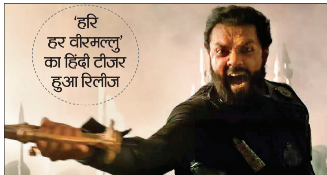
'हरि हर वीरमल्लु' का हिंदी टीजर हुआ रिलीज