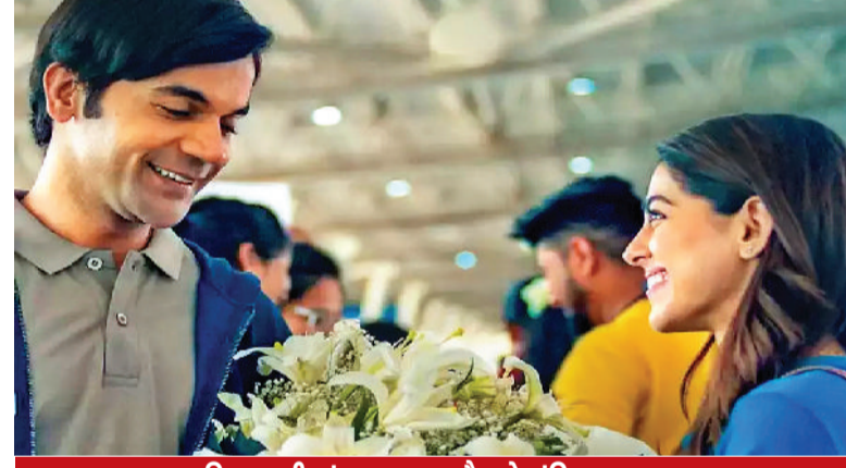
फिल्म श्रीकांत का एक और रोमांटिक गाना

पीड़ितों के नायक के रूप में पवन कल्याण हैं। दोनों सितारों की शारीरिक भाषा, उनके लिए डिज़ाइन किया गया लुक दोनों ही कमाल के हैं। निर्देशक कृष् जगलामुडी पहले ही कांचे, गौतमीपुत्र सातकर्ण और मणिकर्णिका जैसी यादगार ब्लॉकबस्टर फिल्में दे चुके हैं, जिसमें उन नायकों को दिखाया गया है।