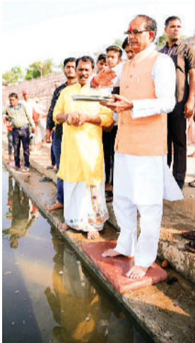
पूर्व मुख्यमंत्री ने गृह गाम जेत में परिवार सहित नर्मदा मेधा की पूजा-अर्चना की।

मतदान से पहले बहनों ने शिवराज सिंह को तिलक लगाकर उनकी आरती उतारी और सिर पर हाथ रख उन्हें आशीर्वाद दिया। इस दौरान पूर्व मुख्यमंत्री ने जनता से अपील करते हुए कहा कि मतदान, लोकतंत्र की आत्मा है और लोकतंत्र के प्रति निष्ठा का प्रतीक है। इसलिए सभी भाई-बहनों, बेटा-बेटियों से अपील है कि अपने मत का प्रयोग जरूर करें। पूर्व मुख्यमंत्री चौहान ने कहा कि माताओं, बहनों का आशीर्वाद मेरे लिए देवी का आशीर्वाद है। ये चुनाव मेरे लिए अद्भुत रहा है। इस चुनाव में, मैं प्रेम की लहर में सवार रहा हूँ।