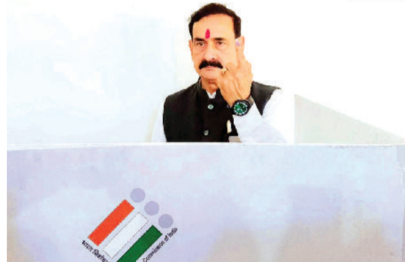
भाजपा न्यू ज्वॉइनिंग टोली के प्रदेश संयोजक डॉ. नरोत्तम मिश्रा ने दतिया के राजघाट कॉलोनी स्थित केंद्रीय विद्यालय, मतदान केंद्र-104 पर मतदान किया।

कर्मक 18 विदिशा के गंजाबासोद के सेक्टर ऑफिसर तथा लोकसभा क्षेत्र कर्मक 19 भोपाल के अधीन भोजपुर विधानसभा क्षेत्र के सेक्टर ऑफिसर विकास से चर्चा कर वहां चल रहे मतदान सहित अन्य व्यवस्थाओं की जानकारी लीं। उन्होंने मतदान केंद्रों में चल रही गतिविधियों का सीसीटीवी कैमरों के जरिए अवलोकन किया। उन्होंने भोपाल लोकसभा क्षेत्र के अधीन दक्षिण-पश्चिम विधानसभा क्षेत्र के वैशाली नगर स्थित मतदान केंद्र क्रमांक 210, लोकसभा क्षेत्र विदिशा, राजगढ़ सहित लोकसभा क्षेत्र मुरैना की सबलगाढ़ विधानसभा क्षेत्र के मतदान केंद्रों में चल रही मतदान प्रक्रिया का अवलोकन किया। इस अवसर पर संयुक्त मुख्य निर्वाचन पदाधिकारी तरुण राठी सहित अन्य अधिकारी उपस्थित थे।