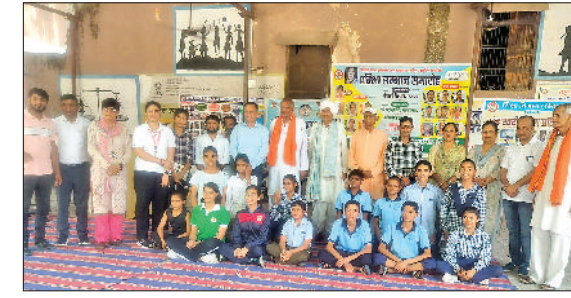
रेवाड़ी। अतिथियों व शिक्षकों के साथ विजेता प्रतिभागी।