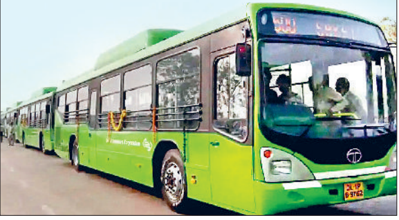
रेवाड़ी। रेवाड़ी में इस तरह की आपूर्ति इलेक्ट्रिक बसें, बस स्टैंड में तैयार किया गया चार्जिंग स्टेशन का फाउंडेशन।

रोडवेज डिपो ने आगामी माह से शहर में सिटी सेवा शुरू करने की तैयारी कर ली है। आगामी जून माह में रोडवेज डिपो को पांच इलेक्ट्रिक बसें मिल जाएंगी। इलेक्ट्रिक बसों को चार्ज करने के लिए बस स्टैंड परिसर में चार्जिंग स्टेशन का फाउंडेशन तैयार किया जा रहा है। शहर की सड़कों पर इलेक्ट्रिक बसें दौड़ाने के लिए रोडवेज विभाग की ओर से प्लान व रूटमैप बनाकर निदेशालय को भी भेजा जा चुका है। आने वाली पांच इलेक्ट्रिक बसों को सरकुलर रोड, रेवाड़ी से धरूहेड़ा, बावल, कुंड, मीरपुर, सेक्टर-18 कॉलेज व पटौदी रूट