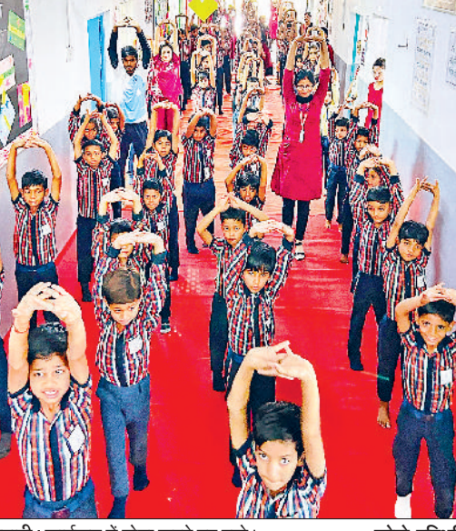
रेवाड़ी। कार्यक्रम में योगा करते हुए बच्चे।