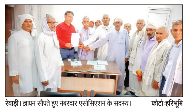
रेवाड़ी। ज्ञापन सौंपते हुए नंबरदार एसोसिएशन के सदस्य।