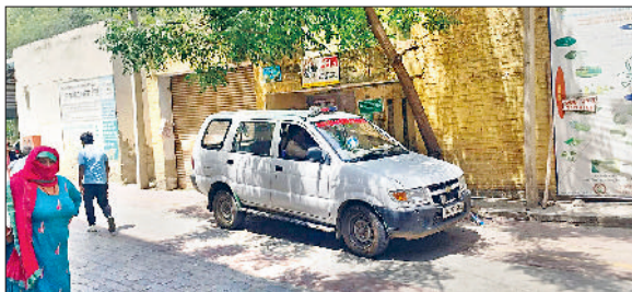
रेवाड़ी। नागरिक अस्पताल में मृतकों का पोस्टमार्टम कराने पहुंची पुलिस।

दिल्ली-जयपुर नेशनल हाइवे पर सोमवार सुबह निखरी के पास अज्ञात वाहन की चपेट में आकर बाइक सवार एक युवक व दो महिलाओं की मौत हो गई। आधार कार्ड से युवक की पहचान हो गई, जबकि महिलाओं की पहचान कराने के प्रयास किए जा रहे हैं। पुलिस ने तीनों शवों को पोस्टमार्टम के लिए अस्पताल भिजवा दिया। सुबह करीब पौने 6 बजे निखरी के पास हाइवे पर तेज धमाके की आवाज सुनकर आसपास के लोग मौके पर