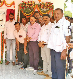
रेवाड़ी। स्कूल में नवनिर्मित हॉल का उद्घाटन करते अधिकारी।