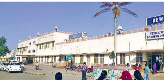
रेवाड़ी। रेलवे जंक्शन का फाइनल फोटो।