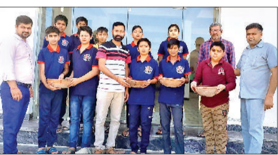
महेंद्रगढ़। बच्चों को पानी के सिकोरे वितरित करते हुए।