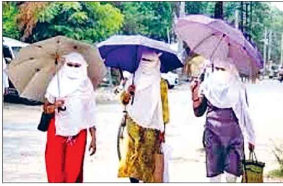
रेवाड़ी। गर्मी से बचाव के लिए छाता लेकर जाती युवतियां।

गर्मी ने दशकों पुराना रिकॉर्ड ध्वस्त कर दिया है। तापमान वर्षों बाद मई माह के अंत में 47 डिग्री पर पहुंच गया है। नौतपा इस बार अच्छी तरह तप रहा है। पहले चार दिन में ही लोगों का लू के थपेड़ों ने बुरा हाल कर दिया है। भारी गर्मी के कारण जन जीवन अस्त-व्यस्त हो गया है। हीटवेव का प्रकोप लगातार बढ़ रहा है, जिससे बचे रहना अत्यंत जरूरी है। हीट स्ट्रॉक की आशंका भी बढ़ने लगी है। स्वास्थ्य विभाग की ओर से इससे बचे रहने का अलर्ट जारी किया गया है। मौसम विभाग के अनुसार भारी गर्मी का असर दो दिन और रह सकता है। इसके बाद आसमान में बादल छांने और बूंदबांदी से मौसम के तेवर नरम पड़ सकते हैं। गत वर्ष की तुलना में मई माह के अंत में इस बार गर्मी लगातार रिकॉर्ड कायम कर रही है। 28 मई के दिन एक दशक के दौरान कभी भी अधिकतम तापमान 43 डिग्री सेल्सियस के पार नहीं गया। गत वर्ष इस दिन अधिकतम तापमान