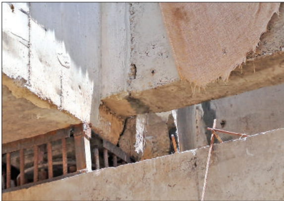
रेवाड़ी। फ्लाईओवर के स्ट्रक्चर में नजर आ रही दरारें।

भाड़ावास रेलवे क्रॉसिंग पर बन रहे फ्लाईओवर के निर्माण में अनियमितताओं को लेकर सवाल उठने लगे हैं। मेन स्ट्रक्चर में अभी से दरारें नजर आने लगी हैं, जो फ्लाईओवर की मजबूती को लेकर सवाल खड़े कर रही है। एक प्रबुद्ध नागरिक ने डीसी के माध्यम से उच्चाधिकारियों को फ्लाईओवर के स्ट्रक्चर में आ रही