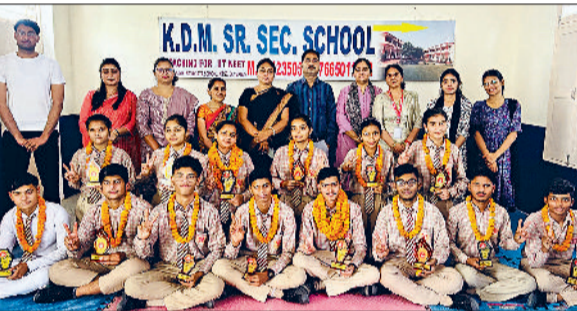
धारुहेड़ा। मेरिट में आए विद्यार्थी स्कूल स्टाफ के साथ।