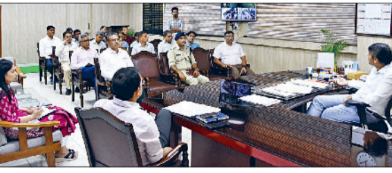
रेवाड़ी। नार्को समन्वय समिति की बैठक में मौजूद अधिकारी।

डीसी राहुल हुड्डा ने कहा कि जिला नार्को समन्वय कमेटी के अधिकारी जिला के युवाओं को नशे रूपी दलदल से बाहर निकालने के लिए उद्योगिक नशे की लत से रोकने के लिए प्रतिदिन अपनी गिरफ्त में ले रहा है, जिससे युवा अपने लक्ष्य व मार्ग से पथभ्रष्ट हो रहे हैं। हमें मिलकर युवाओं को नशे की गिरफ्त से बाहर निकालना होगा। उन्होंने कहा कि जिला प्रशासन मादक पदार्थों के