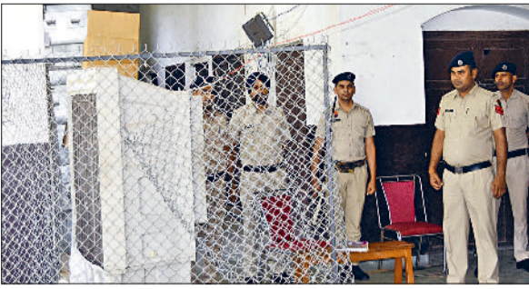
रेवाड़ी। जैन स्कूल में स्ट्रांग रूम के बाहर तैनात जवान तथा स्ट्रांग रूम का निरीक्षण करते डीसी व एसपी।

डीसी एवं जिला निर्वाचन अधिकारी राहुल हुड्डा ने कहा कि लोकसभा चुनाव की मतगणना 4 जून को त्रिस्तरीय अभेद्य सुरक्षा घरे में की जाएगी। उन्होंने कहा कि प्रातः 8 बजे से जिले की तीनों विधानसभाओं के लिए मतगणना प्रक्रिया आरंभ हो जाएगी। उन्होंने कहा कि संबंधित स्टाफ 4 जून को मतगणना के दिन निर्धारित समय पर मतगणना केंद्र में अपनी-अपनी ड्यूटी पर उपस्थित हो जाए। उन्होंने कहा कि कार्टिंग एजेंट एवं कार्टिंग स्टाफ के लिए