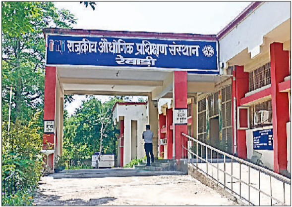
रेवाड़ी। पटौदी रोड स्थित राजकीय आईटीआई।

कौशल विकास एवं औद्योगिक प्रशिक्षण निदेशालय पंचकूला ने हरियाणा के सभी राजकीय एवं निजी औद्योगिक प्रशिक्षण संस्थानों में सत्र 2024-25 के लिए विभिन्न इंजीनियरिंग और गैर इंजीनियरिंग व्यवसायों में दाखिले के लिए ऑनलाइन आवेदन का शेड्यूल जारी कर दिया गया है। विद्यार्थी विभाग की वेबसाइट एडमिशन.आईटीआईहरियाणा.जी.ओ.वी.इन पर 7 जून से 21 जून तक ऑनलाइन आवेदन कर सकते हैं। दाखिले से संबंधित दिशा-निर्देशों के लिए विवरण पत्रिका, संस्थानों की सूची एवं दाखिले के लिए उपलब्ध