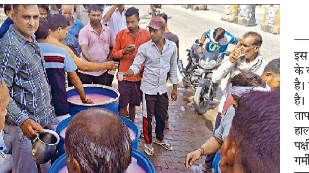
रेवाड़ी। राहगीरों को शरबत पिलाते हुए दुकानदार।