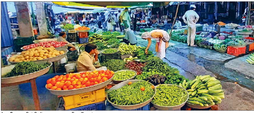
रेवाड़ी। सब्जीमंडी में दुकान पर रखी सब्जियां।

तापमान में बढ़ोतरी व लू चलने से खेतों में झुलस रही बेल पर लगने वाली सब्जियां, बरसात आने पर मिल पाएंगी राहत