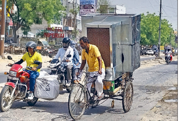
रेवाड़ी। बावल रोड से कूलर लेकर जाता रिक्शा चालक।

बौछारें गिर सकती हैं। बीते दो दिनों से लोगों को भयंकर गर्मी का सामना करना पड़ रहा है। बुधवार को तापमान सौजन में पहली बार 48 डिग्री सेल्सियस पर पहुंच गया था। इस समय नौतपा चल रहा है। इन 9 दिनों में भारी गर्मी को अच्छी मानसून का संकेत भी माना जा रहा है। बढ़ते तापमान में लोगों का सामान्य जीवन अस्त-व्यस्त कर दिया है। सुबह 9 बजे से ही गर्म हवाओं के चलने से लोगों का घरों से बाहर निकलना मुश्किल बन रहा है। शाम को 5 बजे के बाद व देर रात तक भी गर्म हवाएं जमकर परेशान कर रही हैं। बुधवार शाम के समय