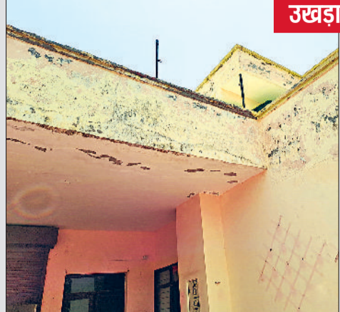
रेवाड़ी। न्यायाधीशों के भवन में आई दरार, न्यायाधीशों के भवन की चारदीवारी का उखड़ा प्लास्टर।