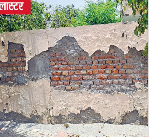
उखड़ा प्लास्टर