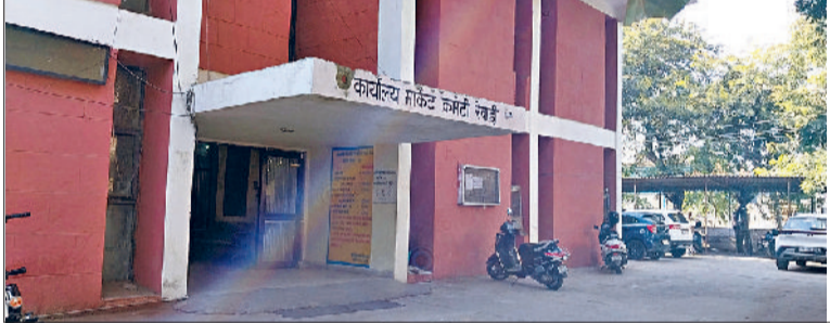
रेवाड़ी। नई अनाजमंडी स्थित मार्केट कमिटी कार्यालय।

हरियाणा राज्य कृषि विपणन बोर्ड के अंतर्गत चलाई गई विवादों के समाधान-2 योजना की समय सीमा 12 मार्च से आगे बढ़ाकर 30 जून कर दी गई है। योजना के तहत जिले में मार्केट कमेटियों के अधीनस्थ संचालित सब्जी व अनाज मंडियों के जिन दुकानदारों ने अपनी दुकानों, प्लॉट व बूथ की बकाया किस्त नहीं जमा कराई है वह स्क्रीम का लाभ लेकर ब्याज में 40 प्रतिशत व पैनल ब्याज में 100 प्रतिशत छूट ले सकते हैं। जिन प्लॉट धारकों ने अभी तक न तो एक भी किस्त जमा कराई है और न ही निर्माण समय सीमा बढ़वाने की फीस भरी है, वह भी इस योजना में शामिल होकर इसका लाभ उठा सकते हैं। यदि दुकानदारों ने कंपलीशन प्रमाण