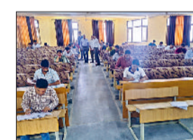
रेवाड़ी। आईजीयू में परीक्षा देते परीक्षार्थी।