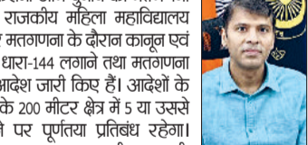
तंबाकू शरीर के पूरे इन्फ्यूज सिस्टम को प्रभावित करता