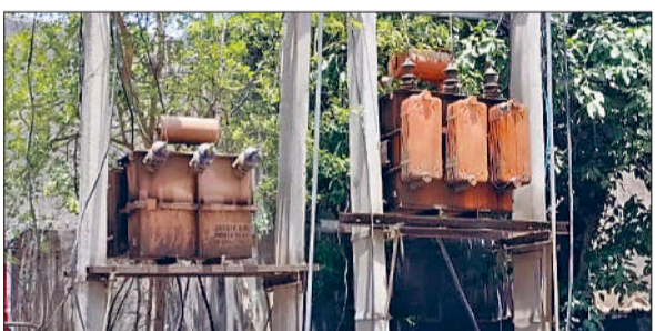
रेवाड़ी। नंदरामपुर बास रोड पर लगे ट्रांसफार्मर। फोटो: हरिभूमि

■ बिजली के अघोषित कटों की वजह से कई बार पेयजल आपूर्ति भी प्रभावित हो रही है। फोटो: हरिभूमि