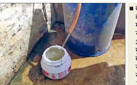
रेवाड़ी। बावल के वार्ड नं. 5 में सप्लाई हो रहा दूषित पानी।