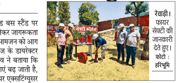
रेवाड़ी। फायर सेफ्टी की जानकारी देते हुए।