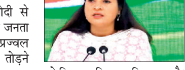
को गिरफ्तार गिरफ्तार किया गया है। उन्होंने उम्मीद जताई कि इस गिरफ्तारी से सैकड़ों पीड़ित महिलाओं को न्याय मिलेगा। लांबा ने पीएम से चुप्पी तोड़ने का आग्रह करते हुए कहा कि वे 'बेटी बचाओ का नाम' देते रहे लेकिन प्रज्वल पर अपनी चुप्पी नहीं तोड़ी।

कांग्रेस ने पीएम नरेंद्र मोदी से कर्नाटक की हासन सीट से जनता दल (सेक्युलर) सांसद प्रज्वल रेवन्ना के मामले में चुप्पी तोड़ने तथा यह सुनिश्चित करने का आग्रह किया है कि वे गिरफ्तार सांसद को अब किसी भी तरह का समर्थन न दें। महिला कांग्रेस की अध्यक्ष अलका लांबा ने पार्टी मुख्यालय में संवाददाता सम्मेलन में कहा कि कई महिलाओं के साथ दुर्घटना के मामले में मिली शिकायतों के बाद सांसद को गिरफ्तार गिरफ्तार किया गया है। उन्होंने उम्मीद जताई कि इस गिरफ्तारी से सैकड़ों पीड़ित महिलाओं को न्याय मिलेगा। लांबा ने पीएम से चुप्पी तोड़ने का आग्रह करते हुए कहा कि वे 'बेटी बचाओ का नाम' देते रहे लेकिन प्रज्वल पर अपनी चुप्पी नहीं तोड़ी।