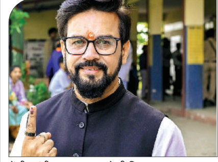
केंद्रीय मंत्री अनुराग ठाकुर ने भी किया मतदान।