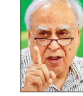
बात पर गौर करना चाहिए।

सिब्ल ने फिर पुराना राग अलापा पोस्टल बैलेट की काउंटिंग में हो सकती है गड़बड़ी