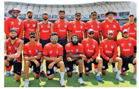
टी20 विश्व कप : अमेरिका का पलड़ा मारी, कनाडा के खिलाफ मैच आज