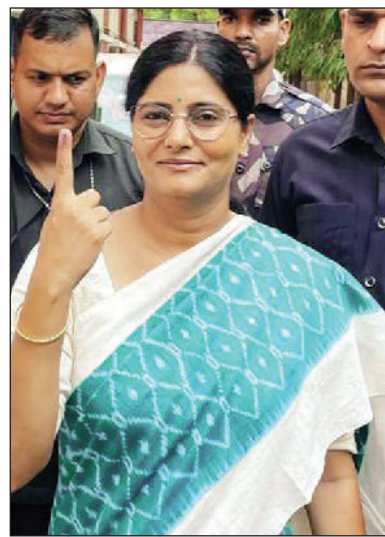
केंद्रीय मंत्री अनुप्रिया पटेल ने मिर्जापुर में मतदान किया