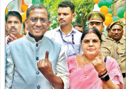
सिक्किम के राज्यपाल ने वोट का महत्व बताया।