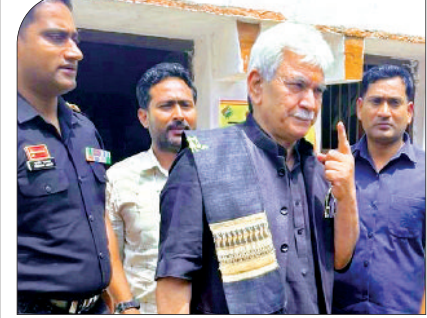
जम्मू-कश्मीर के राज्यपाल इंक लगी अंगुली बता रहे।