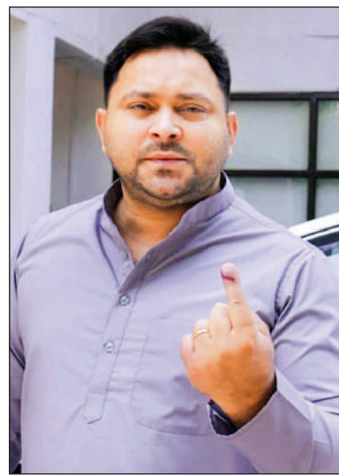
बिहार के पूर्व डिप्टी सीएम ने पटना में डाला वोट

दारोगा समेत कई पुलिस वाले बेहोश, एक मतदाता की हुई मौत