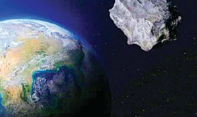
कब धरती से टकरा सकता है ऐस्टरॉइड

अमेरिकी अंतरिक्ष एजेंसी नासा ने जानकारी दी है कि एक खतरनाक क्षुद्रग्रह यानी ऐस्टरॉइड के पृथ्वी से टकराने की प्रबल संभावना है। नासा ने कहा है कि संभावित रूप से खतरनाक क्षुद्रग्रह के पृथ्वी से टकराने की 72% संभावना है। नासा ने इसके साथ ये भी कहा है कि हम इसे रोकने के लिए पर्याप्त रूप से तैयार नहीं हो सकते हैं। असल में ऐस्टरॉइड या क्षुद्रग्रह हमारे सौर मंडल के निर्माण के बाद बचे चट्टानों के टुकड़े होते हैं। चार मीटर व्यास वाले लगभग आधा अरब ऐस्टरॉइड सूर्य की परिक्रमा करते रहते हैं।