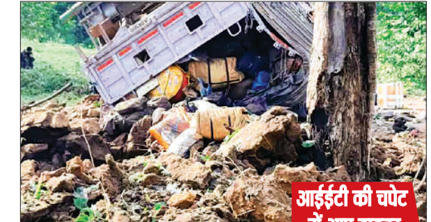
आईडी की चपेट में आए ड्राइवर और सह-चालक

एजेसी रायपुर छत्तीसगढ़ के सुकमा जिले में नक्सलियों द्वारा आईडी ब्लास्ट किया गया है। जवानों की मूवमेंट के बीच नक्सलियों द्वारा सिलगेर इलाके में आईडी ब्लास्ट किया गया है। नक्सलियों ने जवानों के ट्रक को निशाना बनाकर विस्फोट किया। इस घटना में सीआरपीएफ के दो जवान शहीद हुए हैं जबकि कई जवानों के घायल होने की खबर है। सुकमा के एसपी किरण चव्हाण ने की घटना की पुष्टि की है। एसपी किरण चव्हाण ने बताया कि जगरगुडा क्षेत्र के अंतर्गत कैम्प सिलगेर से 201 कोबरा वाहिनी की एडवांस पार्टी आरओपी ड्यूटी के दौरान कैम्प टेकलगुडम जा रही थी। कार्फिले में ट्रक और मोटर साइकल शामिल था। कैम्प सिलगेर से टेकलगुडम जाने के रास्ते में नक्सलियों द्वारा सुरक्षा बलों को नुकसान पहुंचाने की नियत से आईडी प्लांट किया गया था।