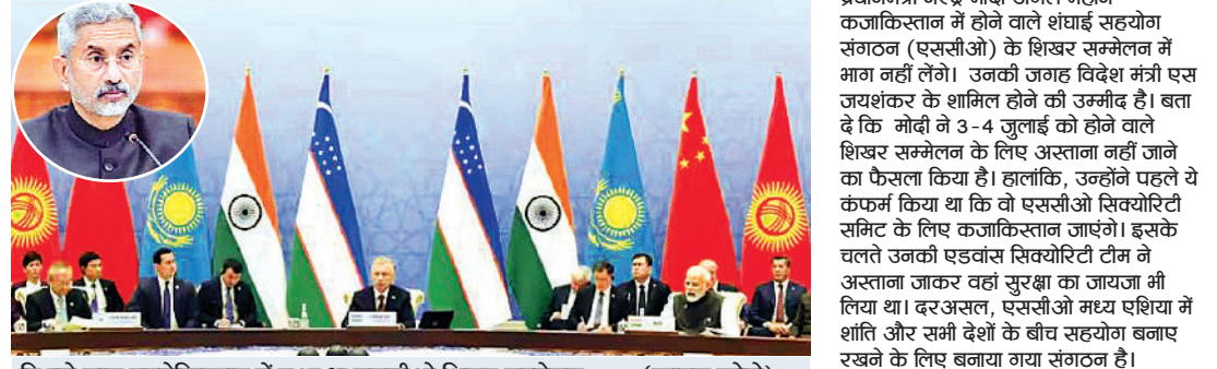
पिछले साल उज्बेकिस्तान में हुआ था एससीओ शिखर सम्मेलन (फाइल फोटो)

जयशंकर की यात्रा भारत और यूएई के बीच व्यापक रणनीतिक साझेदारी के साथ-साथ क्षेत्रीय और वैश्विक विकास की समीक्षा करने का अवसर प्रदान करेगी