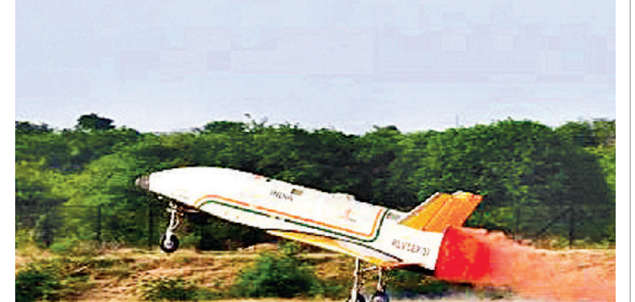
कर्नाटक के चित्रदुर्ग में हुआ सफल परीक्षण कर्नाटक के चित्रदुर्ग में रविवार सुबह 07:10 बजे लैंडिंग एक्सपेरिमेंट के तीसरे और फाइनल टेस्ट को अंजाम दिया गया। चित्रदुर्ग के एरोनॉटिकल टेस्ट रेंज में पुष्पक को इंडियन एयरफोर्स के चिन्नूक हेलिकॉप्टर से 4.5 किमी की ऊंचाई तक ले जाया गया और रनवे पर ऑटोनॉमस लैंडिंग के लिए छोड़ा गया। पुष्पक ने क्रॉस रेंज करेक्शन मनुवर को एडजस्ट करके हुए होरिजेंटल लैंडिंग को सटीकता से अंजाम दिया। उल्लेखनीय है कि पहला लैंडिंग एक्सपेरिमेंट 2 अप्रैल 2023 और दूसरा 22 मार्च 2024 को किया गया था।