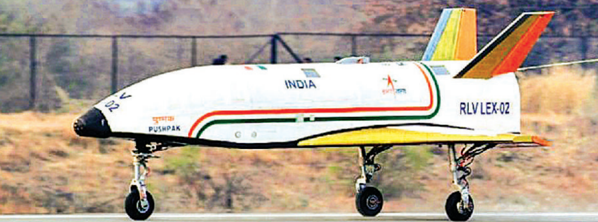
इसरो की ऐतिहासिक कामयाबी इसरो ने सोशल मीडिया प्लेटफॉर्म एक्स पर एक पोस्ट में कहा है, कि "पुष्पक ने चुनौतीपूर्ण परिस्थितियों में एडवांस ऑटोनॉमस क्षमताओं का प्रदर्शन करते हुए सटीक क्षैतिज लैंडिंग की है। आरएलवी लेक्स के उद्देश्यों को पूरा करने के साथ, इसरो ने ऑडिबल रीयूजेबल व्हीकल आरएलवी-ओआरवी में प्रवेश किया। करफंड ने कहा है, कि ये लैंडिंग काफी तेज हवालों के बीच करवाई गई है और लैंडिंग से पहले मुश्किल वातावरण का निर्माण किया गया था, ताकि चुनौतीपूर्ण परिस्थितियों में इस क्षमता का परीक्षण किया जा सके।

भारतीय अंतरिक्ष अनुसंधान संगठन (इसरो) ने एक बार फिर से इतिहास रच दिया है और दिखा दिया है कि भारत की वैज्ञानिक क्षमता में कितनी ताकत है और इसरो क्या क्या कर सकता है।