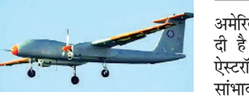
28,000 फीट की ऊंचाई तक पहुंचने में कामयाब

तापस ड्रोन का ट्रैपल रक्षा बलों को ओर से किया गया है। इन परीक्षणों के दौरान वे 28,000 फीट की ऊंचाई तक पहुंचने में कामयाब रहे और 18 घंटे से अधिक समय तक उड़ सकते थे।