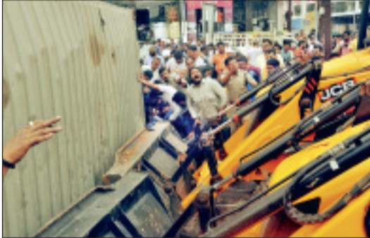
दो क्रेन की मदद से निकाला।