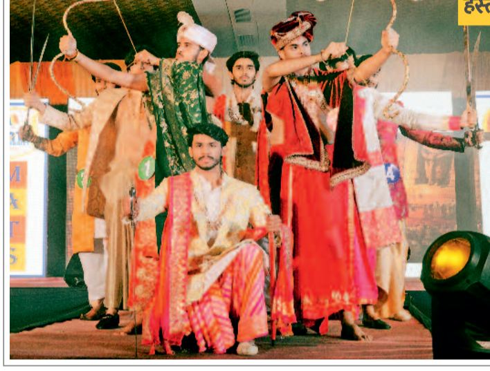
हस्त मुद्राओं के भाव पर प्रस्तुति

मैट्स यूनिवर्सिटी द्वारा आयोजित फैशन शो में पहली बार दिव्यांगों ने हिस्सा लिया, जिन्होंने व्हीलचेयर के सहारे प्रस्तुति दी। दिव्यांगों की प्रस्तुति के दौरान दर्शकों की आंखें नम हो गईं, जिन्होंने तालियों से सभी का मनोबल बढ़ाया। इस अवसर पर प्रत्येक डिजाइनर ने दिव्यांगों के लिए ब्राइडल ड्रेस डिजाइन किया और दिव्यांगों के साथ मंच पर नजर आए। विदाई गीत के साथ मंच पर व्हीलचेयर के सहारे प्रस्तुति देती हुई दिव्यांगों की आंखों से आंसू छलकने लगे, जिसे देखकर दर्शक भी खुद को रोक न सके।