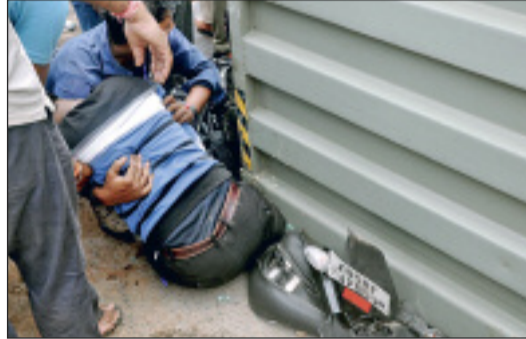
युवक के ऊपर गिरा कंटेनर।