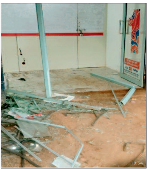
रूप को अज्ञात चोरों ने चोरी करके रफू चक्कर हो गए।

तिलदा नेवरा छेत्र में चोर काफ़ी सक्रिय है। अज्ञात चोरों ने शुक्रवार की देर रात ग्राम पंचायत सरोरा में रोड किनारे स्थित इंडिया 1 की एटीएम मशीन को उखाड़कर ले गए। चोरों ने अपनी गाड़ी से एटीएम को उखाड़ी और फिर गाड़ी में लेकर फरार हो गए। खबर लिखे जाने तक एटीएम मशीन के अंदर कितने रुपये नगदी थी उसकी जानकारी नहीं हो पाई है।