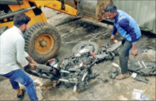
हादसा ऐसा कि बाइक चक्रान्चूर।