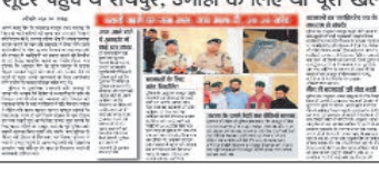
मलेशिया से मारने का आदेश, बाइक राइडर बनकर शूटर पढ़ें थे रायपुर, उगाही के लिए था पूरा खेल