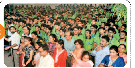
अधिकतर छात्रों ने दसवीं के बाद से ....