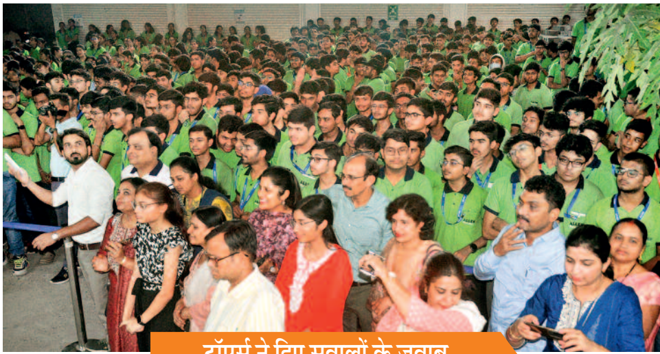
टॉपर्स ने दिए सवालों के जवाब

आईआईटी मद्रास द्वारा जेईई एडवांस के परीक्षा परिणामों की घोषणा की जा चुकी है। नतीजे आने के साथ ही अब काउंसिलिंग प्रक्रिया शुरू कर दी जाएगी। छत्तीसगढ़ के विद्यार्थियों ने भी इस बार जेईई में अच्छा प्रदर्शन किया है। पहली बार टॉप-10 में छग के छात्र ने जगह बनाई।