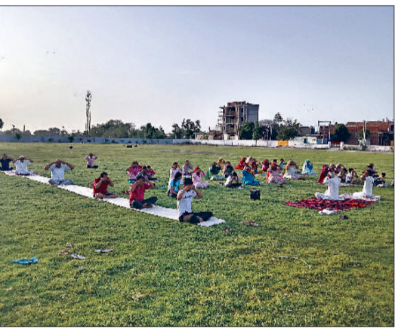
रेवाड़ी। शिविर में योगाभ्यास करते योग साधक।

डीसी हुड्डा ने कहा कि मानव जीवन के लिए जल की एक-एक बूंद अनमोल है। उन्होंने कहा कि गर्मी के मौसम में पानी की कितनी किल्लत होती है, हमें इस बात को समझना चाहिए। हमें जल ही जीवन के के सिद्धांत को अपने जीवन में अपनाया चाहिए। उन्होंने कहा कि जल संरक्षण की जिम्मेदारी केवल सरकार व जिला प्रशासन की नहीं है। जल संरक्षण में सभी का सहयोग जरूरी है। स्कूली बच्चों और शिक्षक घर हो या स्कूल, दोनों जगह पानी बचाएं। उन्होंने कहा कि आमजन अपने निजी वाहनों, मकानों व घरों को धोने में पानी की बर्बादी न करें। यदि समय रहते व्यर्थ पानी बहाना बंद न किया तो भविष्य में हमें इसके गंभीर परिणाम भुगतने होंगे। हमारी डीसी सी लापरवाही के कारण कौमोती जल व्यर्थ में बह जाता है। जल सुलु छोड़कर व्यर्थ पानी न बहाएं। सभी नलों पर टैटी अवरस लगाएं। जल भरने पड़ने पर ही पानी का इस्तेमाल करें। उन्होंने आमजन से अपने वाहनों को पानी से धोने की बजाए गीले कपड़े से साफ करने का आह्वान किया। डीसी ने कहा कि हमारे द्वारा आज की गई पानी की बचत आने वाली पीढ़ी के काम आएगी। हम सभी को अपनी जिम्मेदारी समझनी चाहिए।