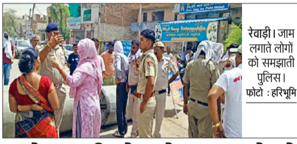
रेवाड़ी। जाम लगाते लोगों को समझाती पुलिस।

रेवाड़ी। हिंदू समुदाय में एकादशी तिथि का विशेष महत्व होता है। ज्येष्ठ मास में पड़ने वाली एकादशी को अचला या अपरा एकादशी कहा जाता है। यह एकादशी रविवार 2 जून को धूमधाम से मनाई जाएगी। ज्योतिषाचार्यों का कहना है कि एकादशी तिथि का दिन भगवान विष्णु को समर्पित माना जाता है। एकादशी पर पवित्र नदियों में स्नान का विशेष महत्व होता है। गरीबों व जरूरतमंद को दान करने की भी परंपरा है। मान्यता है कि इस दिन मां लक्ष्मी व भगवान विष्णु की पूजा करने से सुख-समृद्धि का वास होता है। उनका कहना है कि रविवार को अपरा एकादशी का शुभारंभ सुबह 5 बजकर 4 मिनट पर होगा, जो सोमवार की रात 2 बजकर 41 मिनट तक रहेगा। माना जाता है कि इस व्रत को रखने से पहले यानी दशमी के दिन शाम में सूर्यास्त के बाद से ही व्यक्ति को भोजन नहीं करना चाहिए। फिर एकादशी के दिन सुबह स्नान के बाद भगवान विष्णु की विधि अनुसार पूजा करनी चाहिए। इस दौरान पूजा में तुलसी पत्ता, श्रीखंड चंदन, गंगाजल एवं मौसमी फलों का प्रसाद भगवान को अर्पित करें।