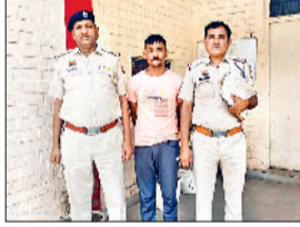
रेवाड़ी। पुलिस गिरफ्तार में आरोपी।