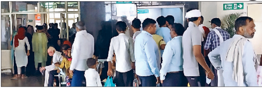
रेवाड़ी। नागरिक अस्पताल में लगी मरीजों की भीड़।

मई माह के बाद जून माह की गर्मी भी लोगों को जमकर परेशान करने वाली है। मौसम का लगातार बदलाव लोगों को बीमार कर रहा है। मौसमी बीमारियों के चलते बड़ी संख्या में लोग अस्पताल पहुंच रहे हैं। आगामी दिनों में स्वास्थ्य विभाग के सामने अब सबसे बड़ी चुनौती मलेरिया और डेंगू से निपटने की है। जून माह के अंत में मानसून के आने की भी पूरी संभावना है। बरसात शुरू होने के बाद डेंगू व मलेरिया के रोगों की आशंका बढ़ जाती है, लेकिन प्रति वर्ष स्वास्थ्य विभाग की सख्ती होने पर भी डेंगू के आंकड़े काफी बढ़ जाते हैं। गत वर्ष जिले में 406 डेंगू व मलेरिया में ओपीडी भी गत वर्ष के मुकाबले 20 प्रतिशत ज्यादा बढ़ चुकी है। स्वास्थ्य विभाग की ओर से गर्मी के