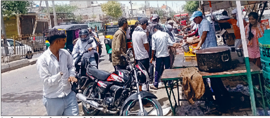
रेवाड़ी। धारूहेड़ा में छबील से मीठा पानी पीते लोग।