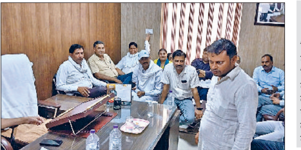
रेवाड़ी। नगर परिषद कार्यालय में मौजूद नगर पार्षद।

भेजे जा रहे हैं, जिनमें ज्यादातर पकड़े गए गोवंश पशुपालकों के हैं। पशुपालकों की ओर से गोवंश को छुड़वाने के लिए 5 हजार रुपए का जुर्माना निर्धारित किया गया है। पशुपालकों को नगर परिषद में रसीद कटवाने के बाद गोशाला में दिखानी होगी, जिसके बाद ही गोवंश को छोड़ा जाएगा। एजेंसी को प्रति गाय पकड़ने के लिए 2050, सांड के लिए 2450 व एक बछड़े को पकड़ने के लिए 1750 रुपए का ठेका किया गया है। भाड़ावास पुलिस चौकी को दी शिकायत एजेंसी की ओर से तीन गोवंश पकड़े जाने पर नगर परिषद में 23