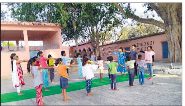
रेवाड़ी। कार्यक्रम में शपथ लेते हुए बच्चे।

में रोजाना छबील लगाकर लोगों को गर्मी में राहत देने का कार्य कर रहे हैं। गर्मी भी अपने पूरे चरम पर आ चुकी है। लोगों को जल्द ही बरसात के आने का इंतजार है।