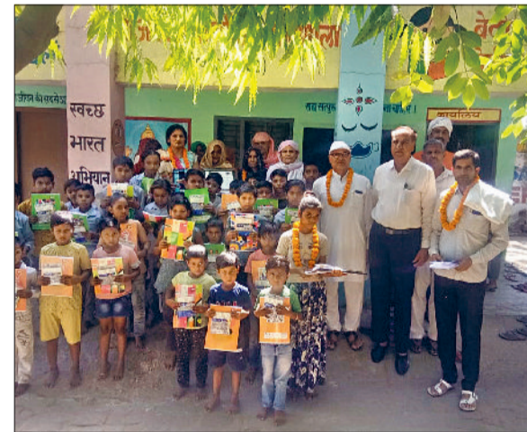
रेवाड़ी। बच्चों को सम्मानित करते हुए शिक्षक।