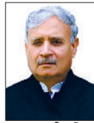
राव इंद्रजीत सिंह