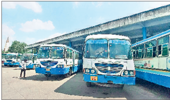
रेवाड़ी। बस स्टैंड में खड़ी हुई हरियाणा रोडवेज, परिवहन निदेशालय की ओर से जारी किया गया लेटर।

परिवहन विभाग में भाई-भतीजावाद, नेतागिरी और राजनीतिक संरक्षण के चलते रूटों पर चलने की बजाय ऑफिस में आराम फरमाने वाले चालक-परिचालकों को अब हर हाल में रूटों पर चलना होगा। परिवहन निदेशालय ने मामले की गंभीरता को देखते हुए प्रदेश के सभी जीएम को इस संबंध में आदेश जारी किए गए हैं। निदेशालय ने उन चालकों का ब्योरा भी एक सप्ताह में मुख्यालय को भेजने के आदेश दिए हैं, जो तीन साल की अवधि के दौरान महज 500 किलोमीटर भी बसों को नहीं दौड़ा पाए। विभाग में इयूटी को लेकर एक ओर जहां भाई-भतीजावाद को बढ़ावा दिया जा रहा है, तो दूसरी ओर राजनीतिक पहुंच वाले चालक-परिचालक विभाग के