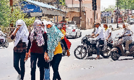
रेवाड़ी। शुक्रवार को भीषण गर्मी में सरकुलर रोड से गुजरती छात्राएं, गर्मी में मुंह पर पानी डालता ऑटो चालक, गर्मी में स्पाकिंग होने से ट्रॉसफार्मर के पास कवर में लगी आग।

नौतपा शुरू होने के छठे दिन भी भयंकर गर्मी ने लोगों को जमकर परेशान किया। एक दिन पूर्व तापमान में आई मामूली कमी दूर हो गई। इस बार गर्मी ने लोगों का जीना ह्राम किया हुआ है। तापमान 47 डिग्री सेल्सियस के आसपास ही चल रहा है। मौसम विभाग के अनुसार जून माह के शुरू में आसमान में बादल और कुछ इलाकों में बौछारें गिरने से तापमान में गिरावट आ सकती है, जो लोगों को लू के भारी प्रकोप से राहत देने का काम कर सकती है। शुक्रवार को सुबह के समय आसमान में आंशिक बादल छाए रहे, परंतु सूर्योदय के