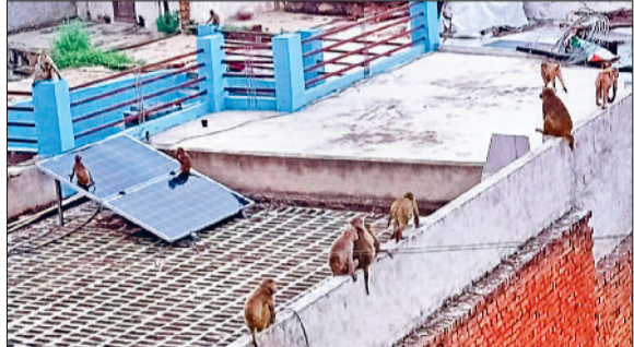
रेवाड़ी। नाहड़ में मकानों की छत पर बंदरों का जमावड़ा, गली में बैठे हुए बंदर, रास्ते में झुंड में बैठे बंदर व गुजरती महिला।

■ लोगों को जख्मी करने के साथ गाड़ियों व सामान का भी कर रहे मुकसान