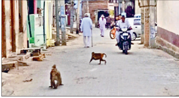
रेवाड़ी। नाहड़ में मकानों की छत पर बंदरों का जमावड़ा, गली में बैठे हुए बंदर, रास्ते में झुंड में बैठे बंदर व गुजरती महिला।