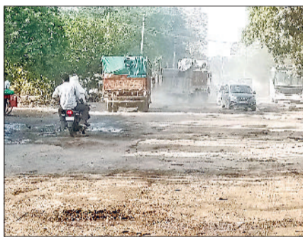
रेवाड़ी। नंदरामपुर बास रोड पर उड़ती धूल।

धारूहेड़ा के निकटवर्ती गांव अलावलपुर, ततारपुर, नंदरामपुर बास व भटसाना के ग्रामीणों ने सरकार से नंदरामपुर बास मार्ग की सड़क का निर्माण कराने का आग्रह किया है ताकि लोगों को आवागमन करने में कोई परेशानी न उठानी पड़े। ग्रामीणों ने कहा कि इन गांवों की सड़क दयनीय हालत में आ चुकी है। हरियाणा के पूर्व मुख्यमंत्री मनोहर लाल खट्टर ने सड़क बनवाने का आश्वासन भी दिया था, लेकिन समस्या ज्यों की त्यों बनी हुई है। ग्रामीणों ने बताया कि सड़क को उखाड़े हुए एक माह होने को है, लेकिन निर्माण कार्य अधर में लटका हुआ है। वाहनों के आवागमन करने से दिनभर धूल उड़ती रहती है, जिससे दोपहिया वाहन सवारी व आसपास रहने वाले लोगों को बड़ी परेशानी उठानी पड़ रही है। समाजसेवी रामपाल यादव ततारपुर, पूर्व सरपंच