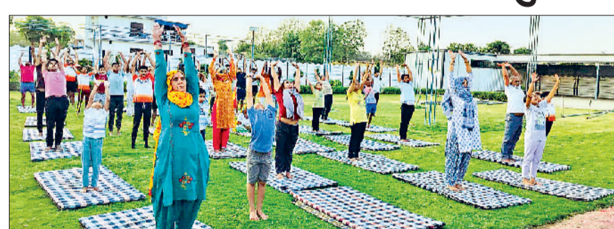
रेवाड़ी। शिविर में योगाभ्यास करते बच्चे व बुजुर्ग।