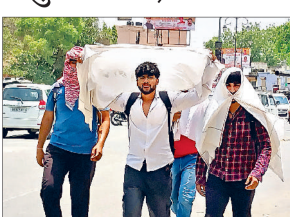
रेवाड़ी। रविवार को सूना पड़ा शहर का मार्ग।

हरीभूमि न्यूज़ रेवाड़ी दो दिन से एक बार फिर गर्मी अपने तेवर दिखाने लगी है। दो व रात का तापमान बढ़ने से सोमवार को भीषण गर्मी में लोग परेशान नजर आए। तेज धूप व लू ने लोगों को जमकर परेशान किया। हालांकि दोपहर बाद आसमान में बादलों के छा जाने से धूप से तो राहत मिली, लेकिन उमस बढ़ जाने से लोगों के पसीने छूटते रहे। तीन दिन पहले तापमान में गिरावट से लू का प्रकोप कम हो गया था, लेकिन सोमवार को तापमान बढ़ने के साथ तेज धूप व गर्म हवाओं ने लोगों को काफी परेशान किया। मौसम विशेषज्ञों के अनुसार इस सप्ताह मौसम इसी तरह का बना रहने का अनुमान है। बीच-बीच में आंशिक बादलों के छाने का अनुमान है तथा तापमान में लगातार उतार-चढ़ाव देखने को मिलेगा। सोमवार को सुबह से ही आसमान साफ रहा। दोपहर तक तेज धूप के कारण भारी गर्मी लोगों के पसीने छुड़ाती रही। लू के थपेड़ों ने लोगों को काफी परेशान किया। अधिकतम तापमान 104 डिग्री सेल्सियस बढ़कर 44 पर आ गया तथा न्यूनतम तापमान 1.7 डिग्री सेल्सियस की बढ़ोतरी के साथ 28.5 पर पहुंच गया। भारी गर्मी का