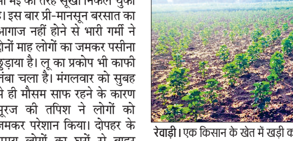
रेवाड़ी। एक किसान के खेत में खड़ी कपास की फसल।

हीटवेव का प्रकोप खत्म होने से पहले लोगों को जमकर परेशान कर रहा है। रात के तापमान में एक बार फिर वृद्धि हुई है, जबकि दिन के तापमान में मामूली गिरावट ने भी गर्मी से राहत नहीं दी है। आसमान में आंशिक बादल मौसम में जल्द बदलाव का संकेत दे रहे हैं। मौसम विभाग के अनुसार बुधवार से मौसम में परिवर्तन आ सकता है, जिससे लोगों को जल्द भारी गर्मी से राहत मिल सकती है। जून माह का पहला पखवाड़ा