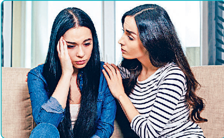
वैश्विक स्वास्थ्य खतरा तक माना जा रहा है। परिवेश में बढ़ती तपिश से आक्रामकता और हिंसक आत्महत्याओं की दर में वृद्धि होने का संभावना

इन दिनों देश के कई हिस्सों में तेज धूप और लू के थपेड़ों ने लोगों की परेशानी बढ़ा रखी है। स्वास्थ्य से जुड़ी परेशानियां हर आयुवर्ग के लोगों को घेर रही हैं। हम जानते हैं कि अत्यधिक तपिश का मौसम तन ही नहीं, मन से जुड़ी कई स्वास्थ्य समस्याएं भी साथ लाता है। बढ़ती तपिश तनाव का अहम कारण बनती है। शरीर डिहाइड्रेशन और मन थकान की शिकार से जूझता है। विशेषज्ञ भी मानते हैं कि तेज तापमान के साइड-इफेक्ट्स की सूची में मन की मायूसी भी शामिल है। गर्मियों में लोग अवसाद और अकेलेपन के भी शिकार हो जाते हैं, जिसे 'समरटाइम ब्लूज' कहा जाता है। लंबे दिन, बढ़ती गर्मी और उमस के चलते भूख न लगना, अनिद्रा और बेचैनी जैसी समस्याएं भी घेर लेती हैं। बच्चे हों या बड़े, समर फटींग या गर्मियों में होने वाली शारीरिक थकान का शिकार हो सकते हैं।