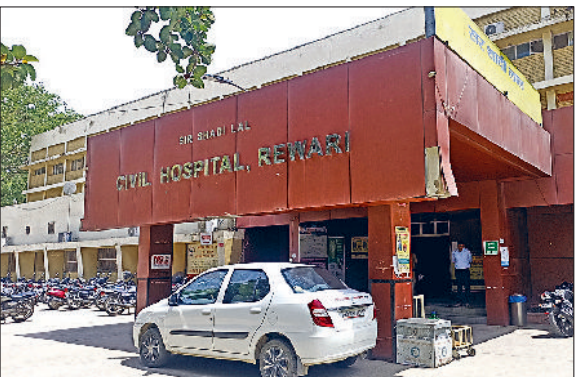
रेवाड़ी। सर शादीलाल नागरिक अस्पताल परिसर।

बढ़ते लिंग विषमतानुपात को कंट्रोल करने के लिए सरकार, प्रशासन और स्वास्थ्य विभाग की ओर से भले ही परसक प्रयास किए जा रहे हैं, परंतु हकीकत शिथिल समाज की असल तस्वीर से पर्दा उठा रही है। जिले के सात गांव ऐसे हैं, जहां लड़कों की तुलना में लड़कियों की संख्या आधी भी नहीं है। लिंगानुपात में औलांत गांव में प्रति एक हजार लड़कों की तुलना में 393 लड़कियों का आंकड़ा समाज को आइना दिखाने के लिए काफी है। स्वास्थ्य विभाग की ओर से लिंग विषमतानुपात को कम करने के प्रयास भी पूरी तरह सफल साबित नहीं हो पा रहे हैं। सरकार की 'बेटी बचाओ-बेटी पढ़ाओ' मुहिम भी कई गांवों में दम तोड़ती नजर आ रही है।