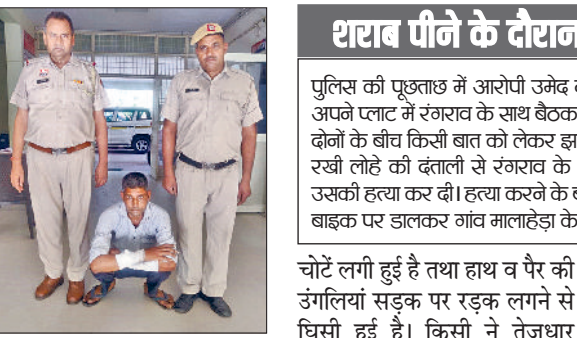
रेवाड़ी। पुलिस गिरफ्त में हत्या का आरोपी।

गांव के ही एक व्यक्ति ने लोहे की दंताली से वार कर की थी हत्या, शराब पीने के दौरान हुआ था झगड़ा