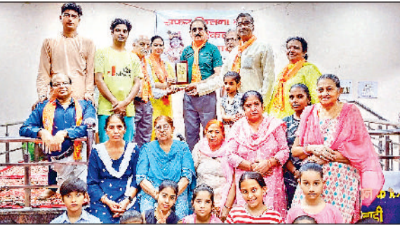
रेवाड़ी। अतिथियों को सम्मानित करते संस्था सदस्य।