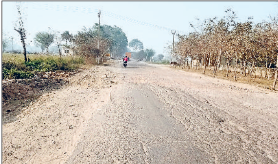
रेवाड़ी। खटावली से मीरपुर का लिंक रोड।