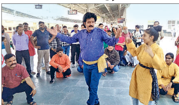
रेवाड़ी। रेलवे स्टेशन पर नुक्कड़ नाटक करते कलाकार एवं कर्मचारियों को नशा न करने की शपथ दिलाते हुए।