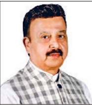
रेवाड़ी। राव नरबीर सिंह।

प्रदेश सरकार के गठन में महत्वपूर्ण भूमिका निभाने वाले दक्षिणी हरियाणा की राजनीति में विधानसभा चुनाव करीब आते ही हलचलें बढ़ने लगी हैं। चुनावों से पहले इस क्षेत्र में भाजपा में एक बार फिर टिकट को लेकर 'जंग' देखने को मिल सकती है। टिकटों की लड़ाई केंद्रीय मंत्री राव इंद्रजीत सिंह और उनके विरोधी भाजपा खेमे के बीच देखने को मिल सकती है। गत विधानसभा चुनावों में राव के 'फ्री हैंड' रहने के कारण टिकट से वंचित रहे तीन एक्स एमएल एक बार फिर अपने-अपने क्षेत्र में पकड़ बनाए रखेंगे। तीनों ही टिकट के मजबूत दावों के साथ लोगों के बीच जनसंपर्क बढ़ाने