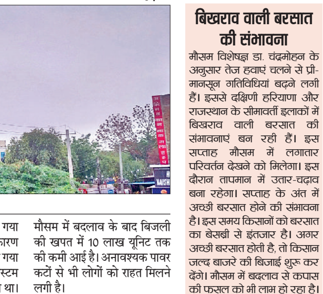
रेवाड़ी। रविवार शाम को आसमान में छाप बरसात के बादल।