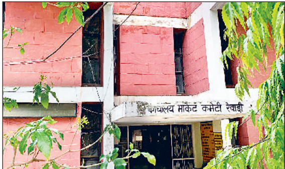
रेवाड़ी। नई अनाजमंडी स्थित मार्केट कमेटी कार्यालय।

मार्केटिंग बोर्ड की ओर से ग्रामीण क्षेत्र की 4 नई लिंक रोड का नव निर्माण किया जाएगा। इन लिंक रोड पर 1,26,29,484 करोड़ रुपये की राशि खर्च की जाएगी। गांव