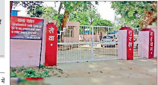
रेवाड़ी। खोल थाना परिसर तथा कोल्ड पैक स्टोर फाइल फोटो।