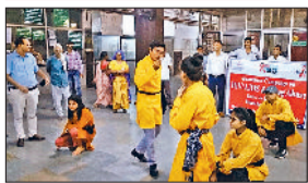
रेवाड़ी। नुककड़ नाटक का मंचन करते कलाकार।