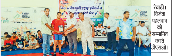
रेवाड़ी। विजेता पहलवान को सम्मानित करते डीएसओ।

दो दिवसीय प्रतियोगिता में करीब 200 पहलवानों ने लिया भाग, फ्री स्टाईल व ग्रीको रोमन कुश्ती सहित जिला कुमार व केसरी दंगल का आयोजन