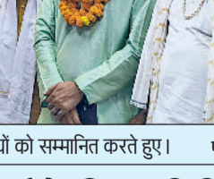
रेवाड़ी। समिति के पदाधिकारियों को सम्मानित करते हुए।

सामाजिक कार्य के लिए समिति के राष्ट्रीय अध्यक्ष हुए सम्मानित