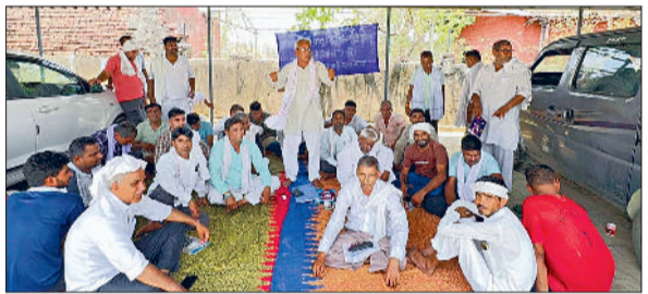
रेवाड़ी। मांगों को लेकर धरना देते यूनियन के सदस्य।