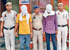
रेवाड़ी। पुलिस गिरफ्तार में आरोपी।