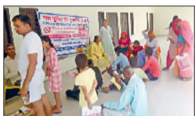
रेवाड़ी। कैप में लोगों को जानकारी देते हुए।