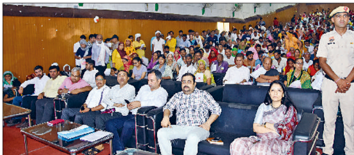
रेवाड़ी। केएलपी कॉलेज सभागार में मौजूद एडीसी व अन्य।