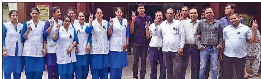
रेवाड़ी। नागरिक अस्पताल में काले बिल्ले लगाकर रोष जताते एनएचएम कर्मचारी।

नेशनल हेल्थ मिशन की ओर से सोमवार को स्वास्थ्यकर्मियों ने नियमित कराने सहित अन्य मांगों को लेकर काले बिल्ले लगाकर रोष प्रकट किया गया। एनएचएम कर्मचारियों पिछले 25 सालों से स्वास्थ्य विभाग में अपनी सेवाएं दे रहे हैं, लेकिन इनको अभी तक पक्का नहीं किया गया है। कर्मचारियों ने कहा कि अगर सरकार 7 जुलाई तक मांगों पर सकारात्मक रुख नहीं अपनाती है तो एनएचएम कर्मचारी बड़े आंदोलन