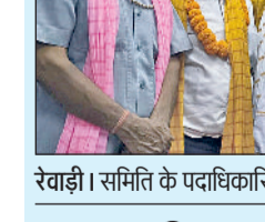
रेवाड़ी। समिति के पदाधिकारियों को सम्मानित करते हुए।

सामाजिक कार्य के लिए समिति के राष्ट्रीय अध्यक्ष हुए सम्मानित