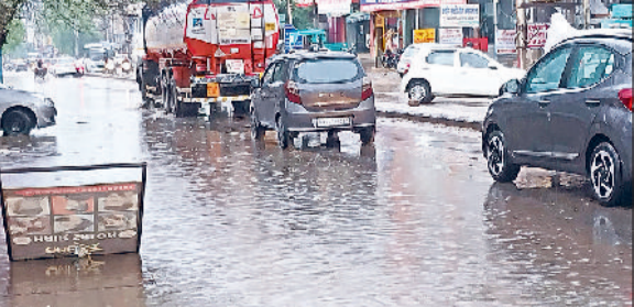
रेवाड़ी। सोमवार आई बरसात से बावल रोड पर भरा पानी। फोटो: हरिभूमि

मई माह में जहां लू के प्रकोप से जन जीवन पूरी तरह प्रभावित रहा वहीं जून माह में लोगों को उमस भरी गर्मी ने जमकर परेशान किया। चार दिन से आसमान में बादल छाने के बाद सोमवार को दोपहर बाद एक घंटे हुई झमाझम बरसात से मौसम सुहावना हो गया। बरसात से जहां लोगों को गर्मी से राहत मिली वहीं किसानों के चेहरे भी खिल उठे। मौसम विभाग की ओर से इस सप्ताह अच्छी