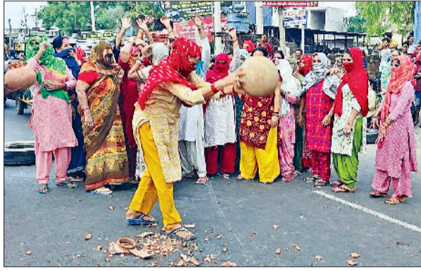
रेवाड़ी। जाम के दौरान सड़क पर खाली मटका फोड़ती महिला व पानी की समस्या को लेकर बावल रोड पर जाम के दौरान जमा लोग।

शहर में पानी का संकट बढ़ता जा रहा है। जेएलएन नहर को बंद हुए 25 दिन हो चुके हैं। जनस्वास्थ्य विभाग की ओर से लोगों को रोस्टर के हिसाब से पीने का पानी दिया जा रहा है। जनस्वास्थ्य विभाग की ओर से प्रति व्यक्ति 70 लीटर पानी रोजाना देने के दावे पूरी तरह फेल हो रहे हैं, क्योंकि शहर में काफी जगह तो पानी पहुंच ही नहीं पा रहा है। सोमवार को पानी की किल्लत से गुस्साए लोगों ने बावल रोड पर जाम लगा दिया। लोगों का कहना था कि वह करीब दो महीने से अधिक समय से पानी की समस्या से जूझ रहे हैं। करीब ढाई घंटे तक लगे जाम के दौरान बावल रोड पर दोनों तरफ वाहनों की लंबी कतार लग गई। सुबह के समय लगे जाम के कारण कंपनियों में ड्यूटी पर जाने वाले कर्मचारियों को काफी परेशानी का सामना करना पड़ा। कर्मचारियों की