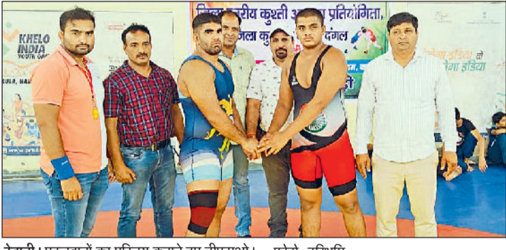
रेवाड़ी। पहलवानों का परिचय कराते हुए डीएसओ।