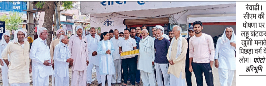
रेवाड़ी। सीएम की घोषणा पर लघु बांटकर खुशी मनाते पिछड़ा वर्ग के लोग।