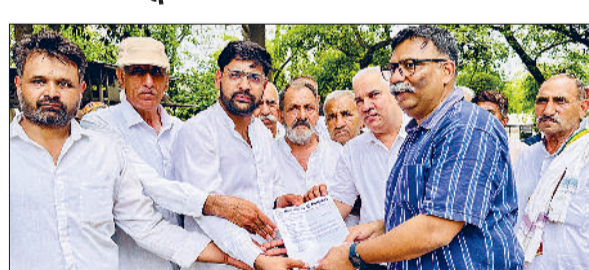
रेवाड़ी। डीडीपीओ को ज्ञापन सौंपते हुए यूथ कांग्रेस कार्यकर्ता।