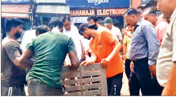
रेवाड़ी। गोकल गेट के पास मेमहोल की जाती हटाकर देखते अधिकारी, रेलवे रोड पर टूटी पड़ी जाली देखते नप अधिकारी तथा धारुहेड़ा में नालों की सफाई करते कर्मचारी।