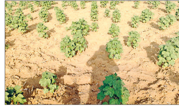
रेवाड़ी। एक खेत में ऊगी कपास की फसल तथा दोपहर बाद शहर में आई बरसात से जमा पानी।

बुधवार को सुबह के समय बादल छाते के बाद दोपहर तक आसमान साफ हो गया। कई इलाकों में हो चुकी हल्की बरसात के कारण हवा में नमी का स्तर 70 फीसदी तक पहुंच गया। लगभग 20 किलोमीटर प्रति घंटा की रफ्तार से गर्म हवाएं चलने के कारण दोपहर