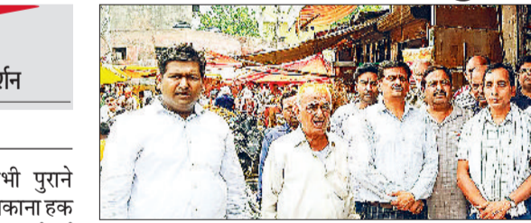
रेवाड़ी। दुकानों के मालिकाना हक की मांग करते दुकानदार।