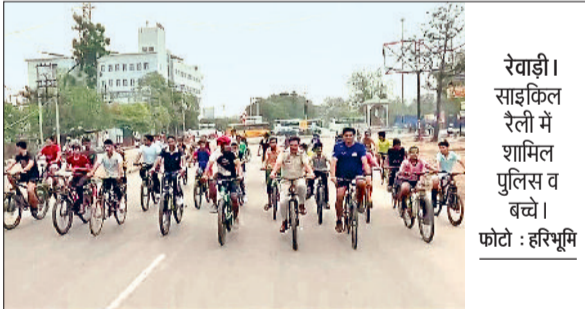
रेवाड़ी। साइकिल रैली में शामिल पुलिस व बच्चे।

कार्रवाई की जा रही है। उन्होंने कहा कि नशा करने वाले युवाओं को भी मुख्यधारा में लाने की जरूरत है। इसके लिए सभी को मिलकर प्रयास करना चाहिए। साइकिल रैली रात तुलाराम स्टेडियम से शुरू होकर पोसवाल चौक, राजेश पायलट चौक, आईओसी चौक, राजीव चौक व सेक्टर-3 होते हुए वापस रात तुलाराम स्टेडियम में संपन्न हुई।