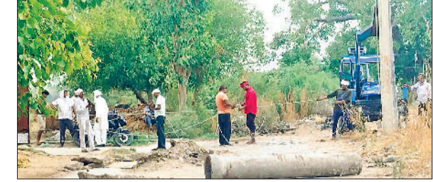
रेवाड़ी। पोल व तार टूटने के बाद लाइन ठीक करते निगम कर्मचारी।