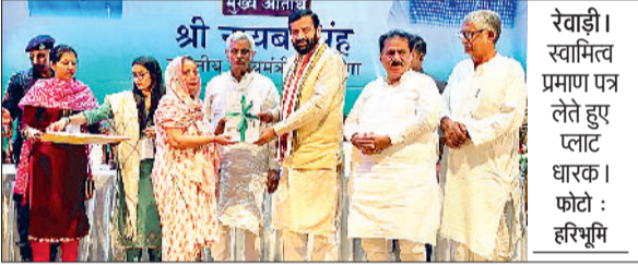
रेवाड़ी। स्वामित्व प्रमाण पत्र लेते हुए धारक।