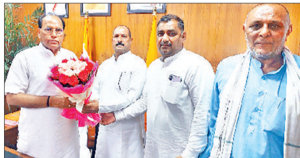
रेवाड़ी। डा. बनवारीलाल से मुलाकात करने पहुंचे एम्स निर्माण समिति के पदाधिकारी।

कैबिनेट मंत्री डा. बनवारीलाल ने दिए डीसी को निर्देश नरेन्द्र वत्स >>> रेवाड़ी