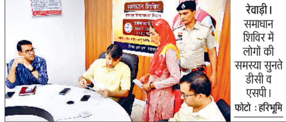
रेवाड़ी। समाधान शिविर में लोगों की समस्या सुनते डीसी व एएसपी।

विधायक ने कहा कि शहर के सेक्टर-19 में कोई विकास कार्य नहीं हो पाए हैं। यहां की सड़कें टूटी हुई हैं। पार्क बंदहाल अवस्था में है। सड़कों पर कोई सांकेतिक बोर्ड नहीं है। प्रवेश द्वार नहीं है। कचरा उठाने की कोई व्यवस्था नहीं है। गंदगी के ढेर लगे रहते हैं। सीवर का पानी निकालने की कोई व्यवस्था नहीं है। बुनियादी सुविधाओं के अभाव में सेक्टर-19 के लोगों को जीवन यापन करना पड़ रहा है।