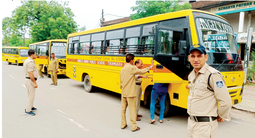
प्रदूषण चेक किए, कमी पाए गए बसों पर पांच हजार रुपए की