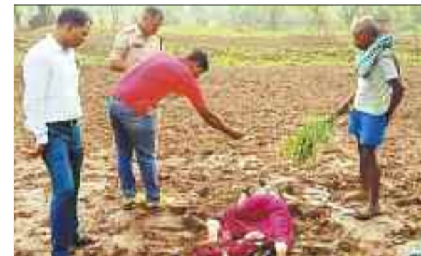
घटनास्थल पर जांच करती पुलिस की टीम।