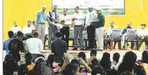
विदाई कार्यक्रम में उपस्थित अधिकारी।