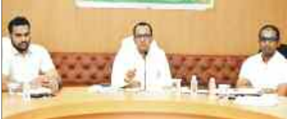
बैठक लेते कलेक्टर।

कलेक्टोरेट सभाकक्ष में मानव-हाथी द्वन्द रोकने हेतु गठित जिला स्तरीय समिति की बैठक आयोजित की गई। उन्होंने जिले के वनांचल क्षेत्रों में हाथी-मानव द्वंद