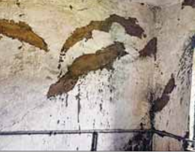
हरिभूमि न्यूज डिंडोरी।

डिंडोरी जिले में शिक्षा और शिक्षा व्यवस्था की लचर स्थित सार्वजनिक है जिसमें शासकीय स्कूलों में प्राथमिक और माध्यमिक विद्यालय के भवन खंडहर में तब्दील हो ही चुके हैं। आंकड़े बताते हैं कि जिले के 620 सरकारी स्कूल के भवनों की हालत जर्जर है जिसमें से 500 के लगभग प्राथमिक शाला के भवन हैं तो 112 माध्यमिक विद्यालय के भवनों की स्थिति जर्जर हो चुकी है। जिसके चलते जिले के नौनिहाल शिक्षा के साथ साथ खेलकूद, और अन्य सुविधाओं से वंचित हैं। इतना ही नहीं पिछले दो वित्तीय वर्ष में 100