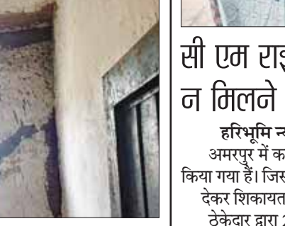
हरिभूमि न्यूज डिंडोरी।

हम बात कर रहे हैं जनपद पंचायत करंजिया अंतर्गत एकीकृत शासकीय उच्चतर माध्यमिक विद्यालय इनकी की जहां पिछले दो सालों से 20लाख के लागत से मरम्मत कार्य किया गया, जहां टेंडर प्रक्रिया के बाद मरम्मत का कार्य किया जाना था पर मनमानी का आलम यह रहा कि मरम्मत के नाम पर शौचालय और प्रसाधन तक को अधूरा छोड़ दिया गया, अधिकारियों की सलिपता और संरक्षण के चलते खिड़कियां तक नहीं बदलीं गई जिसका परिणाम यह हुआ कि टूटी हुई खिड़कियां विद्यालय की बदहाल स्थिति को घटिया रखी है। जहां पहले मरम्मत कार्य हुआ था हर कमरे का छज्जा गिर रहा है। यदि विद्यालय