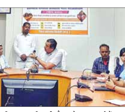
हरिभूमि न्यूज डिंडोरी।