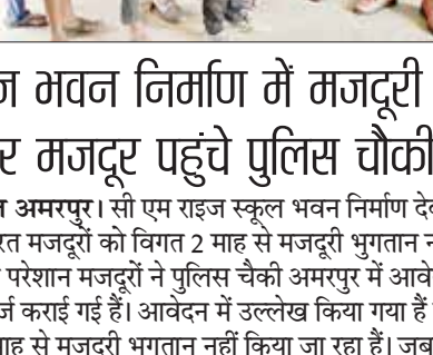
हरिभूमि न्यूज डिंडोरी।

संचालन और शैक्षणिक कार्य के दौरान पढ़ने वाले बच्चों पर छज्जा गिरता है तो इसका जिम्मेदार कौन होगा? स्कूलों के जर्जर हॉल की तस्वीर आदिवासी क्षेत्र के नर्मदा टोला में भी दिखाई देती है। जहां तीन प्राथमिक शाला भवन हैं और तीनों भवन खंडहर में तब्दील हो चुके हैं जो किसी भी वक्त धराशाही हो सकते हैं। बच्चों के स्कूल के लिए पूर्व सरपंच के घर एक कमरा दे दिया जिसमें एक ही कमरे में पहली से पांचवी तक के बच्चे पढ़ाई करते हैं, अधिकारियों को पूरी स्थिति की खबर तो है पर बदहाल स्थिति पर सिर्फ नजरंदाज कर बच्चों के भविष्य से खिलवाड़ किया जा रहा है।