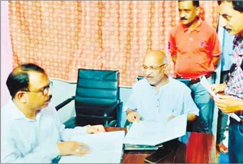
हरिभूमि न्यूज डिंडोरी। निरीक्षण के दौरान जिला शिक्षा अधिकारी सहित 22 अधिकारी कर्मचारी मौके पर नहीं मिले, जहाँ एसडीएम ने कलेक्टर को एक दिवस का वेतन कटौती का प्रतिवेदन भेज दिया। गौरतलब है कि मध्य प्रदेश शासन ने शासकीय कार्यालयों में अधिकारियों-कर्मचारियों को सुबह 10 बजे तक उपस्थित होने के निर्देश जारी किए थे। इसके बाद भी अधिकारी-कर्मचारी समय पर कार्यालय नहीं आ पा रहे हैं। एसडीएम ने समय पर न आने वाले अधिकारी

समय पर दफ्तर पहुँच जाओ, वरना एसडीएम साहब आ जाएँगे कुछ ऐसा ही मामला कल देखने को मिला, जहाँ एसडीएम ने मंगलवार को सर्व शिक्षा अभियान विभाग, नगर परिषद, जनपद पंचायत और जिला शिक्षा अधिकारी कार्यालय का निरीक्षण किया।