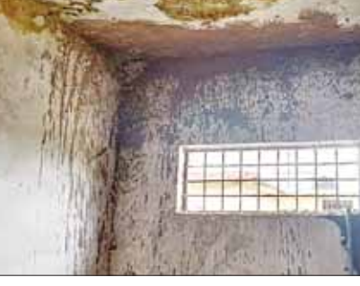
हरिभूमि न्यूज डिंडोरी।

से अधिक माध्यमिक और उच्चतर माध्यमिक विद्यालय के मरम्मत के कार्य जिले में कराए गए हैं पर मरम्मत के नाम पर मुख्य अधिकारियों के संरक्षण के चलते क्षेत्र के अनेक विद्यालयों जिनमें लगभग 20 लाख रूपये से अधिक की लागत से मरम्मत के कार्य किए गए थे वे अब खंडहरों में तब्दील हो रहे हैं। वास्तविकता यह है कि जिले में शिक्षा विभाग को ग्रहण लगा हुआ है जिसके ग्रहण के कारण ही शिक्षा व्यवस्था की लचर प्रणाली और मरम्मत कार्य में भ्रष्टाचार और कमीशनखोरी के चलते आधे अधूरे और घटिया सामग्री के मरम्मत के बाद भी मरम्मत कार्य की राशियों का बंदरबांट किया गया है।