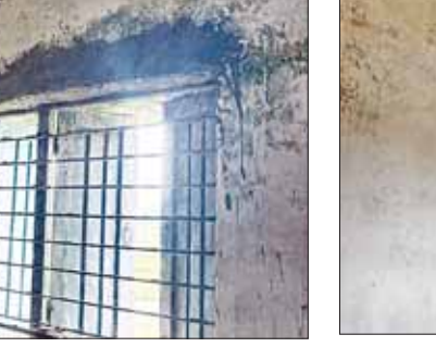
हरिभूमि न्यूज डिंडोरी।

डिंडोरी जिले में शिक्षा और शिक्षा व्यवस्था की लचर स्थित सार्वजनिक है जिसमें शासकीय स्कूलों में प्राथमिक और माध्यमिक विद्यालय के भवन खंडहर में तब्दील हो ही चुके हैं। आंकड़े बताते हैं कि जिले के 620 सरकारी स्कूल के भवनों की हालत जर्जर है जिसमें से 500 के लगभग प्राथमिक शाला के भवन हैं तो 112 माध्यमिक विद्यालय के भवनों की स्थिति जर्जर हो चुकी है। जिसके चलते जिले के नौनिहाल शिक्षा के साथ साथ खेलकूद, और अन्य सुविधाओं से वंचित हैं। इतना ही नहीं पिछले दो वित्तीय वर्ष में 100