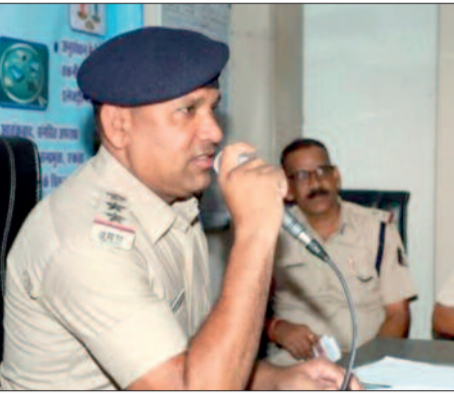
हरिभूमि न्यूज >>> सरायपाली

सिंघोड़ा थाना ने भारत सरकार द्वारा लागू नए कानूनों की जानकारी विभिन्न जनप्रतिनिधियों व ग्रामीणजनों तक पहुंच सके व इनकी जानकारी सभी को हो सके, इसके लिए थाना परिसर में ही पहली बार 150 से भी अधिक विभिन्न जनप्रतिनिधि व ग्रामीणजनों ने पहुंचकर नए