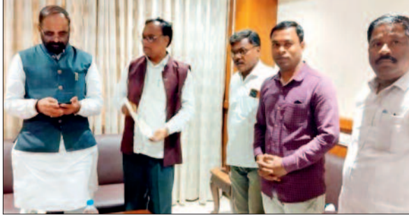
सरायपाली

अटल नगर नवा रायपुर सर्किट हाउस में राष्ट्रीय अध्यक्ष पिछड़ा वर्ग आयोग नई दिल्ली हेमराज गंगाधर अहिर से मुलाकात कर पिछड़े वर्ग के समुचित विकास के लिए उच्च शिक्षा को बढ़ावा देने के लिए प्रत्येक जिले में पोस्ट मैट्रिक कन्या, बालक छात्रावास के लिए मांग पत्र सौंपा गया। पिछड़े वर्ग के विद्यार्थियों को दी जाने वाली छात्रवृत्ति अपर्याप्त है, उसे बढ़ाने के लिए निवेदन किया गया।