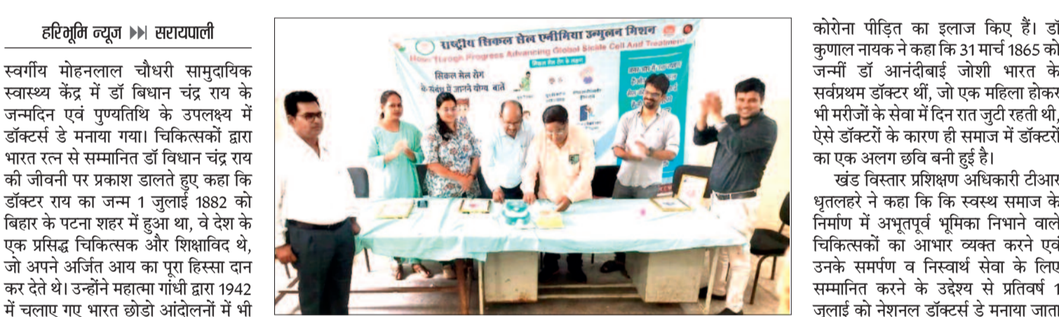
हरिभूमि न्यूज ►► सरायपाली