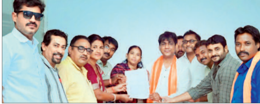
हरिभूमि न्यूज ►► महासमुंद