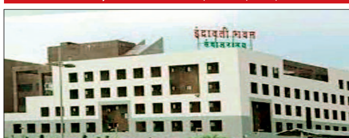
पत्र में ये लिखा है महालेखाकार ने

महालेखाकार छत्तीसगढ़ द्वारा नगरीय प्रशासन एवं विकास विभाग को भेजे गए पत्र में कहा गया है कि नगर निगम कोरबा को 5.33 करोड़ रुपए जमा नहीं करने पर भी वसूली के लिए आवश्यक कार्रवाई नहीं की जा रही है। विषय से संबंधित तथ्यात्मक विवरण देते हुए कहा गया है कि ये तथ्यात्मक विवरण संबंधित कार्यालयों एवं उच्च अधिकारियों द्वारा निरीक्षण के समय अथवा बाद के पत्राचार में उठाई गई आपत्तियों के जवाब में दी गई जानकारी के आधार पर संकलित किए गए हैं। महालेखाकार ने कहा है कि तथ्यात्मक विवरण में तथ्यों को सत्यापित करें और पत्र प्राप्त होने के छह सप्ताह के भीतर अपनी टिप्पणियां, यदि कोई हों, इस कार्यालय को भेजें। यदि छह सप्ताह की अवधि में कोई उत्तर प्राप्त नहीं होता है तो यह समझा जायेगा कि विभाग द्वारा उपरोक्त तथ्य स्वीकार कर लिये गये हैं।