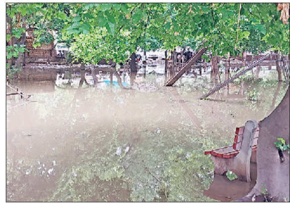
रेवाड़ी। बरसात के पानी से जलमग्न ब्रास मार्केट