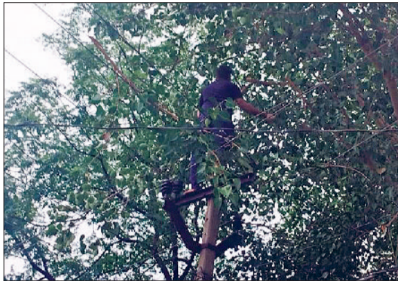
रेवाड़ी। बिजली की तारों में फंसी टहनियां काटते बिजली कर्मचारी।

मानसून की पहली अच्छी बरसात ने बिजली निगम कर्मचारियों की खामियां उनके सामने उजागर कर दीं। नतीजा यह रहा कि रविवार की रात अच्छी बरसात होने के बाद बिजली की लाइनों में उलझी पेड़ों की टहनियों के कारण जिले भर में एक के बाद एक लगभग 20 फीडरों की लाइनों में फाल्ट आ गया। इससे कई गांवों के बिजली उपभोक्ताओं को अंधेरे में रात बितानी पड़ी। निगम के कर्मचारी रात को ही लाइनों को ठीक करने में जुटे रहे। सोमवार को कई लाइनों में फंस पेड़ों की टहनियों को काटा गया। मानसून से पहले निगम कर्मचारियों को बिजली लाइनों की पेट्रोलिंग करने के बाद उनमें फंसों की टहनियों को काटनी होती है। कई सब डिवीजन