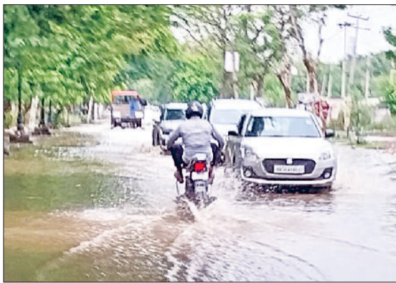
रेवाड़ी। अनाजमंडी से हाउसिंग बोर्ड मार्ग पर जमा पानी।

आसमान साफ होते ही उमस ने किया परेशान सोमवार सुबह आसमान साफ