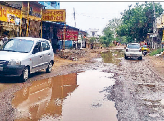
सीहा-धवाना सड़क मार्ग की जर्जर हालत से ग्रामीण परेशान

अच्छी बरसात के बाद तापमान में कमी और कई फीडरों के बंद रहने से बिजली की खपत में काफी कमी आई है। लगभग 85 लाख यूनिट से कम होकर रविवार शाम तक बिजली की खपत 60 लाख यूनिट पर आ गई थी। बरसात के बाद कृषि क्षेत्र में बिजली की मांग कम हो गई है। मौसम में बदलाव के बाद बिजली निगम के अधिकारियों और कर्मचारियों को ओवरलोडिंग की समस्या से काफी हद तक छुटकारा मिल चुका है। मांग कम होने के कारण पावर कटों का इंडिस्ट्री भी लगभग खत्म हो गया है।