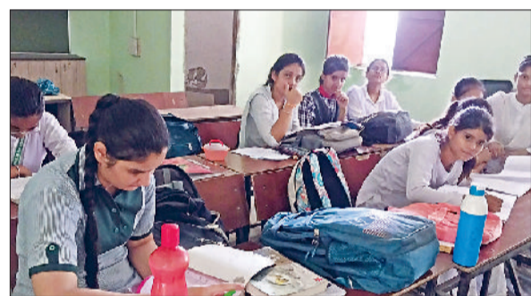
रेवाड़ी। राजकीय कन्या स्कूल में कक्षा में मौजूद छात्राएं।

एक माह का ग्रीष्मकालीन अवकाश समाप्त होने के बाद सोमवार को जिले के सरकारी व प्राइवेट स्कूल खुल गए। गर्मी की छुट्टी खत्म होने के बाद एक तरफ जहां स्कूलों में रौनक लौट आई है, वहीं बच्चों में उत्साह भी देखने को मिला, हालांकि पहले दिन स्कूल में बच्चों की संख्या कम रही, लेकिन सप्ताह भर में सभी बच्चे स्कूल आने लगे। ग्रीष्मकालीन अवकाश के समाप्त होने से एक दिन पहले सभी सरकारी स्कूलों में सफाई, बिजली