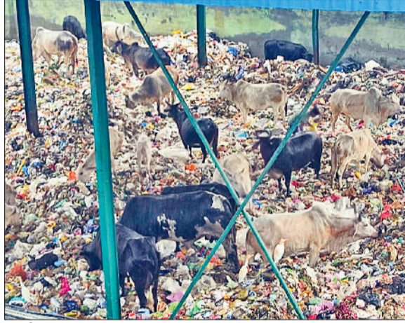
रेवाड़ी। एमआरएफ सेंटर में कचरे में लगे हुए गोवंश व मॉडल टाउन में घूमते गोवंश।

नगर परिषद का शहर को कैटल फ्री बनाने का दावा एक बार फिर फेल हो चुका है। नगर परिषद की ओर से प्रति वर्ष सड़कों पर घूमते गोवंश को पकड़ने के लिए एजेसी को लाखों रुपये ठेका दिया जाता है, लेकिन सड़कों पर घूमते गोवंश की समस्या खत्म होने का नाम नहीं ले रही है। एजेसी की ओर से सड़कों पर घूमते सभी गोवंश को पकड़ा नहीं जाता है और जो गोवंश पकड़े जाते हैं उनको पशु मालिक जुर्माना भरकर छोड़ा जाता है और फिर से सड़कों पर छोड़कर लोगों के लिए परेशानी पैदा करते हैं। प्रति वर्ष सड़कों पर गोवंश की संख्या बढ़ती ही जा रही है। इन गोवंश में सांडों की संख्या भी काफी अधिक हो गई है। यह सांड आपस में लड़ाई करके यातायात बाधित करने के साथ हादसे का कारण भी बनते हैं। पिछले एक वर्ष में सड़कों पर घूमते गोवंश दर्जनों लोगों को घायल चुके हैं। सड़कों पर घूमने वाले ज्योतितर पशु पालतू है, जिनको पशु मालिक दुध्योहने के बाद सड़कों पर छोड़ देते हैं। नगर परिषद की ओर से