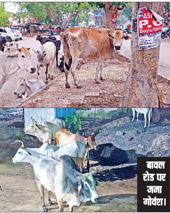
बावल रोड पर जमा गोवंश।

पशुपालकों से सड़कों पर अपने पशुओं को खुले में न छोड़ने का आग्रह करते हैं, जिसके बाद एजेसी की ओर से गोवंश पकड़े जाते हैं और फिर सड़कों पर आ जाते हैं। अधिकारियों की ओर से कोई ठोस कार्रवाई नहीं की जाती है, जिसका खामियाजा सड़कों से गुजरने वाले लोगों को भुगतना पड़ता है।