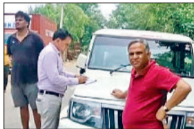
रेवाड़ी। बिजली चोरों के खिलाफ कार्रवाई करते निगम अधिकारी।