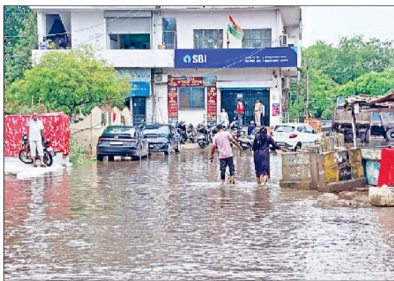
रेवाड़ी। एसबीआई बैंक के आगे जमा पानी में से जाते लोग।

शहर में एक बार फिर अच्छी बरसात के बाद पानी ही पानी हो गया, जिससे लोगों को भारी परेशानी का सामना करना पड़ा। मौसम विभाग की ओर से अभी भी बारिश का ऑरेंज अलर्ट जारी किया गया है। रविवार शाम के समय ही ग्रामीण क्षेत्रों में तेज हवाओं के साथ अच्छी बरसात शुरू हो गई थी। बरसात का सिलसिला आधी रात के बाद तक चलता रहा। इस दौरान कहीं हल्की, तो कहीं तेज बरसात हुई। शहर में औसत 48