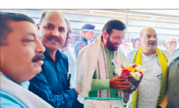
रेवाड़ी। मुख्यमंत्री का आभार जताते हुए हरियाणा सामाजिक न्याय मंच के प्रतिनिधि।