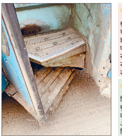
रेवाड़ी। डिपो में चल रही लीज की बस का टूटा हुआ पायदान।