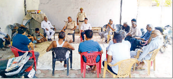
रेवाड़ी। लोगों को नए कानूनों की जानकारी देते हुए पुलिसकर्मी।

इसके बावजूद आईपीसी को दर्ज करने में आईओ अनुभव के थुलाकर नए कानून के तहत केस साथ ही दक्ष हो सकेंगे।