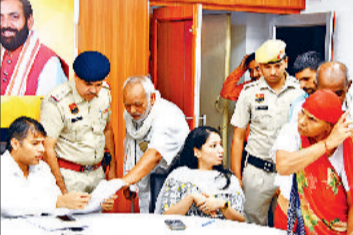
रेवाड़ी। शिविर में लोगों की समस्या सुनते हुए डीसी व एडीसी।

हरियाणा सरकार की ओर से समाधान प्रकोष्ठ का भी गठन किया गया है, जिसका उद्देश्य शिकायत निवारण प्रक्रिया को व्यवस्थित करना और लोगों की समस्याओं का त्वरित समाधान करना है। डीसी ने जिले के नागरिकों से अपनी समस्याओं के समाधान के लिए समाधान शिविर में आने का आह्वान किया है। उन्होंने कहा कि परिवार पहचान पत्र, राशन कार्ड, विभिन्न कल्याणकारी योजनाओं,