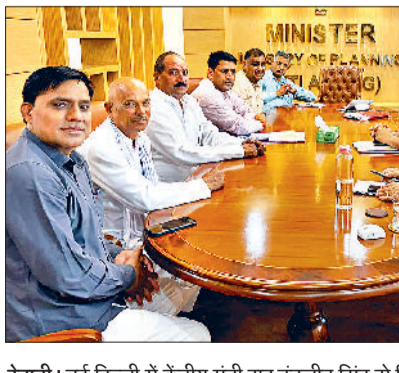
रेवाड़ी। नई दिल्ली में केंद्रीय मंत्री राव इंद्रजीत सिंह से मिलते एम्स समिति के पदाधिकारी।