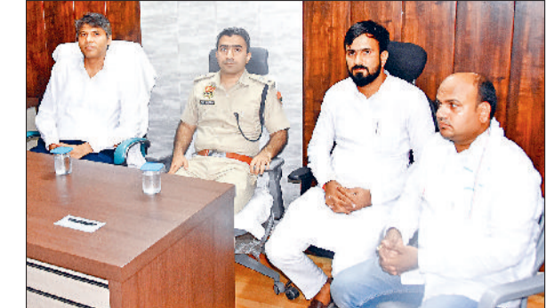
रेवाड़ी। डीसी व एसपी के साथ सरपंच।