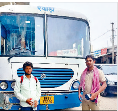
रेवाड़ी। डिपो में चल रही लीज की बस का टूटा हुआ पायदान।