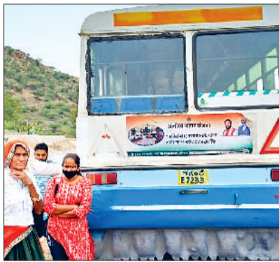
रेवाड़ी। कसोला चौक के पास डीजल खत्म होने के बाद खड़ी बस व गुरुग्राम से राजीव चौक पर खराब लीज की बस व खड़े यात्री और मानेसर के पास डीजल खत्म होने के बाद सड़क किराने खड़ी बस।

बीते सोमवार से लेकर बुधवार तक दिल्ली और जयपुर की ओर आने वाली लीज की कई बसें रास्ते में बंद हो गईं। बुधवार को दिल्ली की ओर जाने वाली एक बस गुरुग्राम के पंचगांव और मानेसर के पास डीजल खत्म होने के कारण बंद हो गई। एक बस जयपुर की ओर से आते समय शाहजहांपुर के पास डीजल खत्म होने के बाद बंद हो गई। इन बसें के रास्ते में ब्रेकडाउन होने के बाद एक ओर जहां यात्रियों को भारी परेशानी का सामना करना पड़ता है, तो दूसरी ओर परिचालकों को दूसरी बसें में यात्री बैठाने के लिए काफी मान-मनोबल करनी पड़ रही है। दूसरे राज्यों और डिपो की बसें में ब्रेकडाउन बसें के यात्रियों को अपनी बसें में बैठाना तक बंद कर दिया है। इसका कारण लीज की बसें का आए दिन लंबे रूटों पर खराब होना या डीजल खत्म होना है। कभी-कभार बस ब्रेकडाउन होने पर उनके यात्रियों को दूसरी बार बैठा लिया जाता है, लेकिन इस डिपो में चल रही लीज