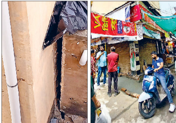
रेवाड़ी। पंजाबी मार्केट में दुकान के झुकने से आई दरार तथा दुकान के पास टीक की गई जमीन व मौजूद ईंजें।

शहर के भीड़भाड़ भरे पंजाबी मार्केट में दो मंजिला भवन जगह छोड़कर अपनी जगह से खिसक गया है। दुकान के खिसकने से आसपास के दुकानदारों में दहशत का माहौल पैदा हो गया है। मार्केट की सक्की गली होने पर भवन के गिरने से कभी भी बड़ा हादसा हो सकता है। बिल्डिंग के एक तरफ झुकने से साइड में 4 से 5 इंच की दरार आ गई है। बिल्डिंग में करीब चार दुकानें चल रही हैं। दुकानदार की ओर से प्रशासन को सूचना दे