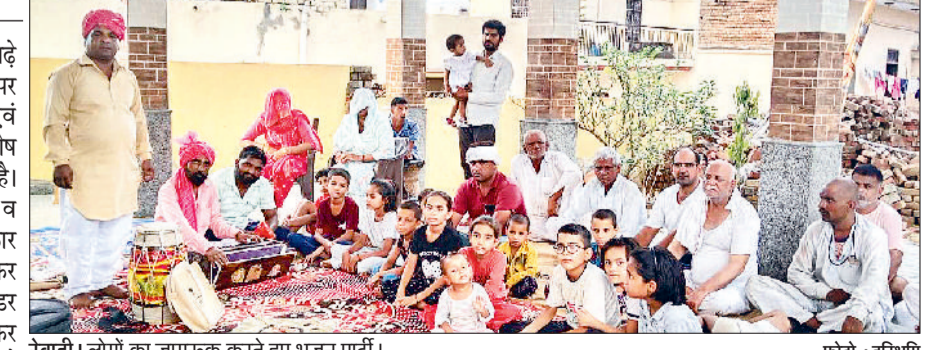
रेवाड़ी। लोगों का जागरूक करते हुए भजन पार्टी। भावना से कार्य किया है ताकि अंतिम पंक्ति में खड़े व्यक्ति तक योजनाओं का लाभ मिल सके। भजन पार्टी कलाकार भजनों एवं गीतों के माध्यम से ग्रामीणों का जानकारी दे रहे हैं। भजन पार्टी ने बुधवार को गांव मोहनपुर, घुड़कावास, बच्चा, करावा मानकपुर, हरजीपुर व साल्हावास में आमजन को सरकार

हरियाणा सरकार के सफलतम साढ़े चार वर्ष का कार्यकाल पूरा होने पर सूचना, जनसंपर्क, भाषा एवं संस्कृति विभाग की ओर से विशेष प्रचार अभियान चलाया जा रहा है। विभागीय भजन पार्टी गांव-गांव व शहर में आमजन को सरकार योजनाओं को लेकर जागरूक कर रही है। विभाग के भजन पार्टी लीडर व कलाकारों ने गांवों में पहुंचकर बताया कि मुख्यमंत्री नायब सिंह के नेतृत्व में प्रदेश निरंतर विकास के पथ पर अग्रसर है। हरियाणा सरकार की ओर से प्रदेशभर में अंत्योदय की