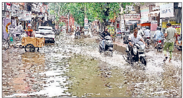
रेवाड़ी। बुधवार को आई बरसात से भाड़ावास गेट के पास जमा पानी तथा महाराणा प्रताप चौक से अनाजमंडी रोड पर जमा बरसाती पानी।

तीन दिन से भारी गर्मी और उमस का सामना कर रहे लोगों को आश्चर्यकर कुछ हद तक राहत मिल गई। जिले में झमाझम बारिश ने मौसम कूल-कूल बना दिया, जिससे लोगों को उमस भरी गर्मी से फिलहाल छुटकारा मिल गया। अगले तीन-चार दिनों तक रुक-रुककर हल्की, मध्यम या तेज बरसात होने की संभावना है। इस दौरान तापमान में गिरावट दर्ज की जा सकती है। बरसात के बाद शहर एक बार फिर जलमय हो गया। किसानों को बरसात से अच्छी राहत मिली है। बुधवार को सुबह से ही आसमान में बादल छाए रहे। हवा में नमी का स्तर