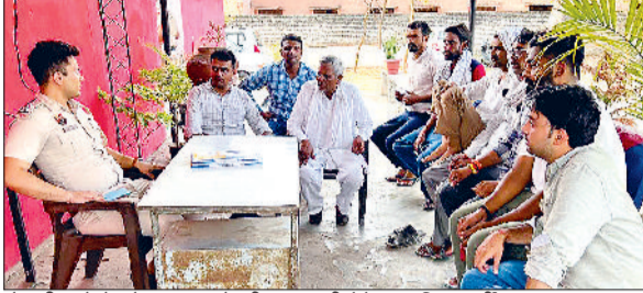
रेवाड़ी। लोगों को नए कानूनों की जानकारी देते हुए पुलिसकर्मी।

कानून में बदलाव के बाद नए कानूनों के तहत गिरफ्तारियों का सिलसिला भी शुरू हो गया है। बीएनएस और बीएनएसएस के तहत दो आरोपियों को गिरफ्तार किया गया है। दो दिन एफआईआर दर्ज करने की गति धीमी रहने के बाद नए कानूनों के तहत एफआईआर दर्ज करने की प्रक्रिया में तेजी आना शुरू हो गया है। पहले दो दिन में जहां नए कानून के तहत 6 एफआईआर दर्ज हुई थीं, वहीं तीसरे दिन 7 एफआईआर दर्ज की गई हैं। आईपीसी की जगह बीएनएस और सीआरपीसी की जगह बीएनएसएस कानून लागू हो चुके हैं। जांच अधिकारियों को नए कानूनों के तहत केस दर्ज करने के लिए विभाग की ओर से मास्टर ट्रेनर प्रशिक्षण दे चुके हैं।