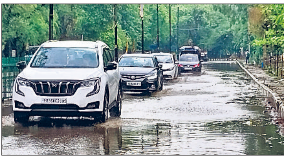
रेवाड़ी। बुधवार को आई बरसात से भाड़ावास गेट के पास जमा पानी तथा महाराणा प्रताप चौक से अनाजमंडी रोड पर जमा बरसाती पानी।

और गर्मी ने लोगों को काफी परेशान किया। दोपहर बाद बादल गहरा गए। इसके बाद झमाझम बरसात शुरू हो गई। लगभग 20 मिनट तक शहर में तेज बरसात होने के बाद बौछारें शुरू हो गईं। ग्रामीणों इलाकों में भी शाम के समय कहीं हल्की, तो कहीं मध्यम बरसात हुई। शहर में औसत 8 एमए बरसात दर्ज की गई। बरसात के बाद