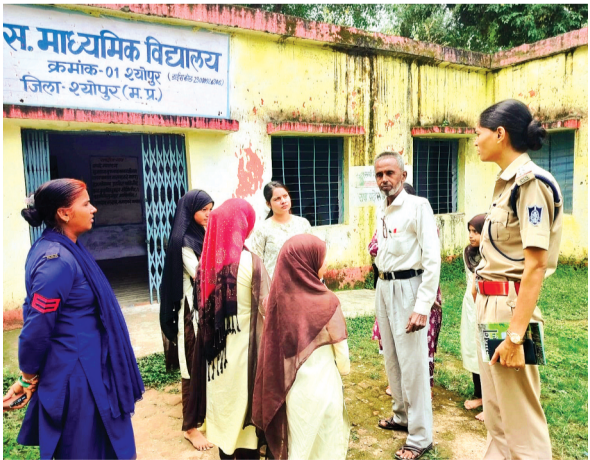
निर्माया टीम की सक्रियता से भी बेकार हुई शिकायत पेटी

स्कूलों में विद्यार्थियों व अभिभावकों को स्कूलों में शैक्षणिक व प्रबंधन के संबंध में शिकायत व सुझाव देने के साथ विद्यार्थियों के साथ चार दिवारी के बीच होने वाली टॉचर रोकने की व्यवस्था है। इसके लिए स्कूलों में प्राचार्य कक्ष व स्टाफ कक्ष के बाहर शिकायत पेटी व सुझाव बाक्स लगाए हैं। पर जिले के अधिकतर स्कूलों में अब यह व्यवस्था धराशायी होती दिखाई पड़ रही है। कहीं पेटी लटकी दिखाई नहीं दे रही है तो कहीं पेटी का ताला ही नहीं खुल रहा है। स्कूलों में शिकायत एवं सुझाव पेटियां लगाई गई हैं लेकिन इसमें कभी कोई शिकायत व सुझाव नहीं आते हैं। कई स्कूलों में तो पेटियां टूट कर गायब हो चुकी हैं। इस मामले में स्कूल प्रबंधन का तर्क है कि बच्चों की इसकी आदत नहीं है वह यह समझ नहीं पा रहे हैं कि शिकायत व सुझाव लिखकर शिकायत पेटी में कैसे डालें पेटी में शिकायत पत्र डालने के बजाए विद्यार्थी सामान्य तौर सीधे ही शिक्षकों से शिकायत करतें हैं,