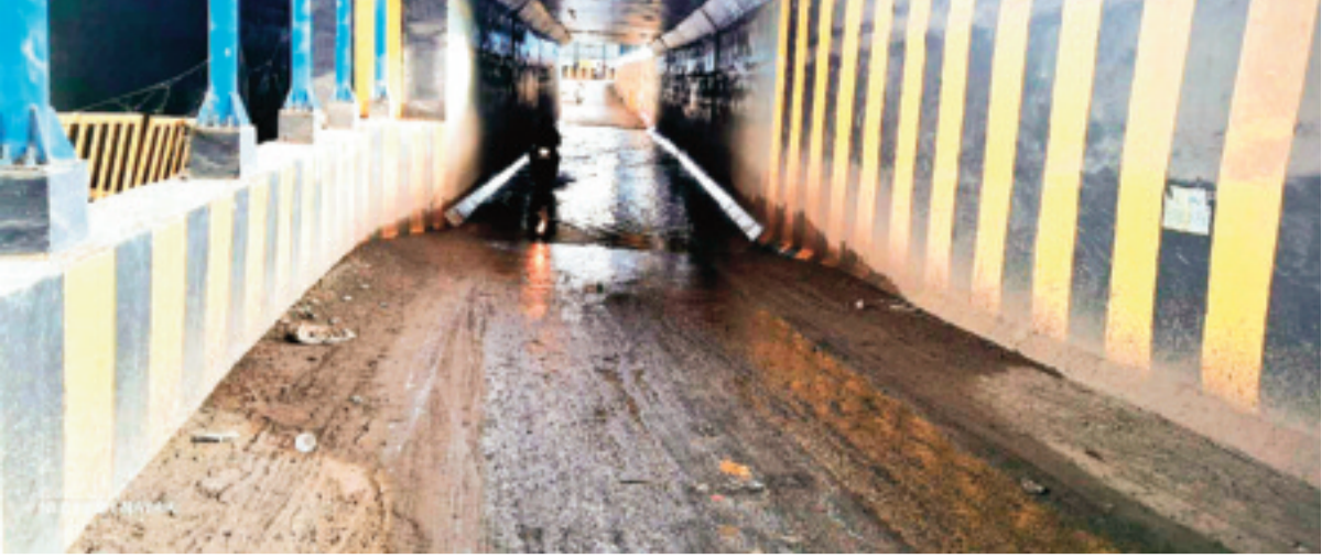
गंजबासौदा। हरदुखेड़ी अंडर बायपास में बारिश निकल जाने के बाद भी पानी भरा हुआ है। जल निकासी की उचित व्यवस्था न होने से वाहन चालकों को परेशानी का सामना करना पड़ रहा है। सर्वाधिक परेशानी रात्रि के समय निकलने वाले दो पहिये वाहन चालकों को उठाना पड़ती है। कई बार दो पहिये वाहन चालक फिसल कर घायल हो चुके हैं।