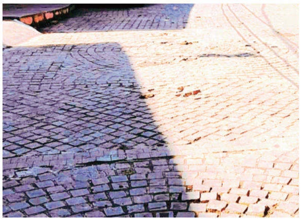
नहीं किया गया। जिसके कारण बारिश निकलते ही कोबल का उखड़ना शुरू हो गया है। रहवासियों ने संबंधित ठेकेदार से कोबल को पुनः सही ढंग से मरम्मत किए जाने की मांग की है।

उदयपुर स्थित नीलकण्ठेश्वर महादेव मंदिर पहुंच मार्ग पर कुछ माह पहले ही लाखों रूपए की लागत से कोबल लगाए गए थे। मार्ग निर्माण के दौरान भी यहां के रहवासियों ने संबंधित ठेकेदार द्वारा गुणवत्तापूर्ण सामग्री का उपयोग न करने का आरोप लगाया था। जिसके बाद कुछ दिनों तक निर्माण कार्य बंद भी रहा था। लेकिन कुछ दिनों बाद संबंधित ठेकेदार द्वारा पुनः पहुंच मार्ग का निर्माण कार्य शुरू कर दिया था। यहां के रहवासियों ने बताया कि पहुंच मार्ग के निर्माण में कोबल को चिपकाने के लिए गुणवत्ता पूर्ण सामग्री का उपयोग