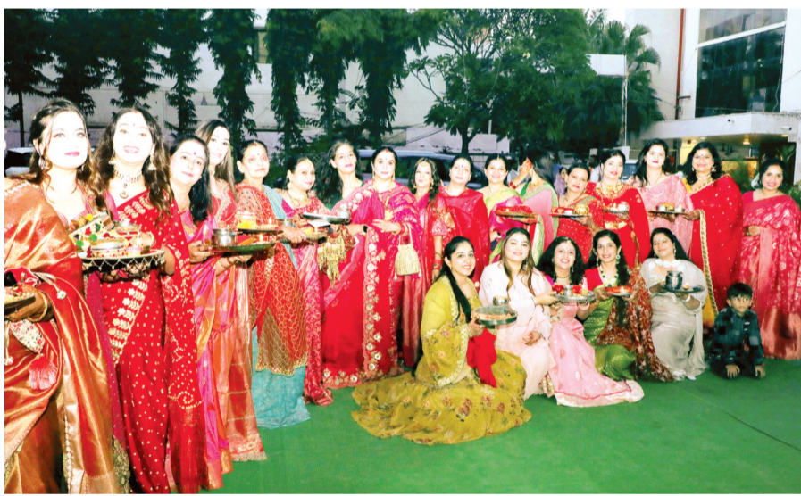
सागर। होटल वरदान सिविल लाइन में सामूहिक करवा चौथ की पूजा करती महिलाएं। सामूहिक करवा चौथ का यह है 48 व वर्ष है।