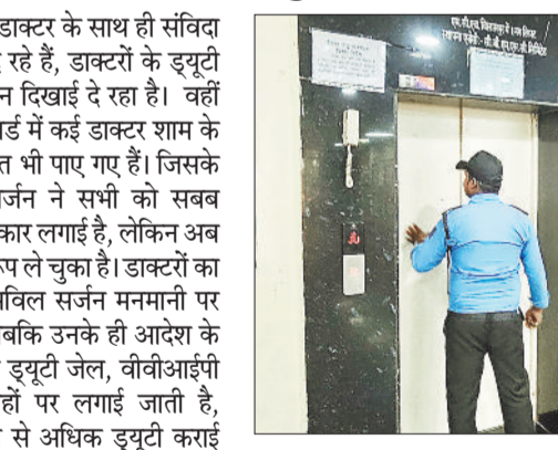
लिफ्ट में बंद जिला अस्पताल के मातृ एवं शिशु अस्पताल की लिफ्ट कई महीनों से बंद है, अब तक एक ही लिफ्ट से काम चलाया जा रहा था, लेकिन शनिवार से यह भी बंद है।

बिलासपुर। जिला अस्पताल में समय पर उपस्थित नहीं होने वाले डाक्टरों को फटकारते हुए सिविल सर्जन ने रवैया चौक के बाइपास रोड पर, शिव टाकी रोड, सीएमडी कॉलेज चौक, अग्रसेन चौक जाने वाले वाहन चालक अक्सर परेशान रहते हैं। वहीं इमलीपारा रोड पर निर्माण कार्य होने के कारण स्थिति और भी गंभीर हो जाती है। करबला रोड व तेलीपारा रोड पर दर्जनों की संख्या में फल दुकान देखे जा सकते हैं। हालांकि ट्रैफिक पुलिस समय-समय पर चलाने कार्रवाई करती है। इसके बाद भी लोगों को जाम से राहत नहीं मिल पा रही है। वाहन चालक आए दिन जाम में फंसने को मजबूर है।