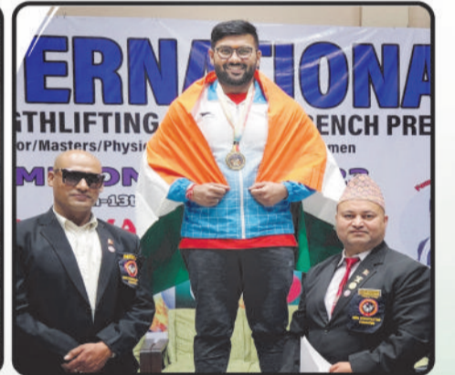
1 Gold Medal In International Strength Lifting & Incline Bench press Championship 2023 Held in Nepal