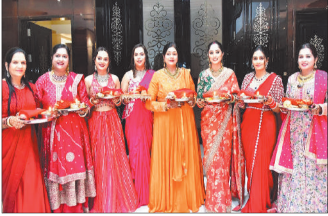
पति की लंबी आयु के लिए महिलाओं ने निर्जला व्रत रखा।