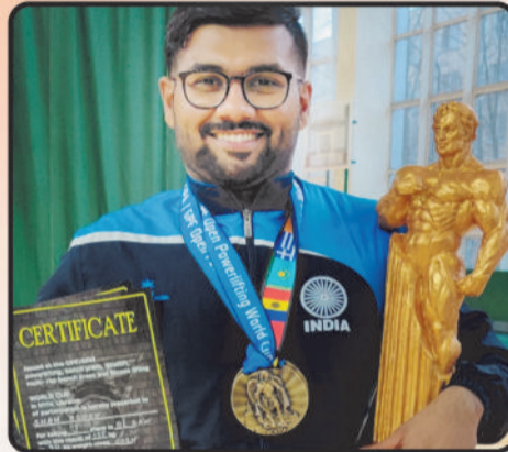
2 Gold Medals Global Power Alliance Power Lifting EUROASIA Championship 2020 Held in Ukraine