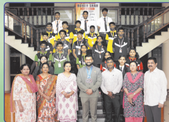
VICTORY CELEBRATIONS AT THE JAIN INTERNATIONAL SCHOOL, BILASPUR