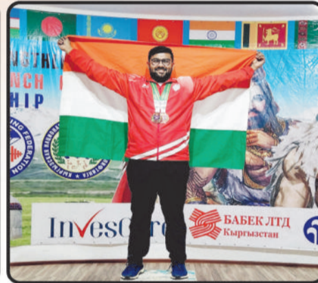
2 Bronze Medals In 9th World Strength Lifting & Incline Bench press Championship 2022 Held in Kyrgyzstan