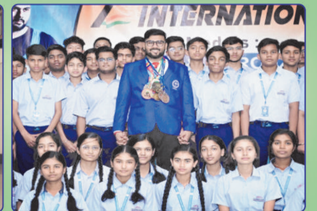
MOTIVATIONAL SESSION AT CAREER POINT WORLD SCHOOL BILASPUR