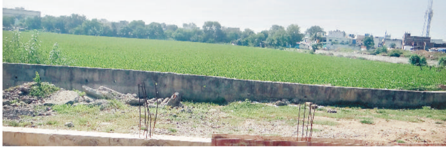
तालापारा स्थित वह तालाब जिसे संवारा जाना है।

भिलाई की टेका कंपनी पर सख्ती की तैयारी नए सिरे से जारी हो सकता है टेंडर