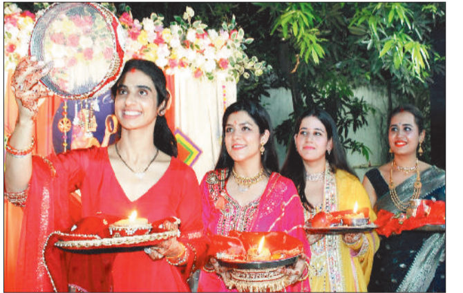
वीआईपी कालोनी में महिलाओं ने चांद देखकर पूजा की।