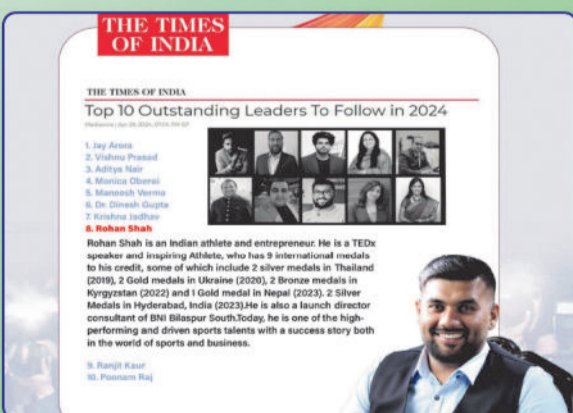
FEATURED BY TIMES OF INDIA