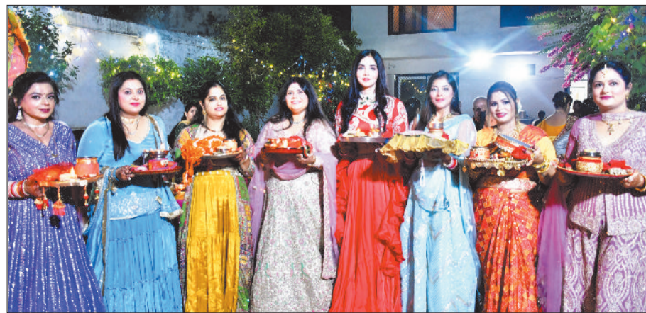
पति की लंबी आयु के लिए महिलाओं ने निर्जला व्रत रखा।