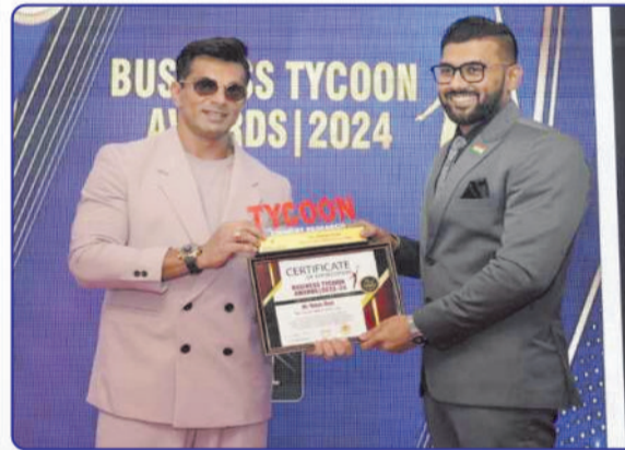
AWARDED BY KARAN SINGH GROVER MOST ICONIC ATHLETE OF THE YEAR 2024