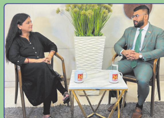
INTERVIEW WITH NEWS 24