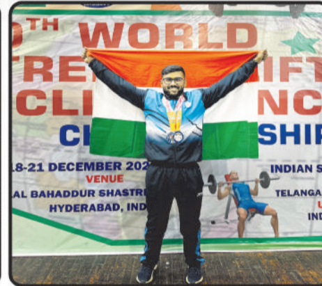
2 Silver Medal In 10th World Strength lifting & Incline Bench press Championship 2023. Held in India