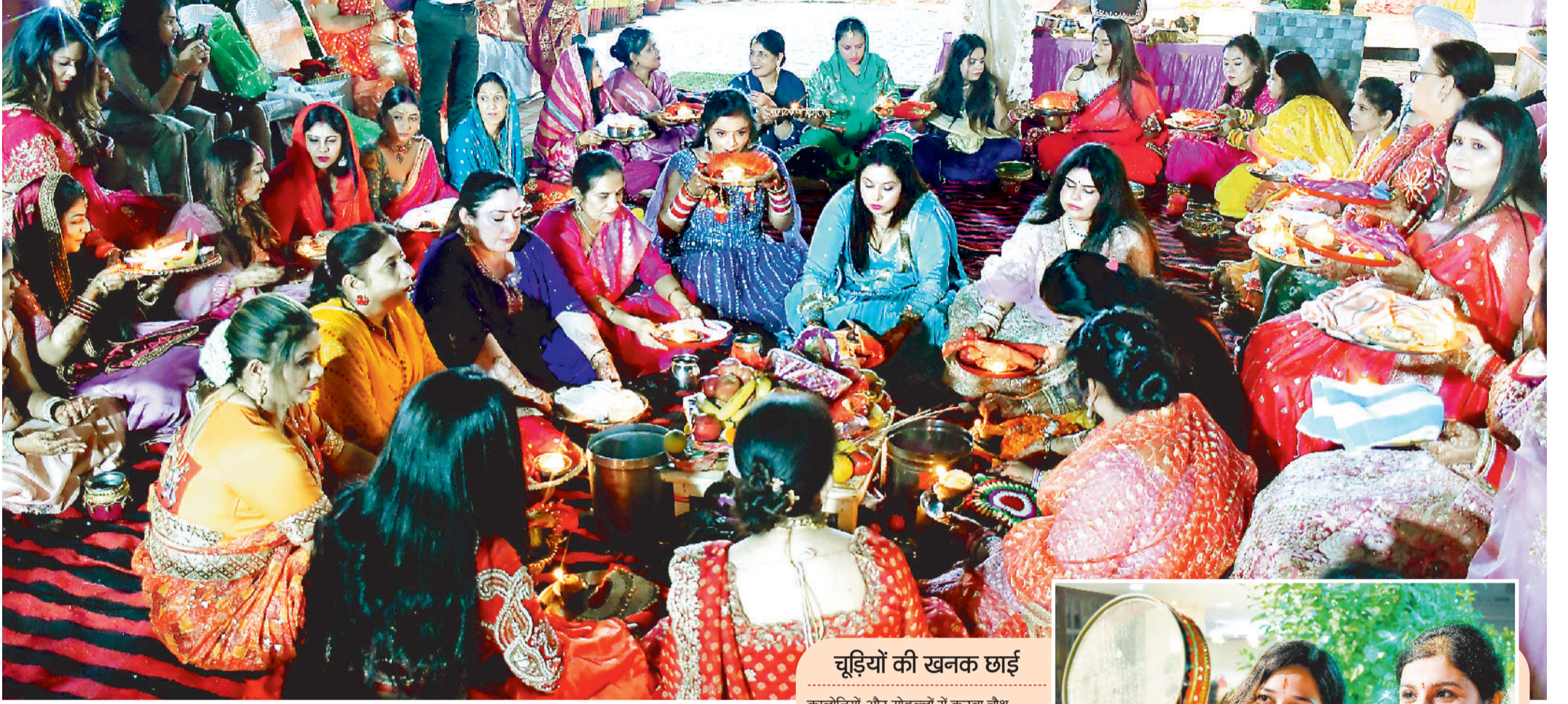
करवा चौथ पर महिलाओं ने बड़ी संख्या में विधि विधान से पूजा कर पति की दीर्घायु की कामना कर निर्जला व्रत रखा।

अखंड सुहाग व पति की दीर्घायु की कामना को लेकर रविवार को सुहागिनों ने निर्जला व्रत रखा और चांद की पूजा करने के बाद पति के हाथों जल ग्रहण कर व्रत खोला। शहर में संस्था, सोसायटी व मोहल्लों में बड़ी संख्या में महिलाओं ने करवा चौथ पर पूजा की। पूजा के पहले महिलाएं सोलह श्रृंगार कर तैयार हुईं, चांद निकलने के बाद चलनी से चांद देखने के बाद अर्घ्य देकर चंद्रमा की पूजा की और पति के हाथ से पानी पीकर व्रत खोला। साथ ही बड़े-बुजुर्गों का आशीर्वाद लिया।