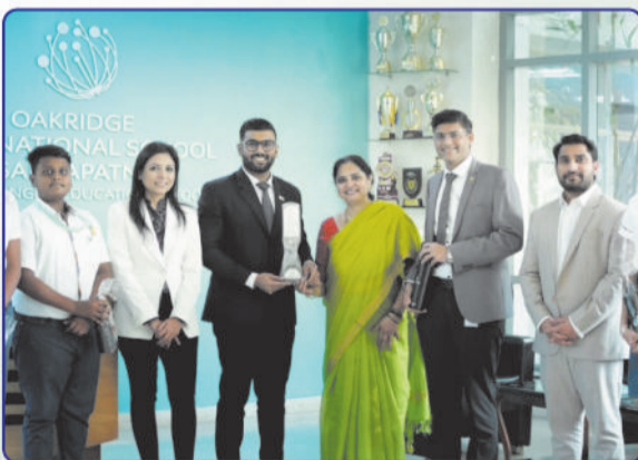
KNOW MORE ABOUT YOUR NATION CAMPAIGN AT OAKRIDGE INTERNATIONAL SCHOOL VISAKHAPATNAM