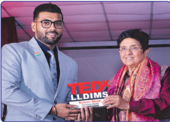
AWARDED BY KIRAN BEDI TEDx LLDIMS DELHI