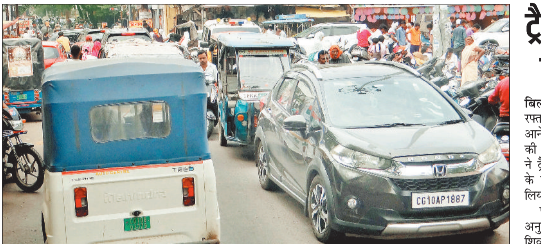
बहुसंख्यक बाजार में अधिकतर समय जाम लगा रहता है। अब लोग यहां से गुजरने से परहेज करने लगे हैं।

शहर में वाहनों की संख्या लगातार बढ़ रही है। बीते 3 वर्षों में शहर में एक लाख से अधिक चार पहिया वाहनों की बढ़ोतरी हुई है, इससे ट्रैफिक की समस्या बढ़ रही है, समस्या दूर करने निगम, स्मार्ट सिटी और पीडब्ल्यूडी के अंदर से चार बाइपास सड़कों के निर्माण की योजना बनाई थी। इसमें से दो पर काम चल रहा है, लेकिन गति धीमी है, वहीं दो सड़कें फाइलों में दबकर रह गई हैं। बाइपास कनेक्टिविटी नहीं होने से परेशानी बढ़ती जा रही है। मरीमाई मंदिर रोड का काम रुका पड़ा है। लिंक रोड से दीप होटल जाने वाली सड़क भी नहीं बन सकी और कचरे का अंबर लगा हुआ है। बसंत विहार चौक में जाम लगता है, वहां से अपोलो जाने वाले रास्ते में एक सड़क बननी थी जिस पर अभी काम शुरू नहीं हो सका है।