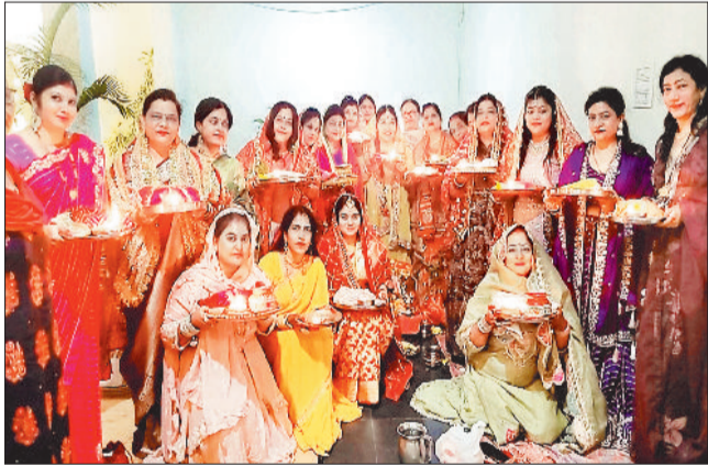
पारिजात एक्सटेशन कालोनी में महिलाओं ने पति की दीर्घायु के लिए व्रत रखा।