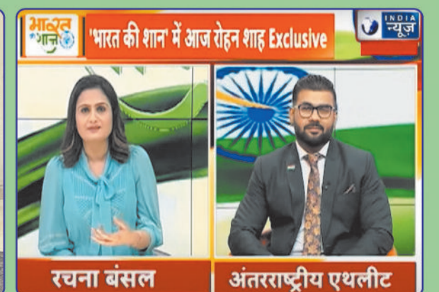
INVITED FOR INTERVIEW BY INDIAN NEWS (भारत की शान शो)