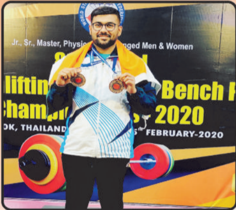
2 Silver Medals In 8th World Strength Lifting & Incline Bench press Championship 2019 Held in Thailand