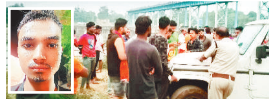
युवकों से पूछताछ करती पुलिस व इनसेट में मृतक।