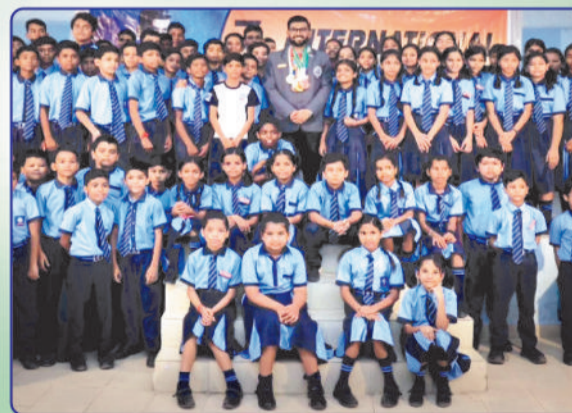
AWARENESS SESSION AT PRAYAS PUBLIC SCHOOL BILASPUR