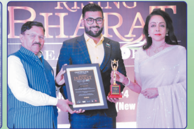
FELICITATED BY HEMA MALINI RISING BHARAT REAL HEROES 2024