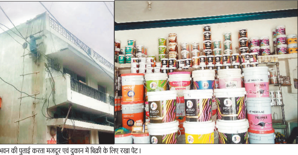
भवन की पुताई करता मजदूर एवं दुकान में बिक्री के लिए रखा पेंट।

गौरतलब है देश के साथ साथ प्रदेश एवं जिले के सबसे बड़े त्यौहार दीपावली इस वर्ष 31 अक्टूबर को मनाया जाएगा। दीपावली त्यौहार को अलग महज दस दिन का ही समय शेष बचा है। ऐसे में लोग पर्व को लेकर लोग अभी सही अपने घरों की साफ सफाई एवं रंग रोगन करने में जुट गए हैं। इसके लिए तकरीबन 10 से 15 दिनों पूर्व से ही घरों में तैयारी चल रही है। दीपावली त्यौहार को लेकर बाजारों में भी अलग-अलग कंपनियों के डिस्टेंपर एवं मैजिक की बिक्री हो रही है वहीं के दाम 180 प्रति लीटर से लेकर 600 प्रति लीटर तक नैरोलेक इंडिगो एशियन पेंट सहित अन्य विभिन्न प्रकार के कंपनियों के डिस्टेंपर बाजारों में बिक रहे हैं। इसी प्रकार मैजिक सेम प्रति 25 किलोग्राम 350 की दर से बिक रहा है। इधर दीपावली त्यौहार