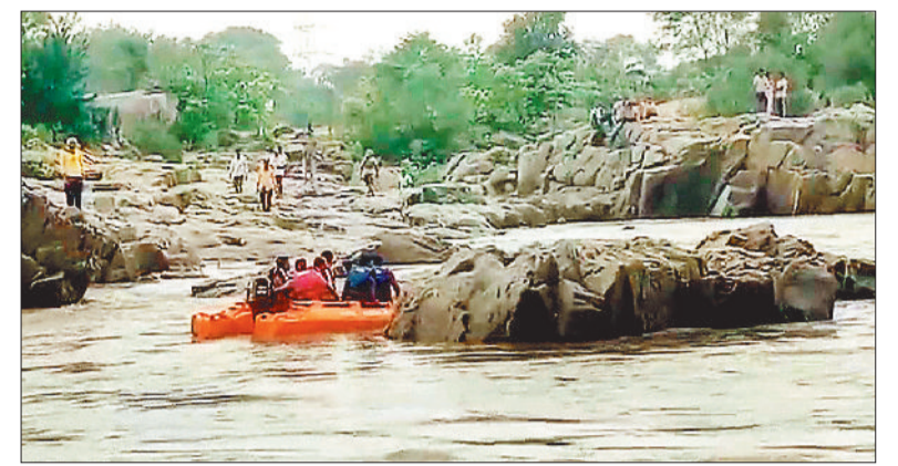
युवकों की खोजबीन करती एसडीआरएफ की टीम।

बाराद्वार क्षेत्र में भीमकाय वाहनों की आवाजाही लगातार होती रहती है। नगर समेत क्षेत्र में भी बड़े वाहनों से लेकर छोटे वाहन वाले अत्यधिक गति से चलते हैं जिससे सड़क बनने के बाद से दुर्घटना की संख्या बढ़ी है। नेशनल हाइवे के ठेकेदार के द्वारा नगर सीमा से पहले कहीं भी सूचना बोर्ड नहीं लगाया गया है जिससे वाहन चालकों की जानकारी ही नहीं हो पाता है कि आगे आबादी क्षेत्र है साथ ही स्पीड ब्रेकर होने से गति में कमी आएगी। नगर पंचायत की ओर से नगर क्षेत्र के मुख्य चौकी में सीसीटीवी कैमरे लगाए गए हैं लेकिन अभी भी लची स्थानों पर सीसीटीवी कैमरे की जरूरत है जिससे ऐसी दुर्घटना को अंजाम देने वाले ड्राइवर्स को इसकी मदद से पकड़ा जा सके। लोकलभा वृद्धावस्था के समय स्थानीय जनप्रतिनिधियों ने एस पी अंकित शर्मा से मुलाकात कर स्पीड ब्रेकर तथा सीसीटीवी की नगर में आवश्यकता को बताया था, जिस पर उन्होंने थाने में उस समय पदस्थ निरीक्षक गगन जायसवाल को इस हेतु प्रयास करने के लिए कहा गया था, लेकिन वही आज तक कुछ नहीं निकला है, जिससे सड़क दुर्घटना में लोगों की जान जा रही है।