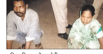
पुलिस गिरफ्त में आरोपी।

लीटर महुआ शराब व 25 किलो ग्राम महुआ लहान जब्त किया गया है। पकड़े गए दोनों आरोपियों के खिलाफ आबकारी अधिनियम के तहत अपराध पंजीबद्ध कर न्यायिक रिमांड