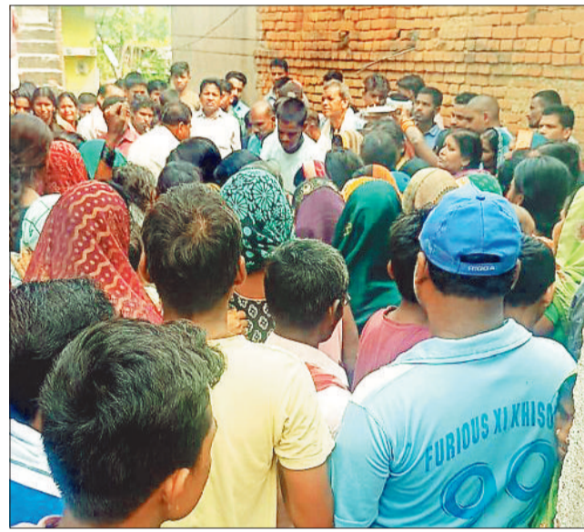
घटना के बाद लगी भीड़ को समझाइश देती पुलिस।