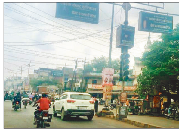
नेताजी चौक पर बंद पड़ा ट्रैफिक सिग्नल।

पड़ता है। इस पर व्यवस्था बनाने को लेकर जिम्मेदार विभाग का महकमा ध्यान तक नहीं दे रहे हैं। गौरतलब है कि जांजगीर शहर की ट्रैफिक सिग्नल व्यवस्था बदहाल हो चुकी है। शहर के कचहरी चौक, नेताजी चौक सहित अन्य जगहों पर लगाए गए ट्रैफिक सिग्नल मशीन खराब हो चुके हैं। जिसके चलते अकलतरा, केरा, चांपा, बलौदा, बिलासपुर सहित अन्य मार्गों की ओर आने जाने वाले