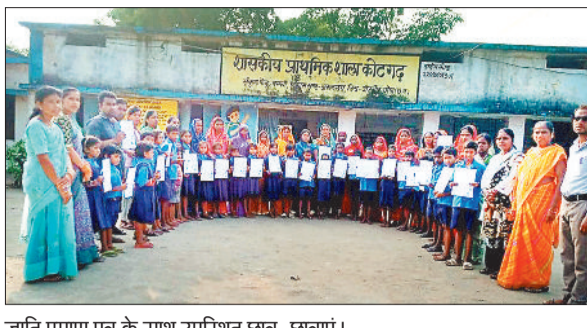
जाति प्रमाण पत्र के साथ उपस्थित छात्र-छात्राएं।