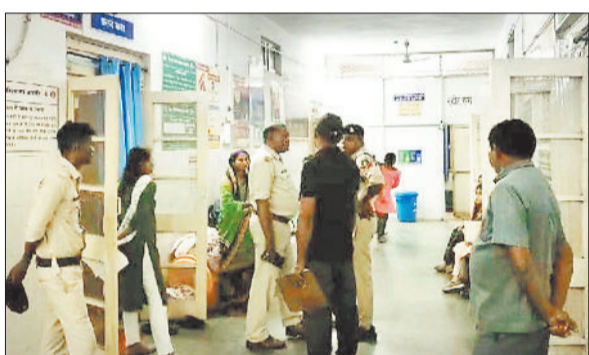
जिला अस्पताल में स्थिति का जायजा लेने पहुंचे पुलिस के अफसर।