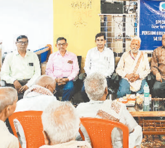
बैठक में उपस्थित पेंशनर एवं बैंक के अफसर।