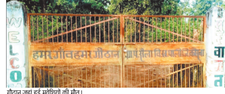
गौठान जहाँ हुई मवेशियों की मौत।