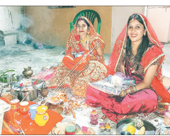
विधि विधान से पूजा-अर्चना कर लंबी उम्र की दुआ मांगती सुहागिन।

सुहागिन महिलाओं ने पति की लम्बी आयु की कामना को लेकर रविवार 20 अक्टूबर को करवा चौथ का व्रत रखा। शाम को महिलाओं ने सोलह श्रृंगार कर पूजा-अर्चना की तैयारी की। जब चांद का दीदार हुआ तो विधि-विधान से पूजा कर जल ग्रहण करके व्रत की मान्यता पूरी की। कार्तिक मास के कृष्णक्ष के चतुर्थी को करवा चौथ मनाया जाता है। पौराणिक मान्यताओं के अनुसार महाभारत में पाण्डवों की दशा को देखकर भगवान कृष्ण ने द्रौपदी को