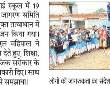
लोगों को जागरूकता का संदेश देते कार्यक्रम संयोजक एवं अन्य।