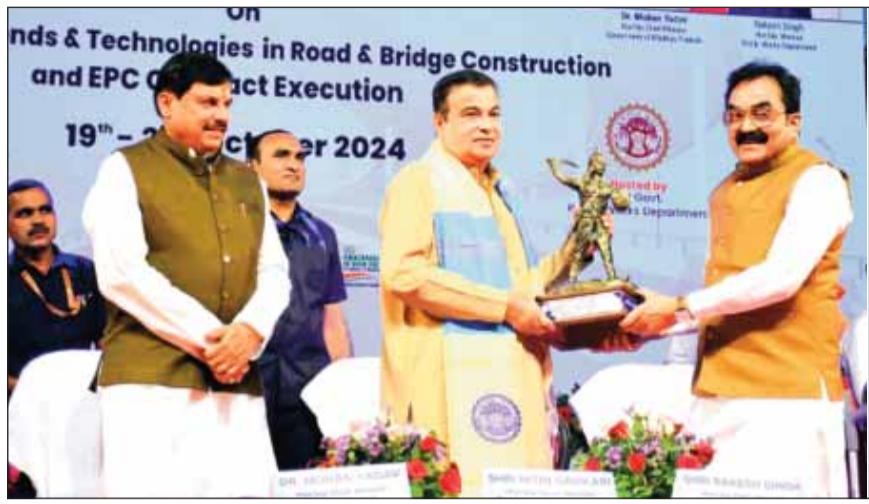
हरिभूमि न्यूज ॥ गोपाल

सड़क और पुल निर्माण के क्षेत्र में उभरते नवीनतम ट्रेन्ड्स और टेक्नोलॉजिज आधारित दो दिवसीय सेमिनार का भव्य उद्घाटन भोपाल के रवीन्द्र भवन में हुआ। इस मौके पर वर्ष 2047 के विजन के अनुसार प्लान बनाने से लेकर अन्य मुद्दों पर विस्तृत चर्चा हुई। सत्रों में प्रधानमंत्री ग्राम सड़क योजना के अंतर्गत नई तकनीकों के कार्यान्वयन, पुल निर्माण में नई मशीनरी का उपयोग, और सड़क निर्माण में उपयोग होने वाली नई सामग्रियों पर विशेष ध्यान दिया गया।