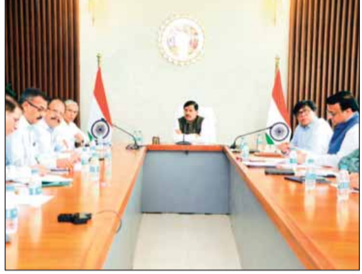
हरिभूमि न्यूज ॥ गोपाल

► प्रदेश के युवाओं को उनकी योग्यता के अनुरूप मिले सतत रोजगार ► मुख्यमंत्री ने स्व-रोजगार और रोजगार सृजन के संबंध में 11 विभागों की समीक्षा की