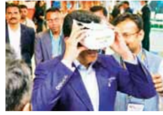
एजेंसी ►► नई दिल्ली

इंडिया मोबाइल कांग्रेस 2024 में आर्टिफिशियल इंटेलिजेंस (एआई) इस सीजन का मुख्य आकर्षण रहा जहां स्टार्टअप और शैक्षणिक संस्थानों सहित विविध टेक एवं